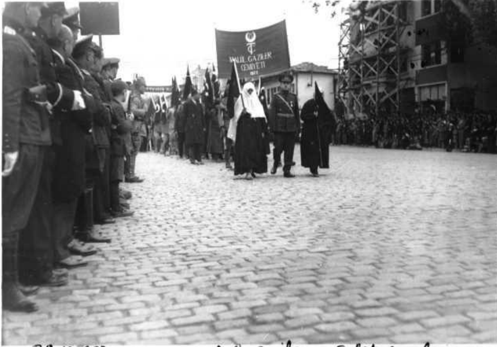
29.10.932. malli gaziler. Sebitt anaları