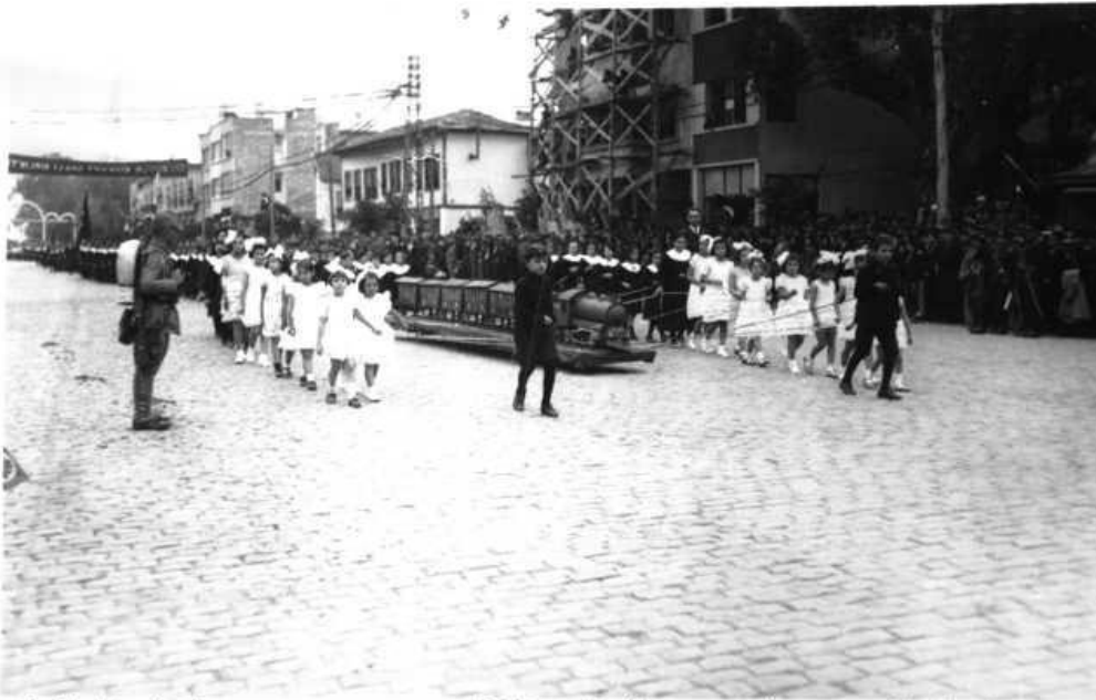
29.10.932. ilk okulların temsilcilerinden ..