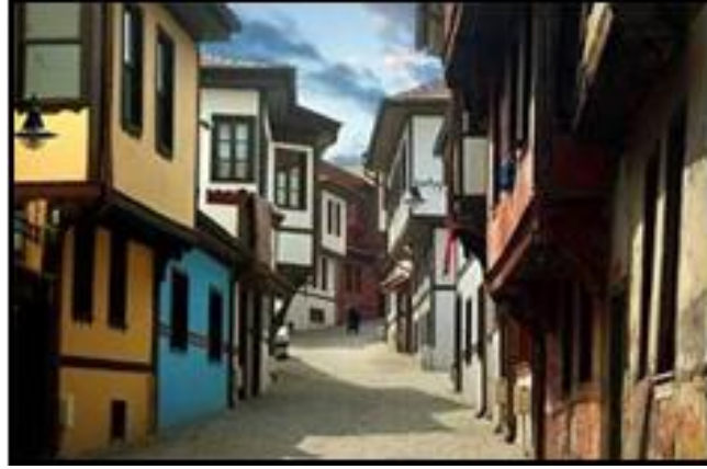
Görsel 8: Eskişehir Odunpazarı Evleri

http://www.eskisehirsanatderneği.org (Erişim Tarihi: 29.06.17)