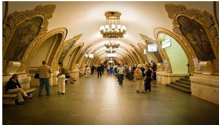
Görsel 26: Moskova Metroyu

https://www.archdaily.com/774717/spotlight-maya-lin (Erişim Tarihi: 07.01.19)