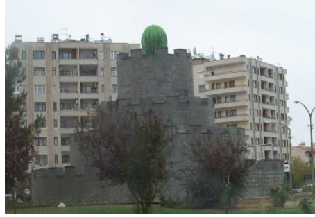
Görsel 3: Diyarbakır Karpuz Heykeli.

http://www.haticetunca.com/blog/?p=3582 (Erişim Tarihi: 29.06.17)