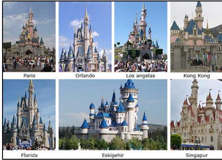
Görsel 23: Disneyland Şatoları ve Eskişehir Masal Şatosu

http://www.2eylul.com.tr/seni-taklitci-seni-makale,2403.html (Erişim Tarihi: 31.05.17)