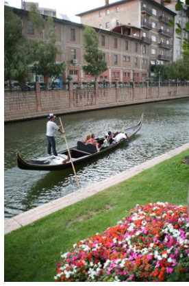
Görsel 12: Eskişehir.

bölgelerindeki Venedik benzeri görünümüleri ile bir Venedik teması yaşatmaktadır (Görsel 12 ve 13).