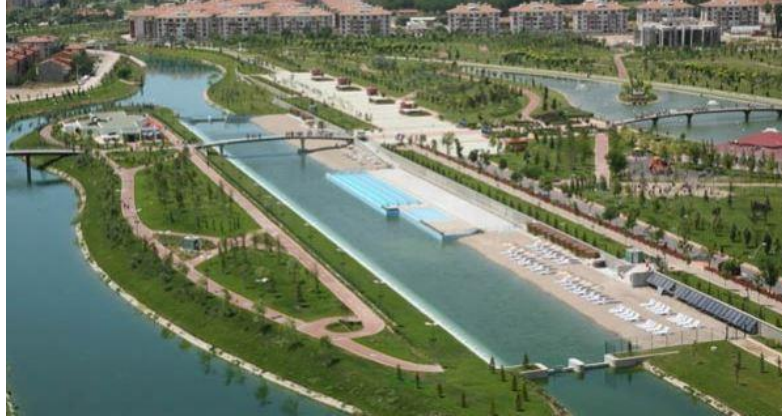
Görsel 7: Eskişehir Kent Park

Kent Park ve içerisindeki yapılar: Eskişehir şehirlerarası otobüs terminalinin karşısındaki 300 dönüm arazi üzerine kurulmuş bir parktır. Parkın içinde Türkiye'nin ilk yapay plajı bulunmaktadır. Bu park içerisinde 350 metre uzunluğunda gerçek deniz kumundan oluşturulmuş yapay plaj ve Porsuk çayının arıtılmasıyla suyun yanında bir de yüzme havuzu oluşturulmuştur (Görsel 7).