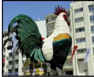
Görsel 5: Denizli Horoz Heykeli.

http://fotogaleri.hurriyet.com.tr/galeridetay/63254/2/6/sanliurfada-biber-heykeli (Erişim Tarihi: 29.06.17)