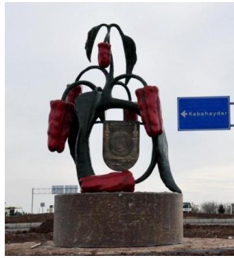
Görsel 4: Şanlıurfa Biber Heykeli.

http://www.haticetunca.com/blog/?p=3582 (Erişim Tarihi: 29.06.17)