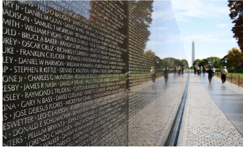
Görsel 25: Vietnam Anı Duvarı

Kentsel mekanda üretilen projelerin o kentin veya bölgenin tarihi coğrafyası ile uyumlu ve tarihi referanslara sahip olması beklenmektedir. Bu durum bölge insanının aidiyet hissini arttıracak gibi gelen ziyaretçiler üzerinde olumlu etkiler yaratacaktır (Filep, Thompson-Fawcett ve Rae, 2014, s. 310). Vietnam savaşı kayıplarının isimlerinin yer aldığı Amerika'da bulunan Vietnam Anısı Duvarı tarihi bir referansa sahiptir (Görsel 25). Moskova metrosu komünist rejim sürecinde çok sayıda işçi tarafından inşa edilmiş iç mimari ve dekorasyon anlamında dünyanın en güzel metrosu kabul edilen ve günümüzde işlerliğini koruyan bir projedir (Görsel 26). Her iki örnekte de kamusal alanda yapılmış tarihi referanslara sahip temalar günümüzde korunmakta ve kullanılmaktadırlar.