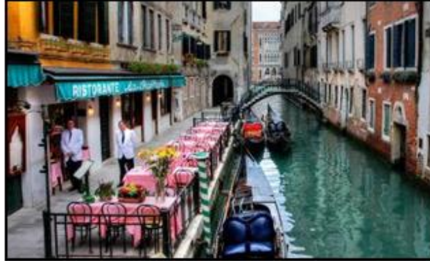
Görsel 13: Venedik.

Görünüü ile ister Venedik'e benzetilsin ister benzetilmesin dünyada su ile yaşayan pek çok şehir bulunmaktadır. Eskişehir su ve kanallarla olan mekan tasarımını ve reklamını daha çok benzerlik üzerinden kurgulayıp sunmaktadır.