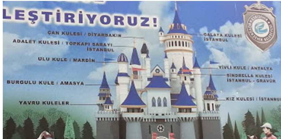
Görsel 24: Eskişehir Masal Şatosu Kuleleri

Eskişehir’de üretilmiş büyük ölçekli tematik projelerden biri ve üzerinde en çok tartışılan Sazova Parkı ve içinde inşa edilmiş Masal Şatosudur. Disneyland şatolarına benzerliği ile dikkat çeken ve eleştirilen bu şatonun kulelerinin Türkiye’deki ünlü kulelerden esinlenerek yapıldığı ifade edilmiştir (Görsel 23 ve 24).