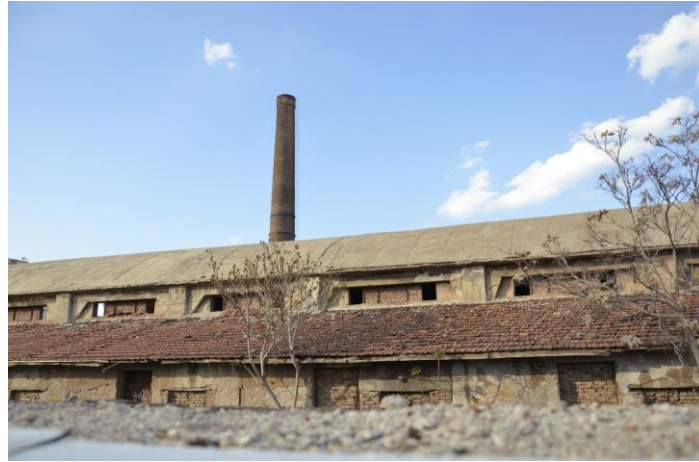
Görsel 29: Fabrikalar Bölgesi'nde bulunan ve yıkılmaya yüz tutmuş bir kiremit fabrikası

Tepebaşı'nda özellikle Bağlar mahallesinde günümüzde çoğu kaderine terk edilmiş bir şekilde duran kiremit ve tuğla fabrikaları bulunmaktadır. (Görsel 29). Bunlardan bazıları yıkılıp yerlerine rezidans, avm, kafeterya ve restoranlar gibi gümmümüzün modern veya post modern hayatının ihtiyaçları arasına giren binalar inşa edilmiştir. Bu fabrikaların sahip olduğu bacalar bölgeye ilginç bir mimari karakter kattığı, güçlü bir tarihi referansa sahip olduğu düşünülerek kimi fabrikaların bacaları örneğin Kurt Kiremit