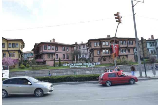
Görsel 27: Odunpazarı'nda rekonstrüksiyonu yapılan evler

Eskişehir Odunpazarı'nda yukarıda belirtilmiş olan Odunpazarı Evleri Yaşatma Projesi kapsamında yapılan çalışmalar tarihi referansa sahiptirler. Bölgenin geçmişine uygun olarak restore edilip korunmaya çalışılması olumlu bulunmaktadır. Ancak bunu yaparken yapay coğrafya ile uyum kapsamında yüzlerce yıldır ayakta kalan evlerin renk ve detaylarına dikkat edilmesi gerekmektedir. Proje kapsamında yayınlanan fotoğraflardan da okunduğu üzere böyle bir hassasiyetin kısmen gözetilmediği görülmektedir. Ayrıca bölgenin sınırında bulunan ve çarşıdan gelenleri karşılayan bir yüz olarak algılanabilecek bir sıra konağın (11 adet) rekonstrüksiyonu da bu konuda tartışmalı sayılabilecek bir yapım hikayesine sahiptir. Bu konakların Kurtuluş Savaşı sırasında kaçan Yunan askerleri tarafından tamamen yakıldığı ve 2011 yılında yerinde orijinaline uygun olarak butik otel ve restoran olarak yapıldığı bildirilmektedir (Görsel 27). Ancak orijinallerine dair her hangi bir fotoğraf kaydı yada projeye dair çizimler bulunmayan bu konakların orijinaline uygun yapılması imkansızdır. Bununla birlikte bu bölgede yapılabilecek örneğin bir apartman yapısının yerine en azından bölgenin mimari ve tarihi yapısıyla uyumlu olabilecek yapıların tercih edilmiş olması da oldukça önemlidir.