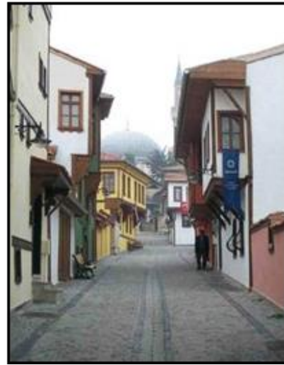
Görsel 14: Kurşunlu Cami Sokak'ın Sokak Sağlıklaştırma Çalışmaları Öncesi Durumu.

http://odunpazarihouses.com/wp/wp-content/uploads/2011/05/bResim1.jpg (Erişim Tarihi: 03.07.17)