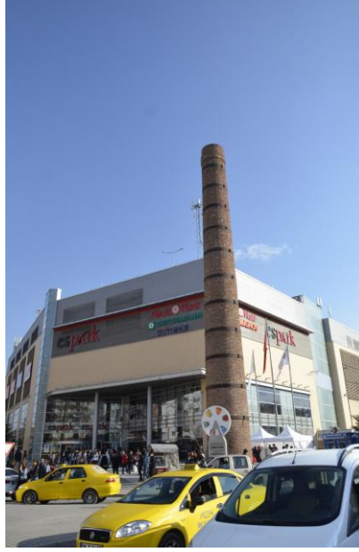
Görsel 28: Yıkılan Kurt Kiremit Fabrikası'nın yerine yapılan Espark Avm ve yıkılıp yeniden yapılan baca.