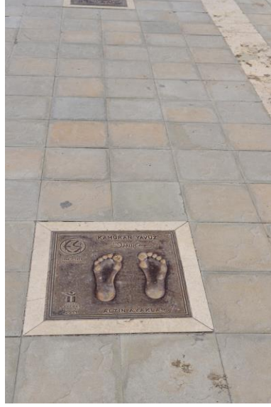
Görsel 22: Eskişehir, Altın Ayaklar Düzenlemesi

Eskişehir'deki tematik projelerin çoğunluğunu şehrin çeşitli yerlerinde bulunan ve Türkiye'deki diğer illere göre sayıları oldukça fazla olan heykeller oluşturmaktadır. Bunlardan biri ve aynı zamanda şehrin simgelerinden biri haline gelen sohbet eden iki kadın heykelidir (Görsel 20). İletişim, ifade, karşılıklı paylaşım ve demokratik özgürlükçü temalarda üretilmiş bu heykel grubu, şehrin sakinleri ve turistlerin en çok dikkatini çekenler arasındadır. Bunun yanında iki önemli örnek daha vardır ki aşıkların birbirleri için asma kilitler taktıkları kalp şeklindeki bir düzenleme (Görsel 21) ve geçmişten günümüze Türk sporunda önemli yer edinmiş kişilerin ayak izlerinden oluşturulan "Altın Ayaklar" düzenlemesi (Görsel 22) de şehrin kültürel coğrafya ile kurduğu ilişkilerin göstergesidir.