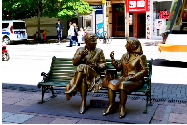
Görsel 20: Eskişehir, Konuşan Kadınlar Heykeli.

Türkiye'deki kentler nüfus özelliklerine göre memur kenti, öğrenci kenti; yaşam biçimlerindeki farklılıklara göre Karadenizli, Egeli, Doğulu kentler; dini etmenlere göre Mevlana kenti, peygamberler şehri; zenaatlara göre bakır kenti, lületaş kenti vb. isimler almaktadırlar. Eskişehir'in kültürel coğrafyası nüfus dağılımı bakımından genel olarak iki bölgeye ayrılmaktadır. Birincisi Anadolu Üniversitesi ve çevresindeki öğrencinin yüksek yoğunlukta olduğu bölgeler; ikincisi Odunpazarı ve çevresindeki yerleşik ailelerin yüksek yoğunlukta olduğu bölgeler. Kentin imajı çoğunlukla üniversite öğrencileri üzerinden vurgulanmaktadır. Basında çıkan haberler ve reklamlarda üniversite şehri vurgusu dikkat çekmektedir.