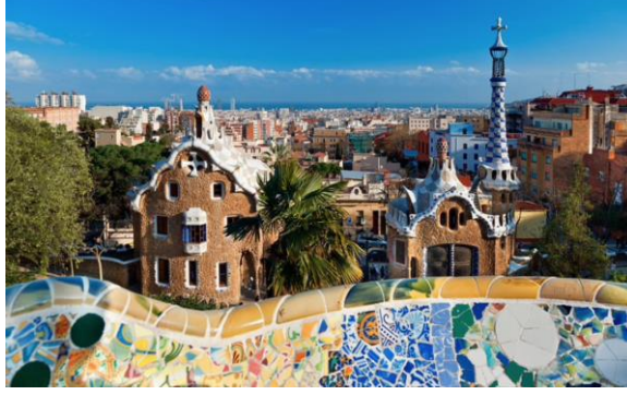
Görsel 10: Antonio Gaudi, Park Guel.

Barselona'daki Park Guell ise ünlü mimar Antonia Gaudi'nin 1914 yılında atık seramik parçalarından yapılarla oluşturulmuş bir bahçe kompleksidir (Görsel 10). Roma'daki Trevi Çeşmesi ise çevresindeki mimari yapılarla uyumuyla dikkat çekmektedir (Görsel 11).