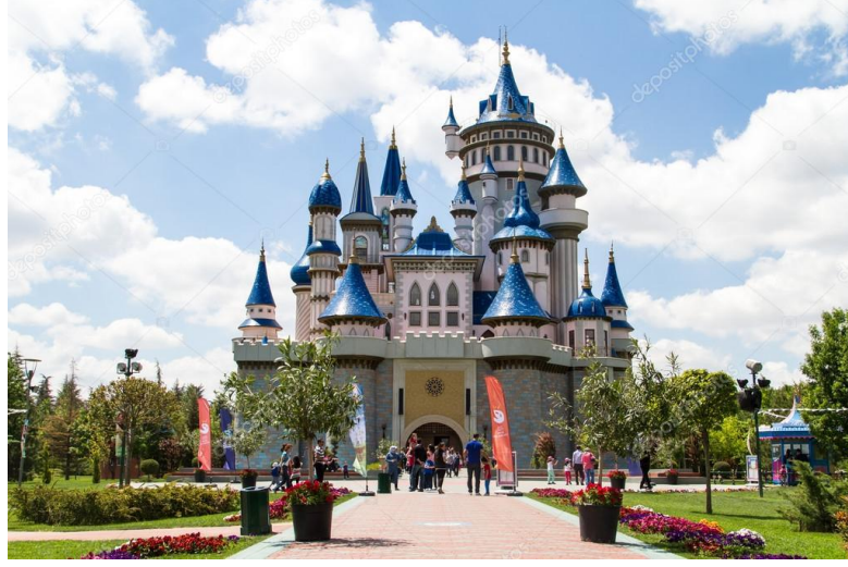
Görsel 6: Eskişehir Sazova Parkı

Sazova Parkı ve içerisindeki yapılar: Eskişehir'in en önemli gezi noktalarından olan Sazova Mahallesi'nde, 400 bin metrekare üzerine kurulu, içerisinde tema bakımından birbirinden tamamen farklı yapıları bünyesinde bulunduran bir parktır. Daha çok çocuklara hitap eden yapıları içeren Sazova Parkı masalsi olanla gerçek olanı çocukların hayal dünyalarındakiyle televizyonda gördüklerini bir araya getirir. Masal Şatosu, Korsan Gemisi, Yapay Gölet, Bilim ve Deney Merkezi, Sabancı Uzay Evi, Eti Sualtı Dünyası, amfi tiyatro, ağaç ev ve Şirinler'in evi tarzında çeşitli oyun grupları, kafe, restoranlar ve hediyelik eşyalar satan dükkanlar gibi yapıların yer aldığı parkta halen yeni yapıların inşası devam etmektedir (Görsel 6).