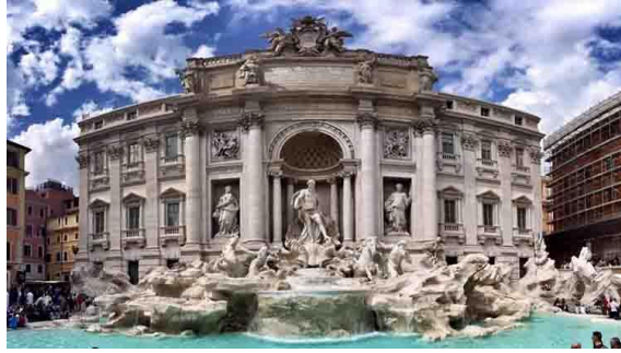
Görsel 11: Trevi Çeşmesi, Roma.

Eskişehir kamusal alanları için üretilen popüler projelerin başında Kent Park ve yapay plaj gelmektedir. 300 bin metrekare genişlikteki bu yeşil alan Eskişehir otogarının yanında Gökmeydan mahallesinde konumlandırılmıştır. Kent park içerisinden geçen Porsuk Çayının kollarından birinin düzenlenerek kıyısına deniz kumu getirilmesi ile Büyükşehir Belediye Başkanı Yılmaz Büyükerşen'in en büyük hayallerinden biri gerçekleşmiştir (Eskişehir Büyükşehir Belediyesi, 2008).