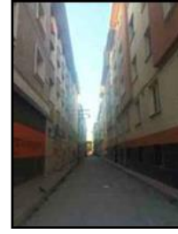
Görsel 18: Eskişehir'de tuğla ve kiremit fabrikalarında çalışanlar için yapılan evlerden bir görünüm 1952.

Eskişehir Kılavuzu Derleme Bürosu, 1952: 85