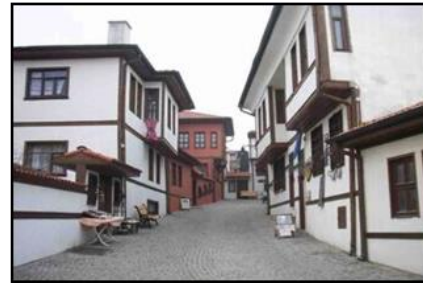
Görsel 16: Beyler Sokak’ın Sokak Sağıklaştırma Çalışmaları Öncesi Durumu.

http://odunpazarihouses.com/wp/wp-content/uploads/2011/05/aResim1.jpg (Erişim Tarihi: 03.07.17)