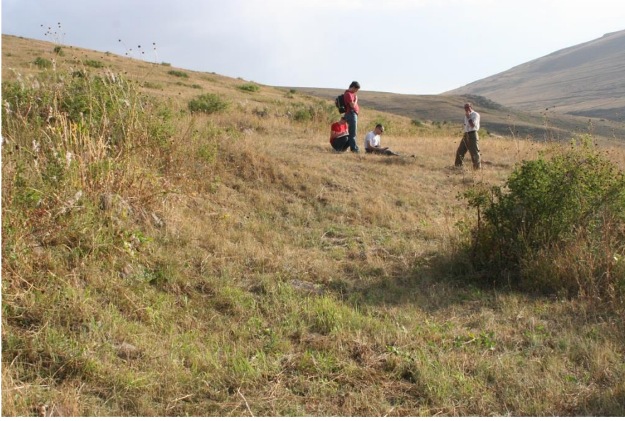
Şekil-9 Değirmen Mevkii