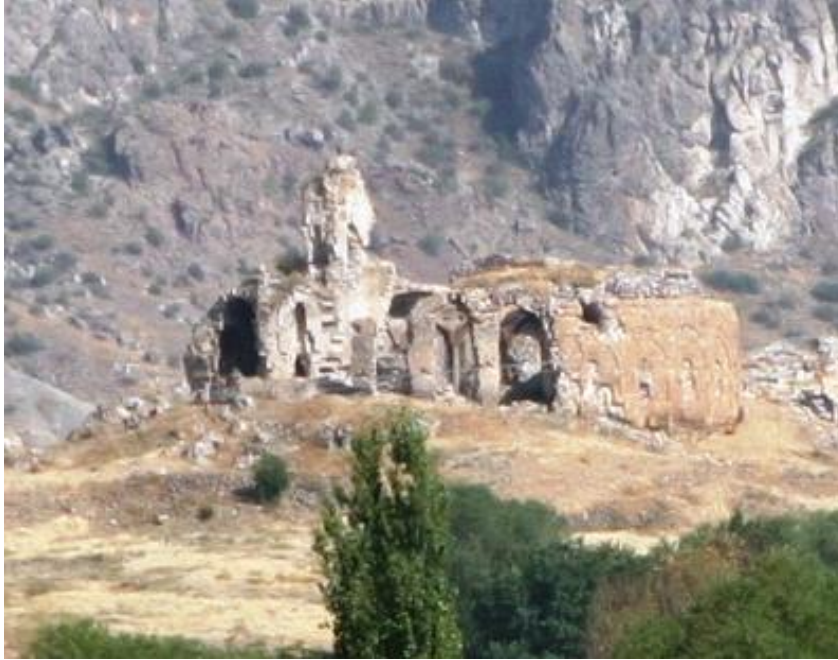
Şekil-12 Penek Kalesi/Kilisesi