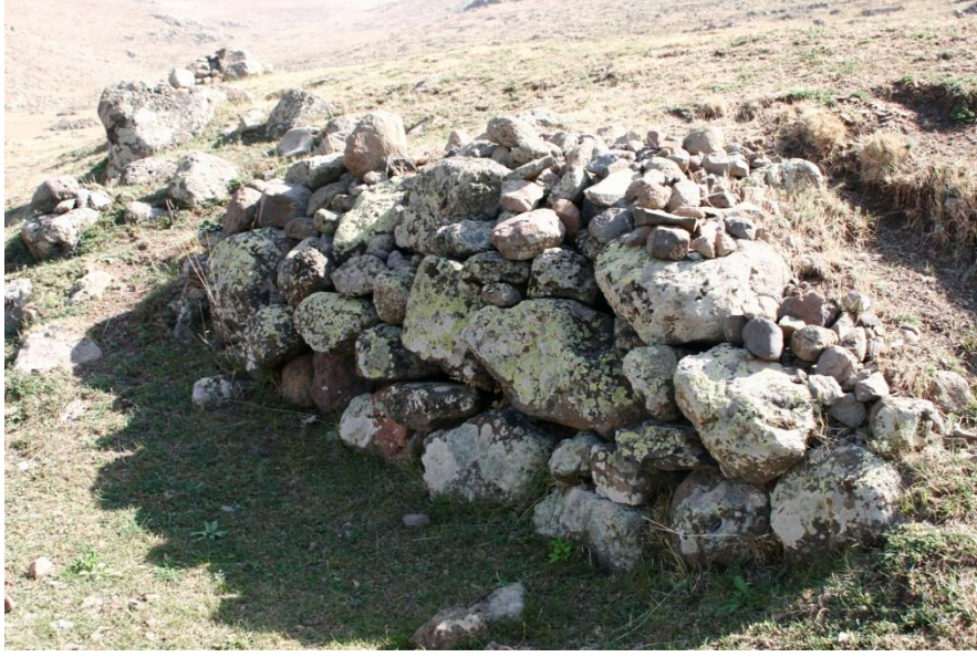
Şekil-5 Şenkaya Kalealtı Yerleşmesi