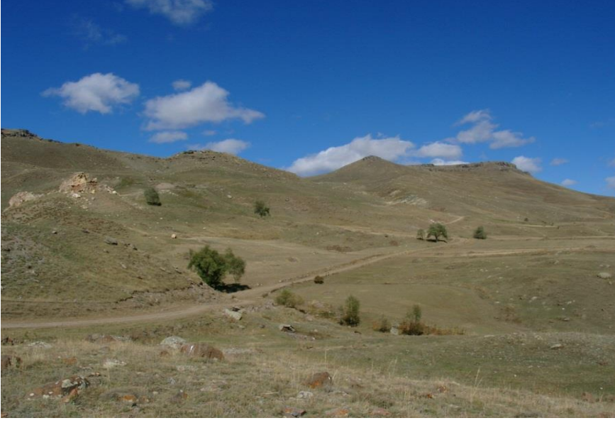
Şekil-7 Zakim Kalesi