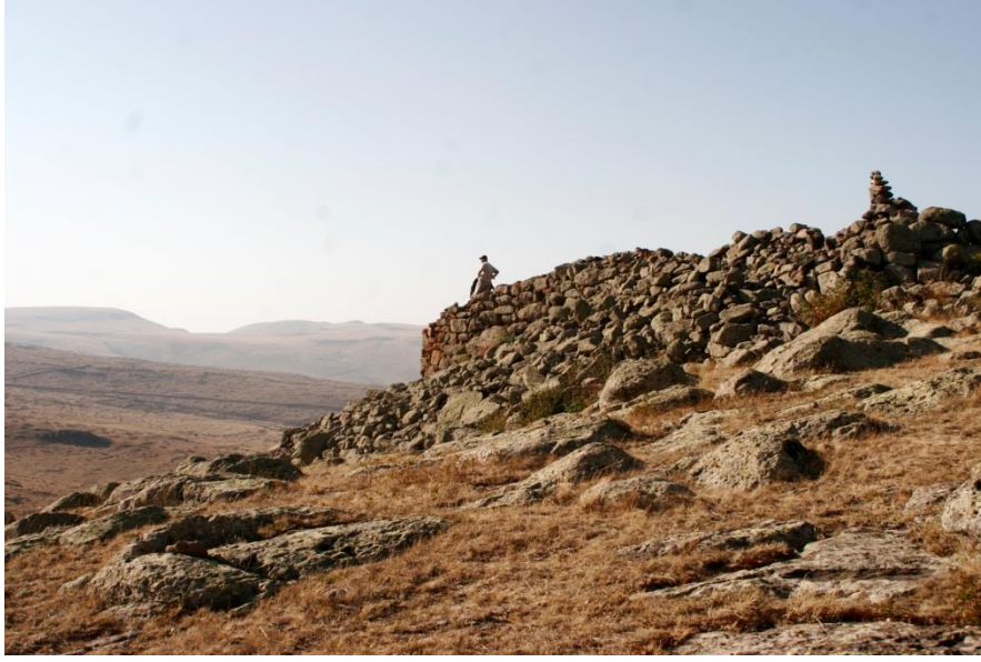
Şekil-3 Şenkaya Kalesi-I