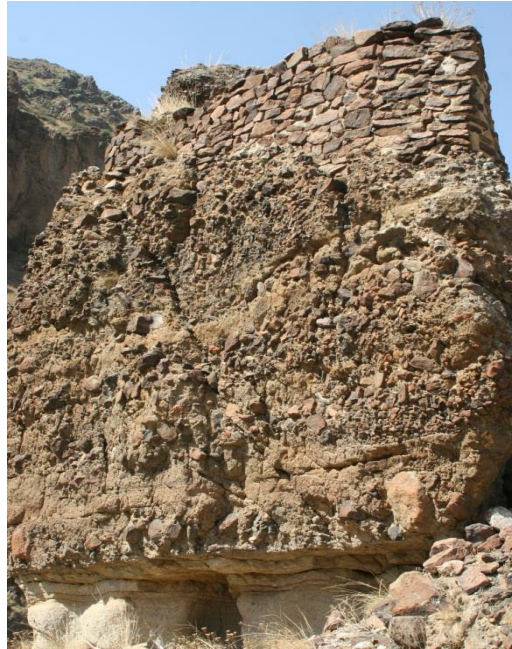
Şekil-6 Köroğlu Kalesi