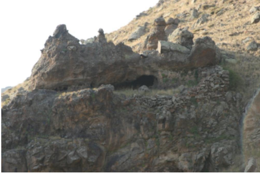
Şekil-11 Kızıltaş Mağara Yerleşim Alanı