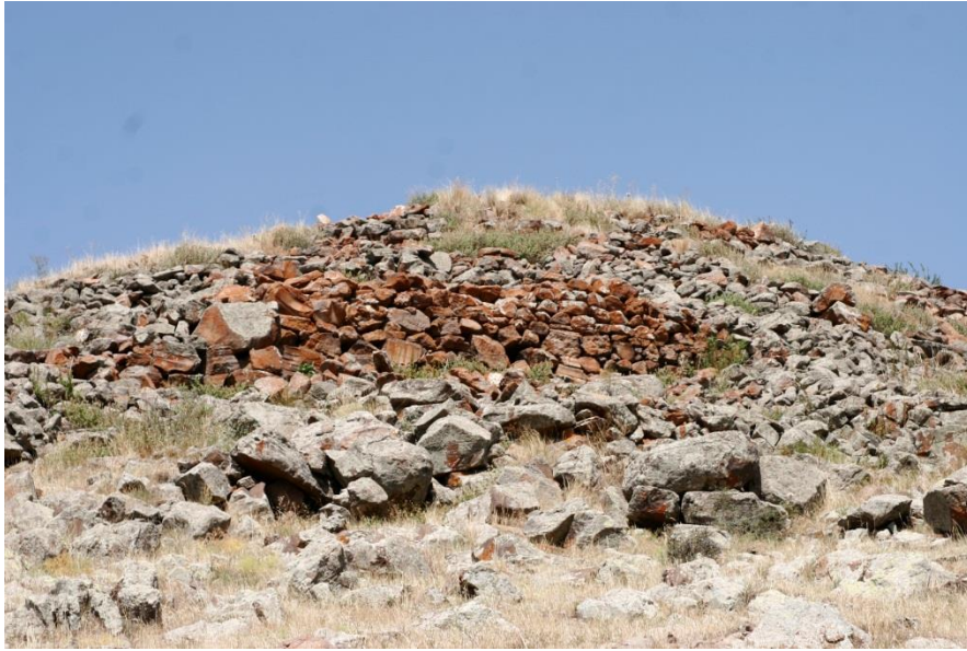
Şekil-4 Şenkaya Kalesi-II