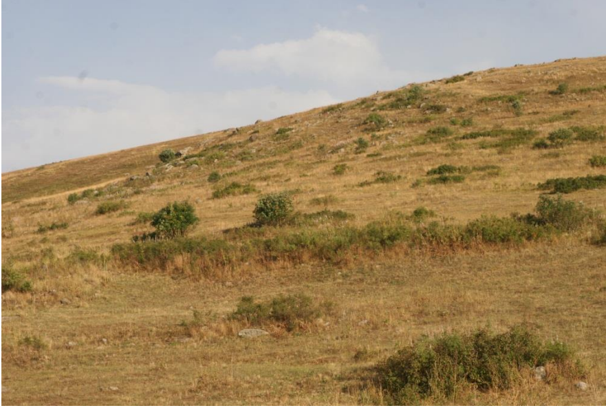
Şekil-10 Murathan Yerleşmesi