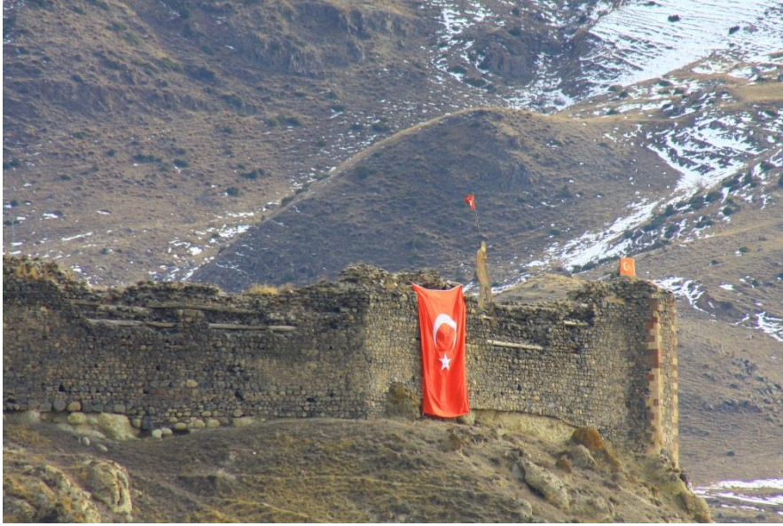
Şekil-8 Bardız Kalesi