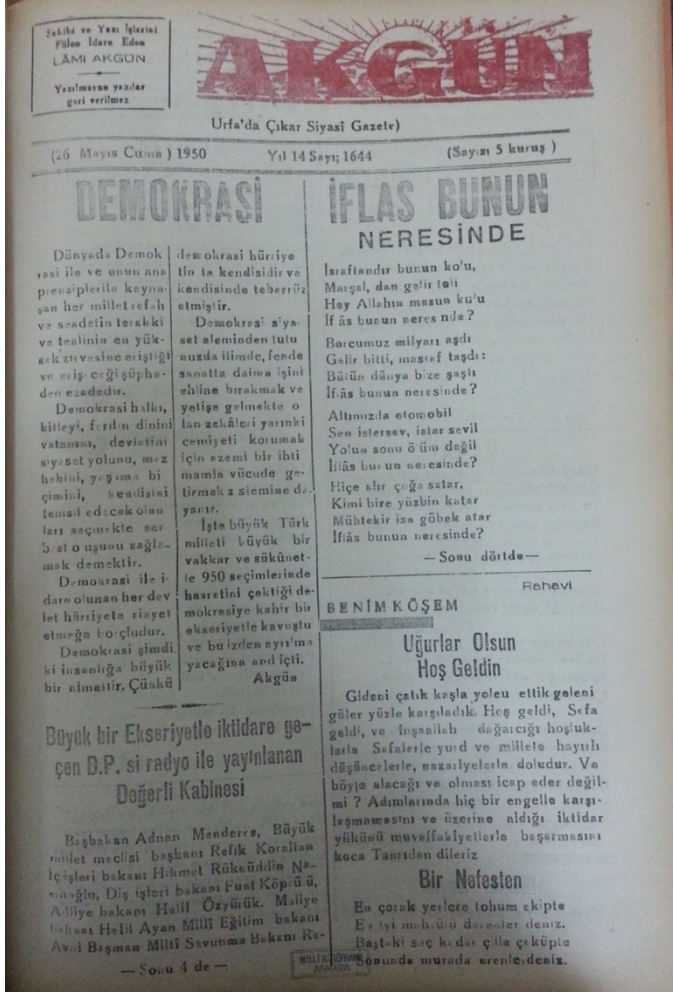
Demokrat Parti'nin ilk zaferi olan 14 Mayıs 1950 seçimlerinin Urfa basınına yansması.