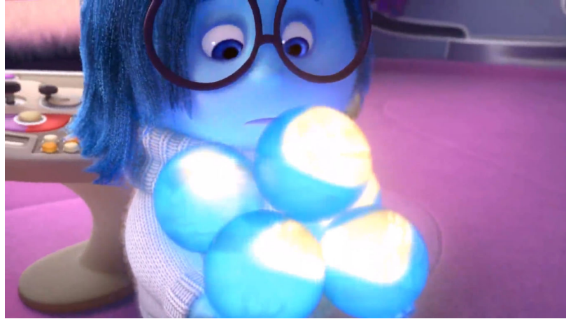
Foto 11. Üzüntünün çekirdek anıları eline aldığı sahneden bir kesit