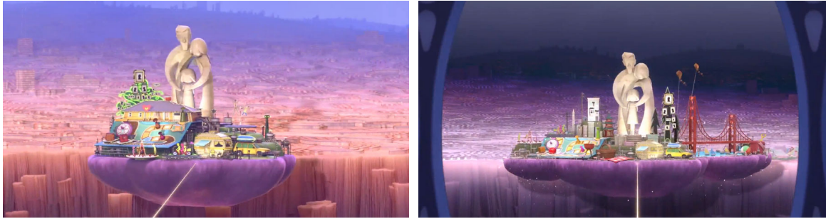
Foto 13. Minnesota’daki aile kişilik adası (İlk foto), San Francisco’da yeniden oluşan aile kişilik adası (İkinci foto)

Taşındıktan sonra Riley’nin tüm kişilik adaları yıkılır. Çünkü Riley onları Minnesota’da oluşturmuştur ve artık kişilik adalarının olduğu zemin olan Minnesota’da yaşamıyordu. Kişilik adalarının hepsi yıkılana kadar Riley hep mutlu olmaya çalışmıştır. Ancak yaşadığı özlem onun mutlu olmasını engellemiştir. Tüm kişilik adaları yıkıldıktan sonra üzüntü duygusu kontrol masasına geçmiştir ve Riley Minnesota’dan ayrılmanın üzüntüsünü yaşamaya başlamıştır ve bu üzüntüsünü ailesi ile paylaşmıştır. Bunun üzerine yıkılan aile adası San Francisco’da yeniden oluşmuştur. Yeniden oluşan aile adasında San Francisco’nun simgesi olan Golden Gate Köprüsü eklenmiştir (Foto 13). Bu durum kişilik adalarının yer ile ne kadar ilişkili olduğunu ortaya koyması açısından çok manidardır. Nasıl oluştuğuna filmde yer verilmese de yıkılan diğer kişilik adaları San Francisco’da yeniden oluşmuştur.