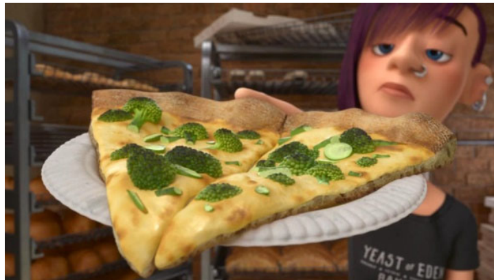
Foto 9. San Francisco'ya özgü brokolili pizza

Yer ile kurulan ilişkide kaynak ve hedef bölge arasındaki farklılıklar da etkili olmaktadır. Farklılıklar ne kadar fazla ise yer ile kurulan ilişki süreci o kadar zorlaşmaktadır. Filmde farklılık brokolili pizza sahnesinde karşımıza çıkmaktadır (Foto 9). Karnı acıkan Riley pizza yemek için annesi ile dışarı çıkar. Ancak hayatında ilk defa sadece brokolili pizza yapan bir dükkâna gider ve pizzayı yiyemez. Tiksinti ve öfke duyguları ile dolar. Farklılıklar hem Minnesota'ya özlem duymasına sebep olmakta hem de San Francisco ile kurulan ilişki sürecini uzatmakta ve zorlaştırmaktadır.