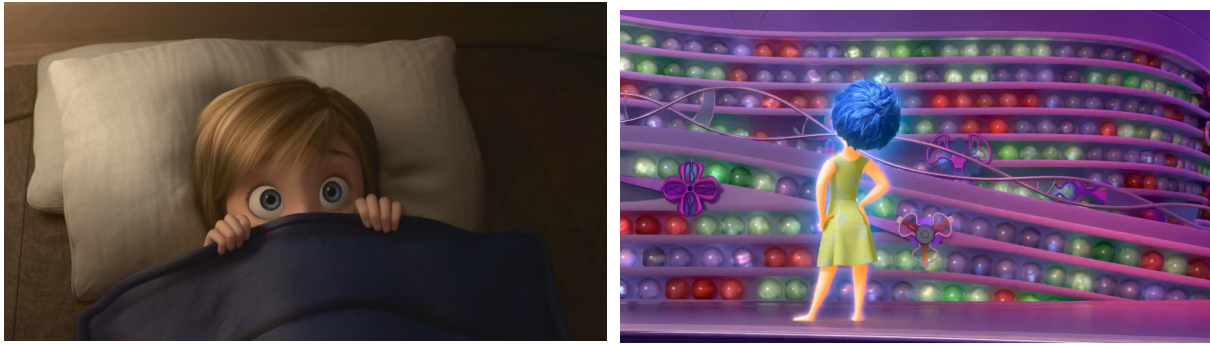
Foto 10. Riley Minnesota'daki ilk gecesinde odasında korktuğu sahneden bir görüntü (İlk foto), Riley'nin Minnesota'daki ilk gününde yaşadığı duygular (ikinci foto)

İnsanlar yer duygusu hissettikleri yerde güvende ve konforlu hissederler, korkmazlar. Ancak Riley San Francisco’da geçirdiği ilk gecede korkuyor (Foto 10). Bu durum San Francisco’nun onun için hala anlamlı bir yer haline gelmediğini ve burada yer bağlılığı hissetmediğini gösteriyor. Minnesota’da Riley’in günün sonundaki anılarının çoğu sarı (Neşe) renkte iken San Francisco’daki ilk gününün sonunda anılar çoğunlukla yeşil (tiksinti), mor(korku) ve kırmızı(öfke) renklerde (Foto 10). Yani yeni yaşam yerinde Riley mutlu olmamıştır. Çünkü burası onun için hala bağlarının olmadığı yabancı bir mekândır. Yer duygusu hissetmediği için konforlu da hissedememektedir. Burada mavi(üzüntü) yoktur. Çünkü diğer duygular özellikle Neşe, Riley üzülmesin diye Üzüntü ’nün kumanda masasına geçmesini engellemiştir. Yani Riley mutlu olmak için kendini zorlamaktadır ama aslında çok üzgündür.