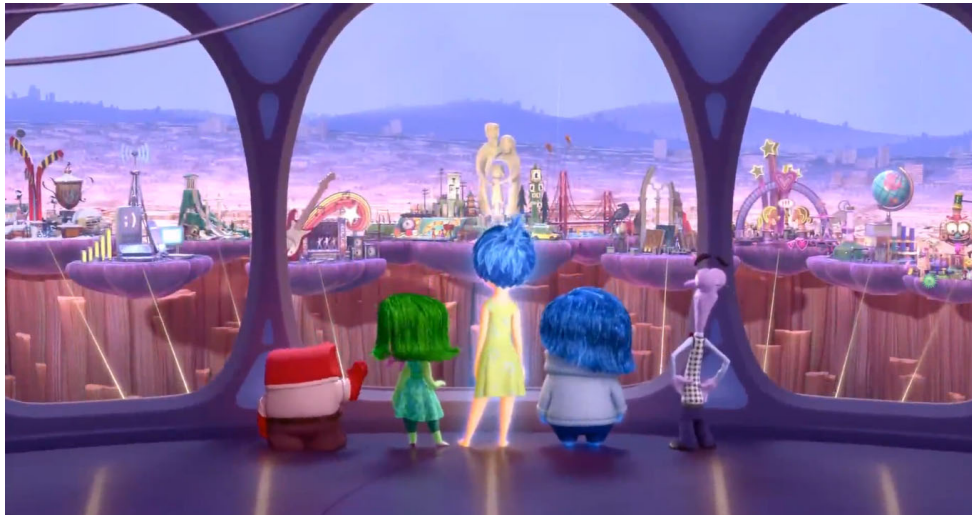
Foto 12. Riley’nin 12 yaşındaki kişilik adalarından bir görünüm

Yer ile kurulan ilişkiyi etkileyen bir diğer faktör, zamandır. Tuan (1977) ve Relph (1976) bir yerdeki ikamet süresinin, yer duygusunun potansiyel bir kestiricisi olduğunu savunmaktadır ve bir yerde daha uzun yaşayan bireylerin, daha az zaman harcayanlara kıyasla, yerin fiziksel özelliklerine bağlanacağını ve daha ileri düzey sosyal ilişkiler geliştirme ihtimali olduğunu öne sürmüştür. Kasarda ve Janowitz (1974), Sampson (1988) yaptıkları çalışmada bir yerde yaşama süresinin, bireylerin o yere olan bağlılıklarını önemli ölçüde etkilediğini ortaya koymuşlardır. Filmin sonunda taşınmanın üzerinden bir yıl geçmiş ve Riley 12 yaşına girmiştir. Bu zaman zarfında San Francisco ile bağ ve bağlantılar oluşmuştur. Yıkılan aile, dürüstlük, arkadaşlık, hokey ve maskaralık adaları San Francisco’da yeniden oluşmuş, bunların yanına hüznü vampir romantizmi, moda, genç müzik kişilik adaları da eklenmiştir (Foto 12). Zaman ve deneyimler sayesinde yeni kişilik adaları eklenmiştir. Bazı kişilik adaları San Francisco deneyimleri ile başka bir hal almıştır.