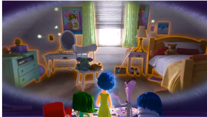
Foto 7. Riley odasını nasıl yerleştireceğini hayal ettiği sahneden bir görüntü

Riley bu evi anlamlı hale getirmelidir çünkü artık burada yaşayacaktır. Mekanı anlamlı bir yer haline getirmenin yollarından biri kendilemedir. Ellialtıoğlu (2007) yaptığı tez çalışmasında kendilemeyi en genel anlamda bir şeyi kendisi için alma, kendi kullanımına ayırma eylemi, psikolojik anlamda ise duyumsal, devimsel ve algısal etkinlikle kendi kontrolünü tanımayı, bireyin, şeylere ve dünyaya hakim bir konuda görülmesi olarak tanımlamıştır. Eve girince Riley hemen kendi odasını görmek ister. Ancak odası ona yabancıdır, odasını sevmez ve mutsuz olur. Bunun üzerine Riley kendi odasını nasıl yerleştireceğini düşünür ve eşyaları nerelere koyacağını hayal ederek odasını kendilemeye çalışır (Foto 7). “Kendileme, bir yerin ya da mekanın dönüştürülmesiyle ortaya çıkan, bireyin ya da toplumun otoritesi, bir denetim göstergesi olarak görülebilir. Birey kendine ait, kendinin kıldığı bir mekanı, düzenlemekte, organize etmekte ve diyalektik olarak diğerlerinin mekanına ve/veya çerçeveye göre farklılaştırmaktadır. Bu olgu, genel olarak kendileme (kendinin kılma, sahiplenme kavramıyla da ifade edilmektedir” (Bilgin, 1997).