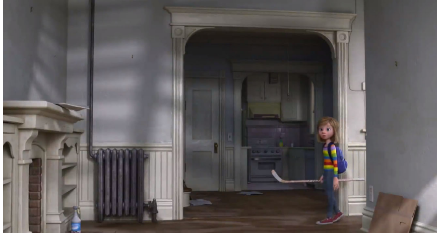
Foto 3. Riley'nin yeni evini hokey sopası ile gezdiği sahneden bir kesit

Filmin sonunda ise Riley San Francisco'da bir hokey takımına giriyor ve ailesi tüm maçlarını izlemeye geliyor, ancak hokey kimliklerinin bir parçası olduğu için diğer insanlardan farklı görünüyorlar, bu onların Minnesotalı olmaları ile yakından ilgili bir durumdur (Foto 4).