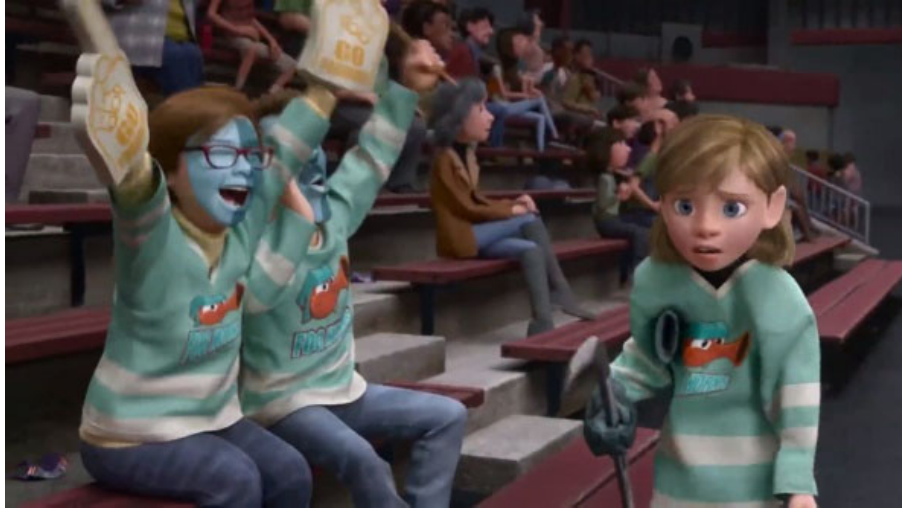
Foto 4. Filmin sonunda ailesinin Riley'nin San Francisco'daki hokey maçını izlemeye geldiği sahneden bir görüntü

Filmin sonunda ise Riley San Francisco'da bir hokey takımına giriyor ve ailesi tüm maçlarını izlemeye geliyor, ancak hokey kimliklerinin bir parçası olduğu için diğer insanlardan farklı görünüyorlar, bu onların Minnesotalı olmaları ile yakından ilgili bir durumdur (Foto 4).