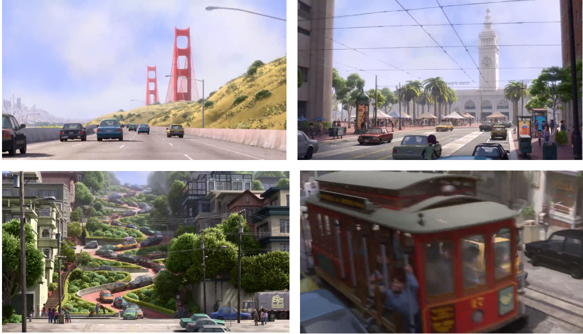
Foto 5. San Francisco'ya girişte gösterilen San Francisco'ya ait imajlar: Golden Gate, Saat Kulesi, Tramvay yolu, Lombard Caddesi (saat yönünde sırayla)

Riley ve ailesinin San Francisco'ya taşınmasıyla filmin ana konusu başlamaktadır. Riley güçlü bağlarının olduğu Minnesota'dan hiç bilmediği San Francisco'ya taşınmaktadır. San Francisco'ya girer girmez Golden Gate Köprüsü, Saat Kulesi, Lombard Caddesi, Tramvay Yolu gibi San Francisco'ya özel yerler karşımıza çıkıyor (Foto 5). Bunlar metonimik öğelerdir. San Francisco'nun kimliğini oluşturan parçalar gösterilerek San Francisco kenti tanıtılmaktadır. Sonuç olarak San Francisco'nun özel yerlerini öğreniyoruz. Mekânı zihnimize inşa ediyoruz bir nevi. Yani bağlanma nesnesi olan yer (San Francisco) zihnimize temsilleri ve ismi ile var olmaya başlıyor.