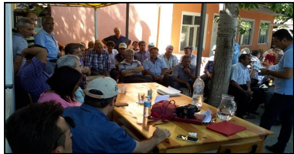
Şekil 4. Akpınar Köyü değerlendirme toplantısı.

Tablo 1'de çalışma sahasındaki köylerde yapılan değerlendirme toplantısı ve katılımcı sayısı yer almaktadır. Bu çalışma kapsamında Karanfilli havzasında yaşayan toplam nüfusun %6,06'sı ile görüşülmüştür. Böylelikle, temsil noktasında benzer çalışmalarda toplam nüfus/katılımcı oranının çok üzerinde bir orana ulaşılmıştır (Castro vd., 2016, Rodriguez-Caballero vd., 2017, Quintas-Soriano vd., 2018). Çalışmada yüz yüze görüşme yöntemi uygulandığından anket yapılmamıştır.