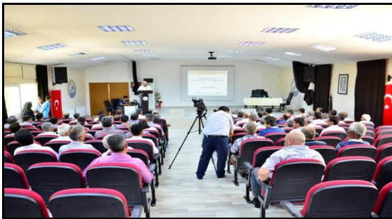
Şekil 3. Köy yöneticileri değerlendirme toplantısı.

Havza içinde yer alan köylerin sosyal ve ekonomik durumlarının ortaya konulması amacıyla nüfus miktarı ve değişimi, eğitim, göç ve ulaşım durumu, alt ve üstyapı varlığı, enerji olanakları ve kullanımı, gelir kaynakları ve dağılımı, tarım alanı miktarı, tarımsal üretim durumu, diğer üretim türleri, hayvan yetiştiriciliği ve pazarlanan ürünlerin varlığı belirlenmiştir. Bu belirlemede TÜİK, OGM ve her köyün muhtarlık verileri ve köylülerin beyanları esas alınmıştır. Bu amaçla Çameli Belediyesi Konferans salonunda 16.08.2016 tarihinde Karanfilli Havzasında yer alan köylerin muhtar ve azaları ile bir toplantı yapılmıştır (Şekil 3). Sonrasında Karanfilli havzasında yer alan köylerde ayrı ayrı toplantılar düzenlenmiştir (Şekil 4).