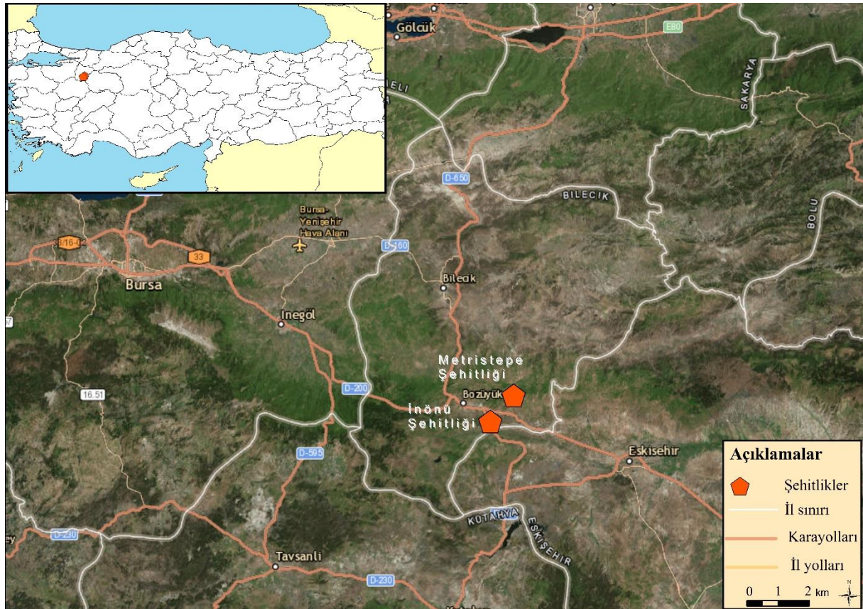
Şekil 1. Araştırma alanı lokasyon haritası

Çalışma alanı olan şehitlikler, İstiklâl Savaşı'nın Metrastepe-İnönü istikametinde gelişen ve tarihimizde İnönü Savaşları olarak bilinen savaşların geçtiği cephedir (Bilecik Valiliği, 2017a). Metrastepe ve İnönü şehitliklerinde hüzün turizmi kapsamında çeşitli çekici kaynaklar bulunmaktadır. Türk İstiklal Savaşı'nın en çetin mücadelelerinin geçtiği, dönüm noktalarından biri olan İnönü Savaşları'nın kazanıldığı ve Büyük Önder Atatürk'ün ifadesiyle " Milletin makûs talihinin yenildiği yer " olan Bozüyük Metrastepe'de 3800'den fazla askerin şehit olduğu öne sürülmektedir. Alan bu anlamda kutsal bir mekân olarak görülürken diğer yandan alanda çeşitli çekicilik kaynakları bulunmaktadır. Bunlar arasında savaşa katılan birlikler ve komutanlarıyla ilgili bilgilerin bulunduğu 24 metre yüksekliğindeki anıt en başta gelen yapay eser çekiciliklerindedir. Bu anıt Cumhuriyetin 50. Yıl dönümünde İnönü Savaşları Zafer Anıtı Yaptırma ve Yaşatma Derneği'nin iş birliği ile 26.06.1975 tarihinde dikilmiştir. Bunun yanı sıra anıtın dört bir tarafına ve anıttan ayrı İnönü Savaşları ve tarihi telgrafları içeren dört adet rölyef bulunmaktadır. Bu telgraf; Mustafa Kemal Atatürk'ün 1 Nisan gecesinde İsmet İnönü'ye çektiği, " Siz orada yalnız düşmanı değil, milletin makûs talihini yendiniz " sözünü içermektedir. Alandaki diğer çekici kaynaklar, kaide üzerinde yapılmış heykeller ve kazılmış olan siperlerdir (Bilecik Valiliği, 2017b).