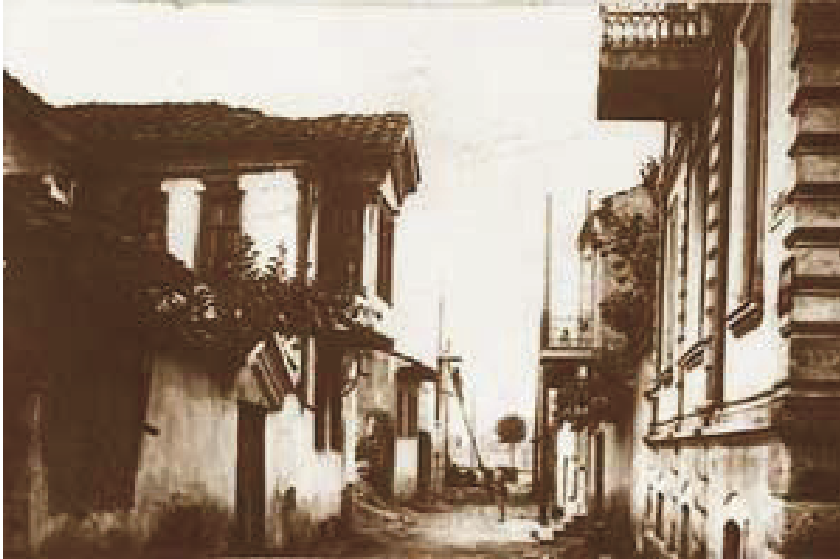
Muhacir Mahallesinden Bir Görünüm 6*

Kapsamlı arşiv vesikalarının varlığına rağmen yeni yerleşim inşaatının tam olarak ne zaman başladığı kesin olarak bilinmemektedir. Mahalle planı İsa Bey adlı kişi tarafından çizilmiştir. Bu planın daha önceki yıllarda yapıldığı kabul edilmekle birlikte, tahminen inşaat faaliyetleri 1881 yılından önce başlamamıştır. Nitekim inşaatla ilgili ilk belgeler 24 Ağustos 1881 tarihini taşımakta olup Üsküp mutasarrıfı Mehmed Kadri Paşa'nın girişimleri ile muhacirler için yapılmaya başlanan 200 hane ile ilgilidir. Zaman içinde mahalle halkının içme suyunu temin etmek için birkaç çeşme ve kuyu yapıldığı gibi ortak çamaşırhane yeri de tesis edilmiştir (Горѓиев 2011: 495-496, 498). Müslüman ahalinin dinî vecibelerini yerine getirmeleri gayesiyle devreye Üsküp mutasarrıfı Mehmed Faik Paşa girmiştir. Paşa, Vardar Nehri civarında bulunan Vardar ve Hamidiye mahalleleri ortasında yeni bir cami inşa ettirmiştir (VGMA.988/237/144). Faik Paşa camisinin (Muhacir camii) yapımına 1883 yılında başlanarak 1884 yılında bitirilmiştir (Bogoyevič 2008: 210).