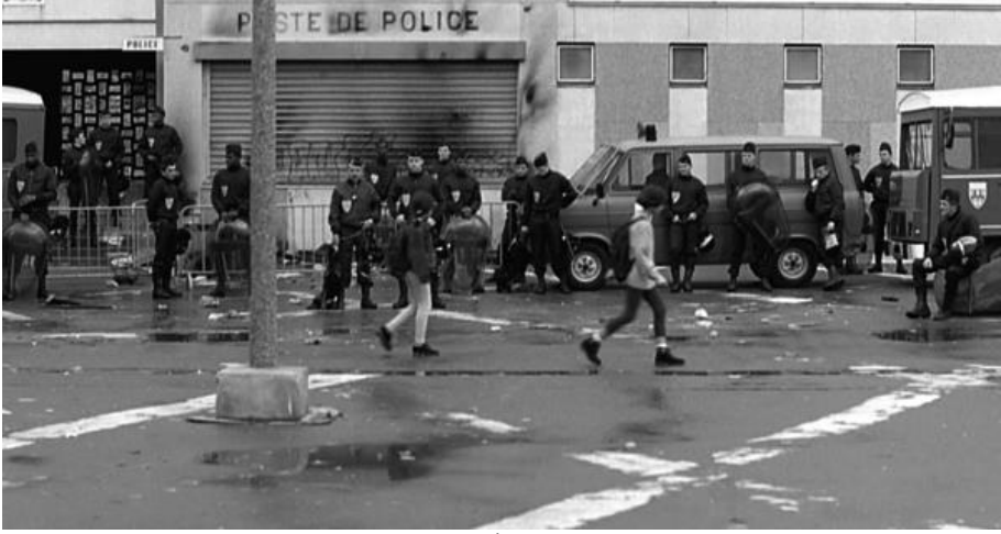
Resim 4. La Haine –İstisna olarak Banliyö

larda yaşayan gençlere yönelik sokağa çıkma yasağı ve cezaların arttırılması gibi önerilerin devlet organları tarafından medyaya çıkmış yorumları yer almakta. Belanın kaynağı olarak algılanan ve damgalanan banliyö sakinleri için bu alanlarda yaşamının zaten kısıtlı olan iş bulma durumunu ek olarak olumsuz etkilediği (Wacquant, s.265) ve bu durumun da yasadışı işlere yönelmelerine sebep olduğu anlaşılmaktadır.