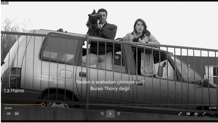
Resim 3. La Haine-basın algısı

planlı yerleşme ve 5-6 katlı dikdörtgen yapı bloklarından oluşan modern mimarlığın tipik örneği bir yerleşme alanında eğlenmek için sokakların değil kapalı alanlar ya da çatının kullanıldığı görülür. Sokaklar, çatışmaların izini taşıdığından sürekli bir tetikte olma durumunu akıllara kazır.