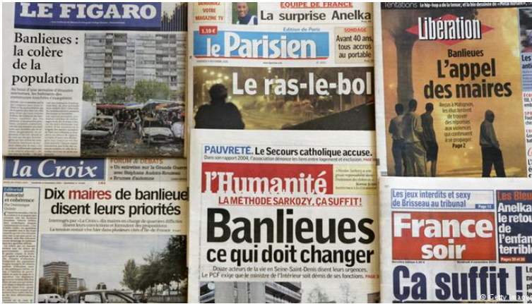
Resim 2. 2005 Fransız gazete başlıkları 3

Wacquant (2015, s.158), Kent Paryaları kitabında Cohen’e referansla “banliyölerle ilgili ahlaki bir paniğin hızla yükselişine, billurlaşmasına” ta-nıklık ettiğini ifade eder. Doksanlı yıllara kadar Fransa politika ve medya-sında dikkat çekmeyen, kent çeperlerindeki yıkık dökük toplu konut proje-leri, Kuzey Afrikalı gençlerin başını çektiği sokak protestoları ve eylemleri gündeme gelir. Banliyö konusu şehir plancılarından, siyasetçi ve medyada-kilerin ana ilgi konusu olmaya başlarken, Amerikan kökenli getto kavramı ile özdeşleştirilmeye başlanır(Wacquant, 2015) 2 . Medyanın kamu düzeni ile ulusal toplumun bütünlüğüne karşı banliyölerin gittikçe daha büyük bir tehdit oluşturduğu söylemi ile banliyölerin etnik gettolara dönüştüğü çı-ğırkanlığı yapılmaktaydı. Wacquant, 1990 sokak eylemlerinin ardından benzer içerikte birçok haberin art arda köşe yazılarında baş gösterdiğini ifade eder. 1991 yılında Fransız Hükümeti, Anti-Getto yasasını yürürlüğe koyar. Ortaya çıkan görüntülerin altında Fransa’daki kentsel eşitsizlik yat-maktadır. Medya söylemi ve politik dil ile oluşturulan panik havasında teh-dit olarak görülen şiddet değil; Avrupa banliyölerinin Amerikan tarzı get-toların yapısına kayma tehlikesi olarak görülmektedir (Wacquant, 2015, s.164). Banliyöler ile ilgili benzer yaklaşımdaki haberleri 2005 yılı olayları sonrası gazete başlıklarından da görmek mümkündür (Resim2).