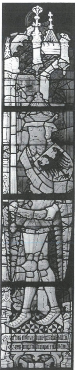
Julius Caesar, Gerichtslaube VI

burger Münzen des 17. und 18. Jahrhunderts. 5 Caesar als Gründer eines ansehnlichen Lagers der Mondstadt – spectabile castrum urbis lunae – rühmt eine Glasmalerei des 15. Jahrhunderts in der berühmten spät mittelalterlichen Gerichtslaube des Rathauses, die Caesar als einen der neun guten Helden zeigt mit einem schönen lateinischen Distichon zu seinen Füßen: