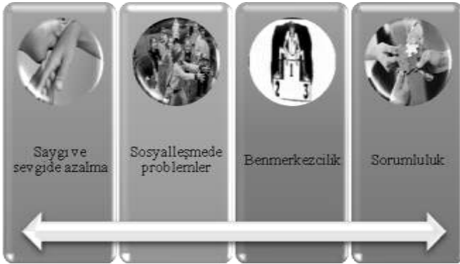
Şekil 3. Olumsuz Profil Değişimleri

Şekil 2 incelendiğinde, “Olumlu Profil Değişimleri” temasının alt temalarının; teknoloji kullanma becerileri, özgüven artışı, öğrenme kapasiteleri olduğu görülmektedir. İkinci tema olan “Olumsuz Profil Değişimleri” temasının alt temaları Şekil 3’te sunulmaktadır.