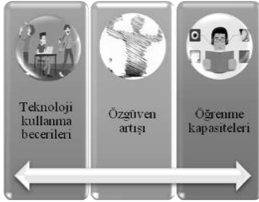
Şekil 2. Olumlu Profil Değişimleri

Şekil 1 incelendiğinde, ilkökul öğrencilerinin değişen profilleri ile ilgili olarak iki temaya ulaşıldığı görülmektedir. Bunlar, 1. Olumlu profil değişimleri. 2. Olumsuz profil değişimleridir. Birinci tema olan “Olumlu Profil Değişimleri” temasının alt temaları Şekil 2.’de sunulmaktadır.