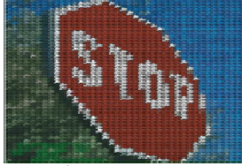
Bütün Dur İşareti