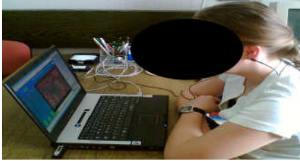
Resim 1. Sinirsel geribildirim eğitimini alan katılımcılardan biri

Deneyden önce, katılımcılar deney ve kontrol grubuna seçkisiz atanmıştır (her gruba 7 katılımcı olacak şekilde). İki grup cinsiyet, yaş ve eğitim durumu açısından birbirine denktir. Davranışsal dikkat ölçümlerinin etkilerine ilişkin hipotezi test etmek için her iki gruba da Stroop görevi uygulanmıştır. Deney grubu için, SGE oturumları özel bir odada sessiz bir ortam sağlanarak yapılmıştır. SGE oturumları sırasında oluşabilecek dikkat dağınıklığını engellemek için odanın aydınlatması ayarlanmıştır. SGE oturumları sırasında daha iyi odaklanabilmeleri için katılımcılar odada yalnız bırakılmıştır (Resim 1).