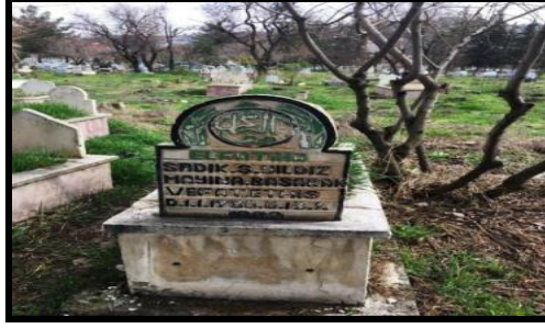
Foto 4: Kabir taşına “mayına basarak vefat etmiştir” yazmaktadır.

Mayına basarak vefat etmek gibi bir ölüm şekli mekânın ortaya çıkardığı ve orada organize olan iktidarın mekânsal bir ölüm biçimidir.