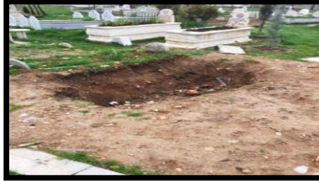
Foto 6: Kimsesiz diye gömülen ve sonrasında kimselerin ortaya çıkmasıyla dört kez kazılıp sahibine teslim edilen kabir.

çoğunlukla yasaklanıp bazen de kısmı olarak izin verilse de kimsesizlerin kimseleri iktidar şemsiyesi altında ölüm ve ilgili törenleri ifa etmektedir.