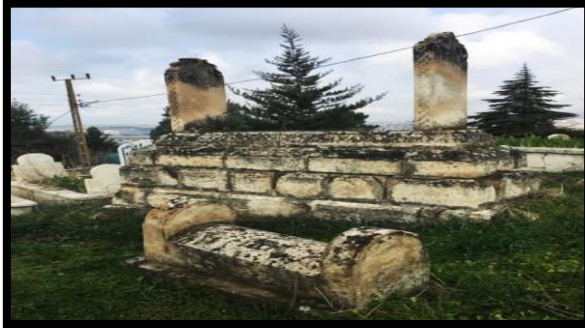
Foto 5: Çocuk/bebek kabrindeki tarih 1951, yetişkin kabrinde ise 1939 yazmaktadır.

ölümde eşitliği sona erdirmiştir. Ölümü uzak tutmak için maddi olarak her türlü bedeli ödeyebileceklerin devri başladığından beri ölümün eşit olduğuna ilişkin söylemler hala görülmekle birlikte gerçekte bunun bir karşılığı yoktur. Bu tür göstergeler gündelik hayatta toplum tarafından rahatlıkla okunduğu durumların yanı sıra ki öyle anlaşılıyor ki okunabiliyor, kendiliğinden gelişen durumlarla da karşılaşılabilir. Statüsü ve sınıfı el vermediği için kişiler tüm maddi olanaklarını ve durumlarını zorlayarak Ahlat'tan mezar taşı ve ustası getirtebilir. Ölen kişi bir anne, baba veya ata ise bir aile birleşerek heybetli bir mezar yapabilir ve mezarlıklardan yaptığımız sınıf ve statü okumalarına bu durum meydan okuyabilir. Kamusal alandaki bu hiyerarşi karşısında ekonomik ve sosyal durumu el vermemesine rağmen bu oluşturulan hiyerarşiye ayak uydurmak için bu kişiler imkânlarını zorlayabilir. Kabirleri bakımsız ve düzensiz olan kişilerin yakınları toplumsal olarak kınanarak bu maddi zorlamaya itilebilmektedir.