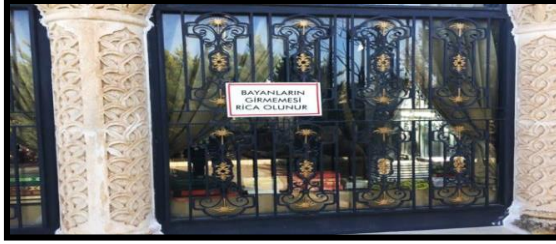
Foto 7: Kadınların girmesinin yasak olduğu türbe (Şeyh Süleyman Mezarlığı).

evin çocuğu olmayı bile gerektirmiyor. Ataerkil olan bu toplum erkek çocuğu önelediği için ve kız çocukları evlenerek evden ayrıldıklarından kaç çocuğun var sorusuna karşılık olarak sadece erkekler sayılmaktadır. Bunun bu toplumda tamamıyla böyle olduğunu varsaymak doğru değil, yaygın ise bile buna dair belli bir veri üzerinden konuşmak gerekmektedir. Bu ataerkil sistemin kodlarını yüklenen ve bunu üreten, geleceğe aktaran erkeklerle beraber çoğunlukla kadındır. Bunu kadına/erkeğe bu şekilde yaptıran toplumsal cinsiyet rejimidir. Kadın erkekten (koca, dede, ata) daha fazla erkek çocuk isteyerek, kocadan daha fazla kız çocuklarına mirastan pay vermemeyi savunarak ve erkek çocuğu olmadığı için bir kadını erkekten daha fazla dışlayarak kendi konumunu her şeye rağmen sağlama alma olarak ataerkil pazarlık ve taktiğe başvurmaktadır.