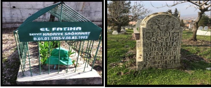
Foto 2-3: Yeşil bez ile seyitliğin ifade edilişi (solda) ve kişinin genç yaşta ölmesine ilişkin mezar taşı yazısı (sağda) (15'inde göçtüm babama müjdeleyin, yerim oldu cennetin kâşanesi (köşk)).

Ölüm şekli olarak “şehitlik” hem yaşama (aile fertleri açısından) hem de “öteki taraf” için bir statüdür. Şehit kabirleri mekânsal olarak yüksekte bulunma üzerinden bir hiyerarşi yaratmaz fakat anlamsal ve kendi özel mekânında organizasyon olarak farklılık göstermektedir. Bu farklılık onların bayraklarla bezeli olması, diğerleriyle nispeten daha bakımlı ve heybetli olmasıdır. Bu durum onların diğer mezarlıklarda da olan özel mekân olmasının yanında şehitlik üzerinden hem kamusal hem özel yönlerinin olmasıyla ilgilidir. Şeyh Musa mezarlığında diğerlerinden farklı olarak iki ülkenin de bayraklarının (Türkiye – Filistin) simgesel olarak bulunduğu “Mavi Marmara” 20 olaylarındaki sivil şehit vardır. Bununla birlikte korucu, polis, asker, trafik kazası, yangın, boğulma vb. durumlar üzerinden şehitlikler kendi aralarında da sınıflandırılmıştır. Nitekim bu sınıflandırmanın dinsel temelleri vardır. 21 Bir kişinin korucu 22 olarak şehit olması ile polis olarak şehit olması arasında teorik olarak bir fark yoktur fakat bazı durumlarda adlandırmalar mekânsaldır (korucu gibi). Ayrıca ölüm şeklinin mekânsal olduğu durumlar da söz konusudur (Foto 4).