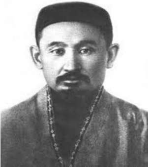
Ek-1: Ömer Karaş (1875–1921 yy.)