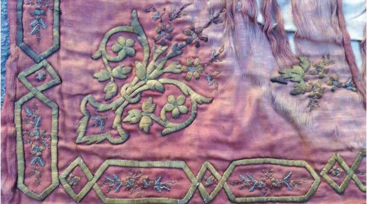
Fotoğraf 9: Kenar suyu düzenlemesi ve köşede bir buket çiçek, Afyonkarahisar Mevlevihâne Müzesi (Ü. Küçükkurt, 2019).

Sandukaların ön yüzünü yada üstünü örtmek amacıyla kullanılan bohçaların kompozisyonu genellikle orta merkez, köşe motifleri ve kenar suyu düzenlemesine sahiptir. Merkeze daire, oval yerleştirilen motiflerin ara boşluklarını kopma çiçekler doldurmaktadır. Bohçaların kenar suyunu geometrik ve bitkisel motifler oluşturmaktadır (Fotoğraf 9).