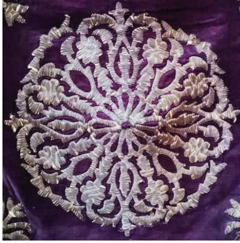
Fotoğraf 5: İlyas Şah sandukasının ön yüzüne asılmış dival işi bohçadan detay, Afyonkarahisar Mevlevihânesi'nin türbe bölümü (Ü. Küçük Kurt, 2019).