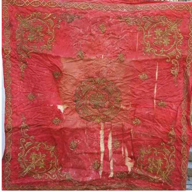
Fotoğraf 17: Bohça, Afyonkarahisar Mevlevîhâne Müzesi.

Fotoğraf 17'de bulunan ve müzede sergilenen bohçanın boyutu 115 cm X 115 cm'dir. Kırmızı atlas kumaşın üzerine sarı sim ile dival işi tekniği uygulanmış, sarı metal pul süslemede kullanılmıştır. Bohçanın mermerşahi kumaşından iki kat astarı bulunmaktadır. Orta ve dış astarı beyazdır. Bohçanın kenar suyu oval ve üçgenlerin birleşimiyle oluşmuştur. Bohçanın köşelerine vazodan çıkan yıldız çiçekleri ve rumiler yerleştirilmiştir. Ortada rumilerin çevrelediği bir dal, yıldız çiçeği motifi yer almaktadır.