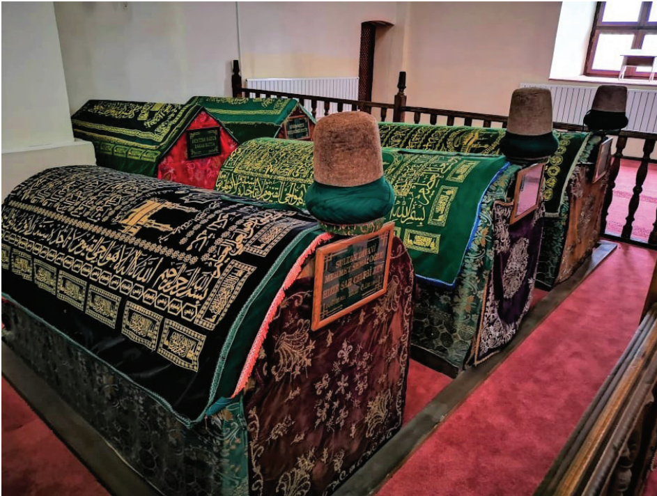
Fotoğraf 2: Karahisâr-ı Sâhip Sultan Dîvânî Mevlevîhânesi'nin türbe kısmında bohçalar, Afyonkarahisar.