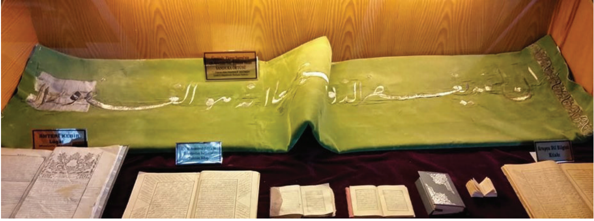
Fotoğraf 11: R. 1265 (M.1849) tarihli püşide, Afyonkarahisar Mevlevihâne Müzesi (Ü. Küçükurt, 2019).