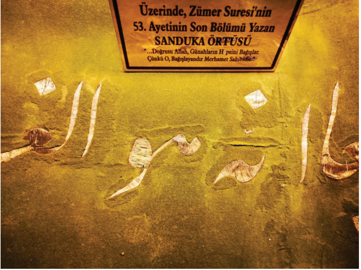
Fotoğraf 4: Sultan Dîvânî'nin 1849 tarihli pûşidesinde sim ile işlenmiş hat yazısı, Afyonkarahisar Mevlevihâne Müzesi (Ü. Küçük Kurt, 2019).

Dival işi; desenin altı çiriş otunun köklerinin kurutulup toz haline getirilmesiyle elde edilen yapıştırıcı sürülmüş karton ile kabartılmakta, möhlüğe denilen özel bıçak ile karton desene göre oyularak hazırlanmaktadır. Bu karton işlenecek kumaşa yapıştırılarak gerilmekte ve kumaş, cülde adı verilen özel tezgahta sıkıştırılmaktadır. Kumaşın üstünde çok katlı sim yada sırma, altta ise başka yürüyen iplik karşılıklı tutturularak işleme gerçekleştirilmektedir. 16 Alttan yürüyen ipliğin çabuk kopmaması için üzerine balmumu sürülerek kuvvetlendirilmektedir. 17 Dival işinin düzgün görünmesi için motifin içinde kalan malzemenin kabarık kalacak şekilde düzenli ve sıkı sarılması gerekmektedir. 18