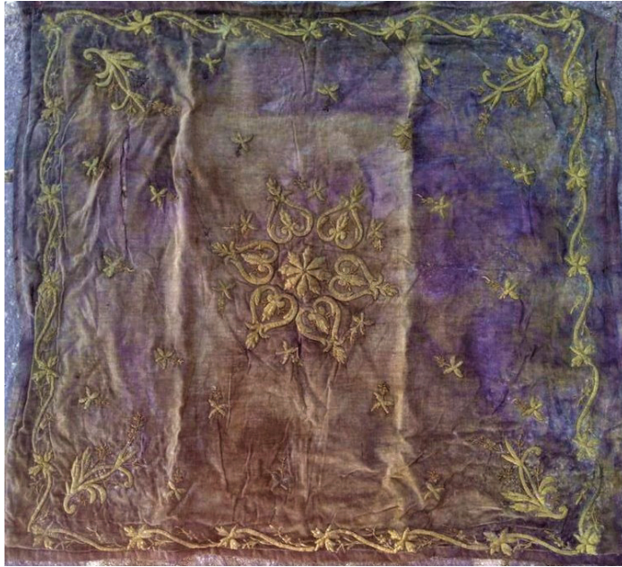
Fotoğraf 18: Bohça, Afyonkarahisar Mevlevîhâne Müzesi (Ü. Küçük Kurt, 2019).

Fotoğraf 17'de bulunan ve müzede sergilenen bohçanın boyutu 115 cm X 115 cm'dir. Kırmızı atlas kumaşın üzerine sarı sim ile dival işi tekniği uygulanmış, sarı metal pul süslemede kullanılmıştır. Bohçanın mermerşahi kumaşından iki kat astarı bulunmaktadır. Orta ve dış astarı beyazdır. Bohçanın kenar suyu oval ve üçgenlerin birleşimiyle oluşmuştur. Bohçanın köşelerine vazodan çıkan yıldız çiçekleri ve rumiler yerleştirilmiştir. Ortada rumilerin çevrelediği bir dal, yıldız çiçeği motifi yer almaktadır.