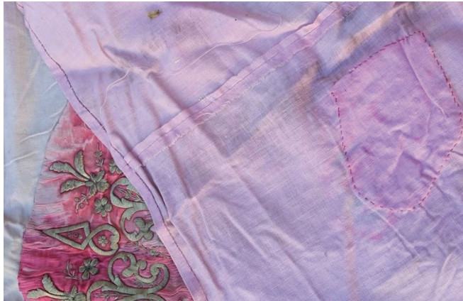
Fotoğraf 7: Dival işlemeli kumaş parçasının pamuklu kumaş üzerine tutturulduğu bohçanın arkası. Afyonkarahisar Mevlevihâne Müzesi.