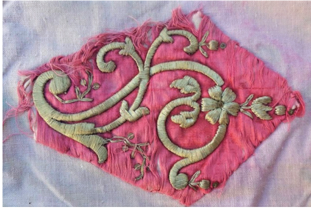
Fotoğraf 6: Dival işlemeli kumaş parçasının pamuklu kumaş üzerine tutturulduğu bohçanın yüzü. Dival işlemeli kumaş parçası (zemin kumaşı yıpranmış), pamuklu kumaşa el dikişiyile tutturulmuştur. Afyonkarahisar Mevlevihâne Müzesi (Ü. Küçük Kurt, 2019).