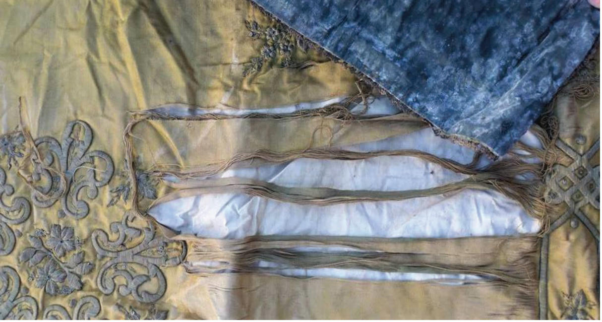
Fotoğraf 3: Atlas kumaş üstüne işleme yapılmıştır. Pamuklu beyaz kumaş orta astar, mavi pamuklu kumaş dış astardır, Afyonkarahisar Mevlevîhâne Müzesi.

Puşide levhalarında ve puşidelerin ön yüzünde kadife, astarında pamuk ve keten kumaş kullanılmıştır. Bohçaların işleme yapılan ön yüzünde atlas, kadife, orta ve dışta bulunan astarlarda pamuk, keten kumaş tercih edilmiştir (Fotoğraf 3).