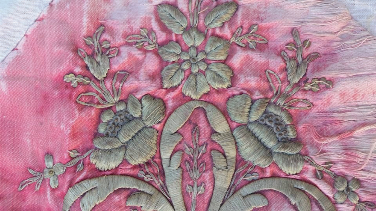
Fotoğraf 8: Gül motifi, Afyonkarahisar Mevlevîhâne Müzesi (Ü. Küçük Kurt, 2019).

Dival işi, gerçekçi bir üslûpla doğanın işlemlere motif olarak aktarılmasına olanak tanımaktadır. Bu nedenle bitkisel motifler zengin çeşitliliğe sahiptir. 21 Örtülerde kullanılan motifler arasında gül, lale, küpe çiçeği, mine çiçeği, yıldız, asma dalı, yaprağı ve sarmaşığı gibi bitkisel bezemeler yer almaktadır (Fotoğraf 8). Bu bitkiler tek, demet halinde, yada vazoda, saksıda gösterilmiştir. Palmet ve rumiler de kullanılmıştır. Nesneli bezemeler arasında püskül, fiyonk haline getirilmiş kurdele, vazo, saksı, geometrik motifler ve geçmeler kullanılmıştır.