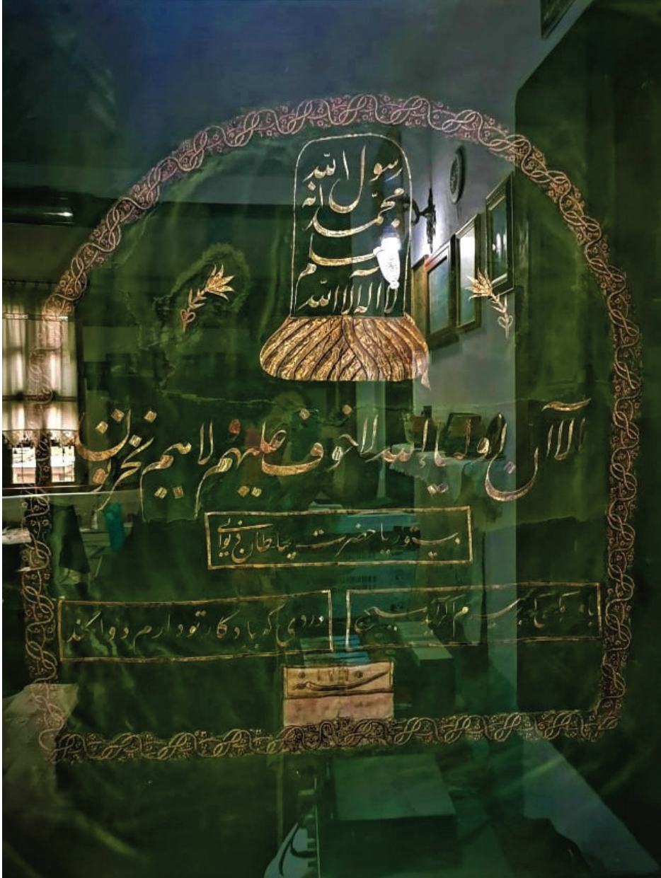
Fotoğraf 10: R. 1265 (M.1849) tarihli pûşîde levhası, Afyonkarahisar Mevlevihâne Müzesi (Ü. Küçükkurt, 2019).

kullanılmış ve örtü onarım görmüştür. Levhanın kompozisyon düzenlemesinde mevlevîliğin sembolü olan sikke içinde: “Lâ ilâhe illallah Fe a’lemü Muhammedün İnehû Rasûlullâh”, “Bil ki Allah birdir, Muhammed onun elçisidir”, altında Yunus Suresi’nin 62. Ayeti “Elâ inne evliyâ Allâhu Lâ havfün’aleyhim velâhüm yahzenûn “Haberiniz olsun Allah’ın velîleri, onlar için korku yoktur, mahzun da olmayacaklardır” ve “Düstûr yâ Hazret-i Sultan Dûvânî”, tarih R. 1265 (M. 1849) yazmaktadır. 24 Yan örtüde Zümer Suresi’nin 53. Ayeti “İnnallahe yağfir’uz- zunûbe cemîan innehû hüve-el ğâfûr-ur rahîm”, “Doğrusu Allah günahların hepsini bağışlar, çünkü o, bağışlayandır, merhamet sahibidir” işlenmiştir.