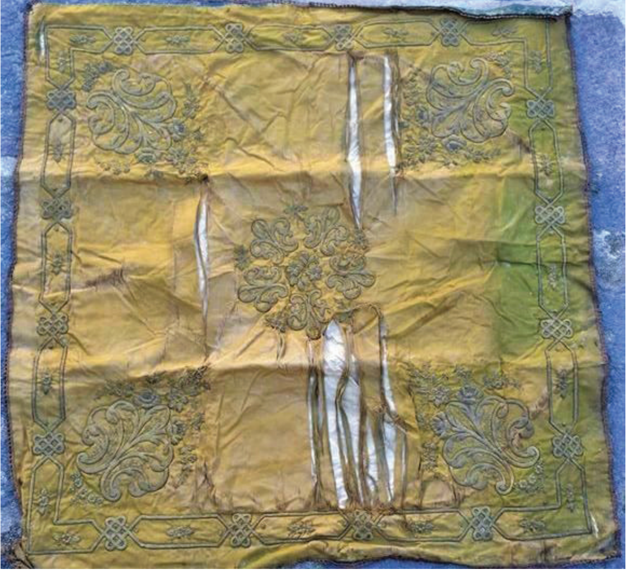
Fotoğraf 15: Bohça, Afyonkarahisar Mevlevîhâne Müzesi (Ü. Küçük Kurt, 2019).

Fotoğraf 14'de bulunan örnek, caminin türbe kısmında İlyas Şah sandukasının önüne asılı bohçadır. Bohçanın boyutu 90 cm X 110 cm'dir. Mor kadife kumaşın üzerine gümüş rengi sim ile dival işi tekniği uygulanmıştır. Bohçanın mermerşahi kumaşından tek kat astarı bulunmaktadır. Köşelere yerleştirilen lale ve yaprak motifleri merkeze doğru yükselmektedir. Köşe motifinin yanlara doğru açılmasıyla kenar suyu oluşturulmuştur. Merkez, dal ve yaprakların arasına çiçek motifi yerleştirilerek düzenlenmiştir. Kadife kumaşa solmalar ve hav dökülmeleri mevcuttur.