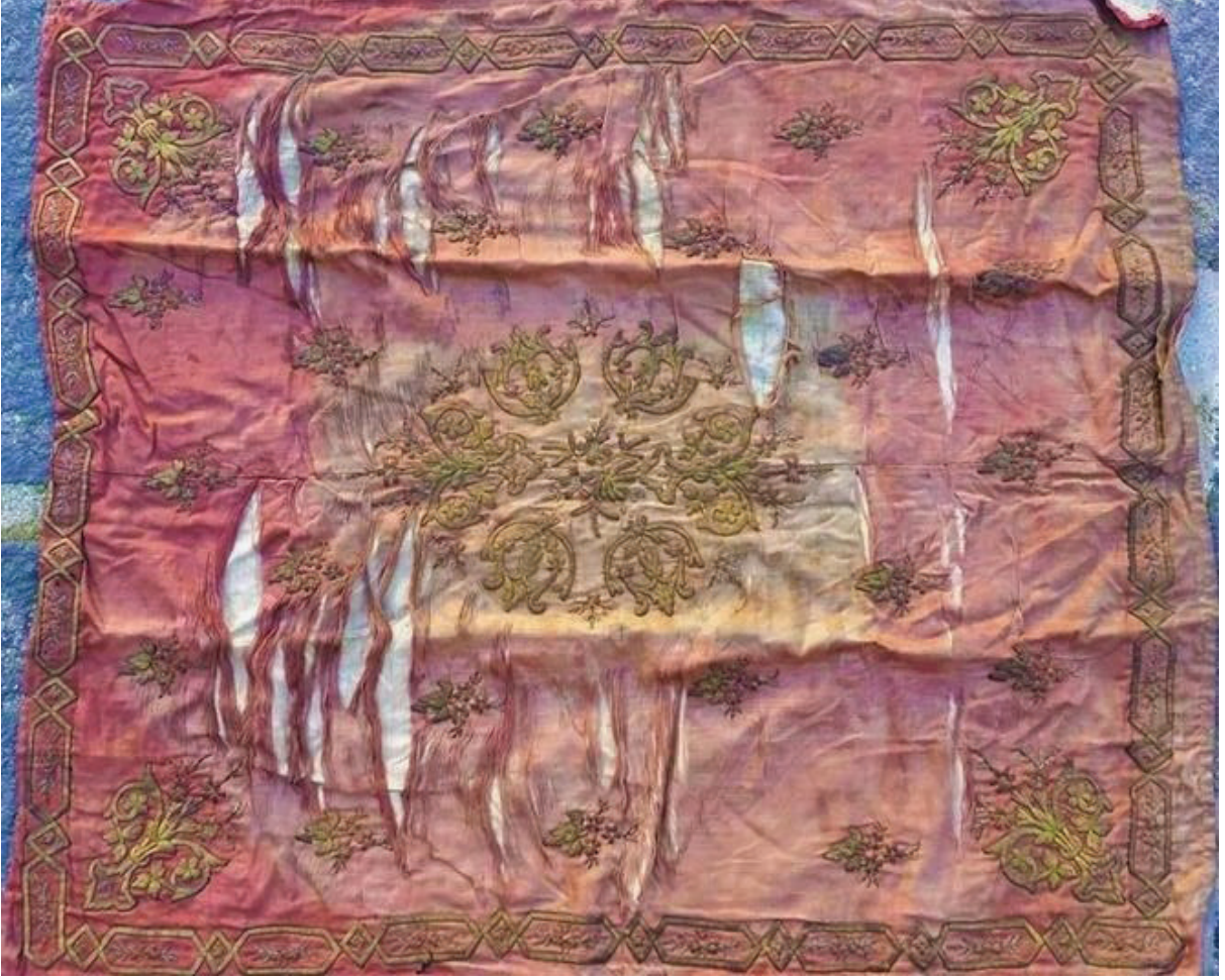
Fotoğraf 16: Bohça, Afyonkarahisar Mevlevihâne Müzesi.

kıvrımlı dallar bulunmaktadır. Bohçanın atlas kumaşının yeşil rengi solarak sarıya dönmüştür. Kumaşta sökülmeler mevcuttur.