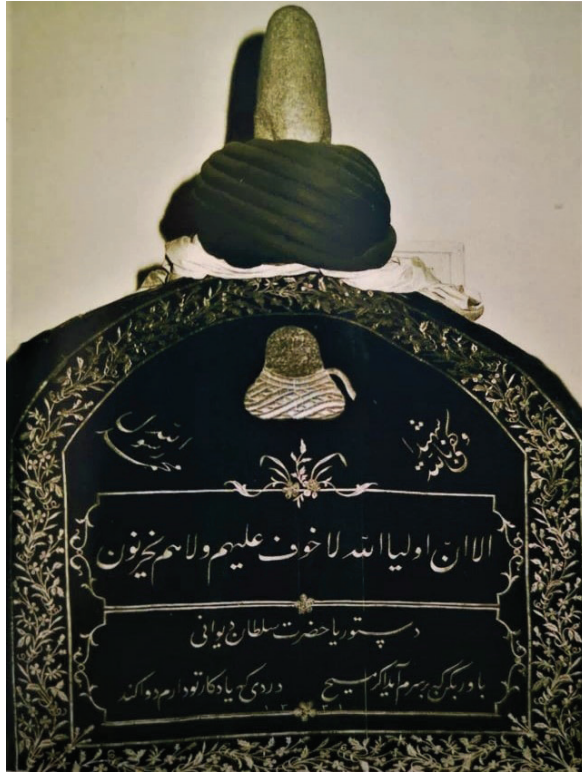
Fotoğraf 13: Sultan Dîvânî sandukasında M. 1912 tarihli pûşide levhası, Afyonkarahisar Mevlevîhânesi’nin türbe bölümü (Y. İlgar, 2004).

Levhanın kompozisyonunda destarlı sikke motifi ortada ve tepede işlenmiştir. Sikkenin sağ ve solunda çiçek demeti, yaprak ve sarmaşıkların oluşturduğu kenar suyu düzenlemeyi tamamlamıştır. Pûşidenin yan yüzünde aynı kenar suyu devam etmiş, orta zemin boş bırakılmıştır.