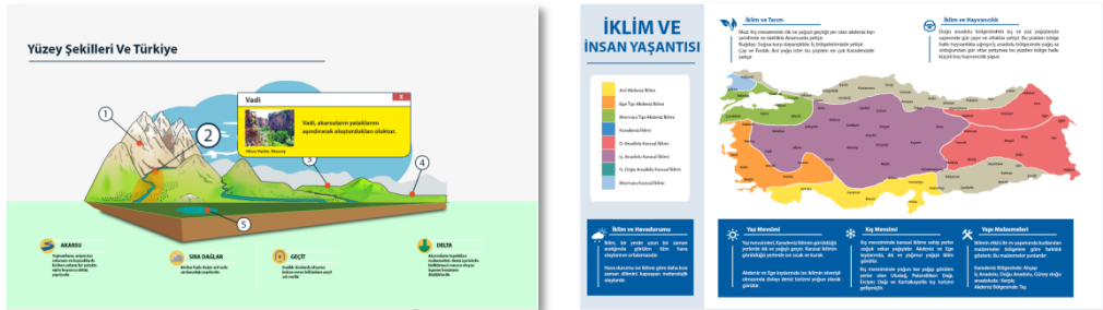
Resim 3-4 “Yeryüzü Şekilleri” ve “Türkiye ve İklim ve İnsan Yaşantısı” İnteraktif İnfografığı.

Üçüncü interaktif infografik “Yüzey Şekilleri” ve “Türkiye” konu başlığına yönelik olarak hazırlanmıştır. Bu interaktif infografikte öğrenci, grafik üzerinde yer alan rakamlara tıklayarak dağ, vadi, plato, ova, göl gibi kavramları öğrenebilir ve infografik diğer bölgelerinde konumlandırılmış konu ile ilgili bilgilerle doğrudan erişebilmektedir (Resim 3). Dördüncü infografik olan, “İklim Ve İnsan Yaşantısı” interaktif infografikinde ise öğrenci, Türkiye’de görülen iklimin insan faaliyetlerini ve bu faaliyetlerin günlük yaşantıya olan etkilerini içeriği takip ederek ulaşabilmekte ve grafiğin sol tarafından yer alan renk paletindeki butonlara tıklayarak ilgili iklim tipinin hangi bölgede etkili olduğunu gözlemleyebilmektedir (Resim 4).