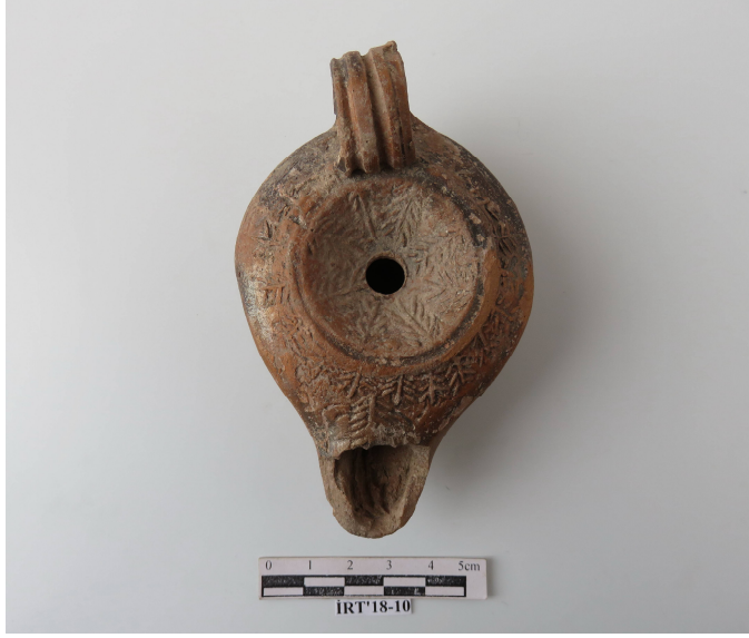
Şekil 11. MS 5-7. Yüzyıllara Tarihlenen Yerli Kandil. (İznik Kazı Projesi)