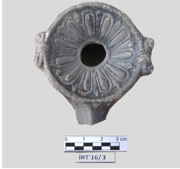
Şekil 7. Pergamon kalp yapraklı kandil (İzник Kazı Projesi)