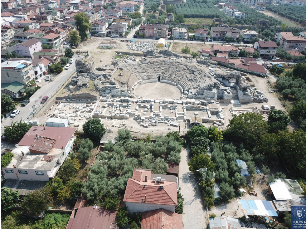
Şekil 3. Tiyatro Görünümü (İzник Kazı Projesi)

Tiyatro yapı oturma alanı olarak 102 x 79 m boyutlarında bir alanı kaplamaktadır ve düz bir alana tonozlu bir alt yapıyla inşa edilmiştir ( Şekil 3 ). Oturma basamakları (cavea) alt, orta ve üst olmak üzere üç sıra halindedir. En üst sırada oturan bir seyirci 20 metre yükseklikten orkestrada oynanan oyunlarını izlemiştir. Dönemin modası olan gladyatör mücadeleleri-dövüşlerinin oynandığı tiyatroda, bunu belgeleyen bir kılıç-kalkan kabartması da vardır ( Şekil 4 ). Yapının sahne binası, üç adet giriş kapısı ve koridorla birbirinden ayrılan dört ana mekândan oluşmaktadır. Eldeki verilerle iki katlı olduğu düşünülen binanın süslemesinde mitolojik ve bitkisel motifler kullanılmıştır. Yapının gövdesi moloz taş ve harç kullanılarak inşa edilmiş, daha sonra kireçtaşı bloklarla bitirilmiştir. Sahne binasında ve bazı alanlarda mermer kaplamalar kullanılmıştır. Tiyatronun seyirci kapasitesi yaklaşık 10 bin kişidir. Yapımında 10 milyon sesterces harcanmıştır (Plinii, 39, 3.; Pliny, 1969, 39). Yaşlı Plinius'a göre 5 sesterces, 1 mobius (8,47 lt) buğdaya eşit olduğu için toplam harcanan miktar yaklaşık 17.000 ton buğdayın parasına eşittir (Pliny, Nat. His. 18.10).