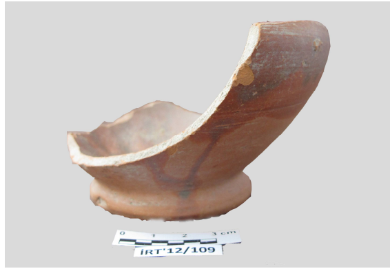
Şekil 6. Batı Yamacı Teknikte Bezenmiş Amphora Ağız (İzник Kazı Projesi)