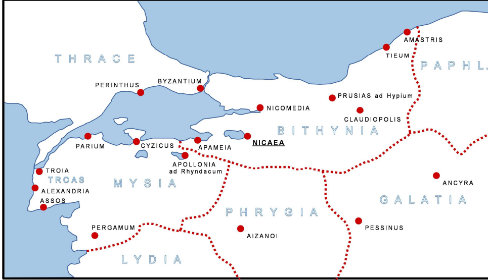
Şekil 2. Bithynia Bölgesi (İznik Kazı Projesi)

Tiyatro ve çevresinde yapılan kazılar sonucu ele geçen en erken buluntu MÖ 6. yüzyıla kadar inmektedir. İznik'in 24 asırlık tarihi, Tiyatro ve çevresindeki buluntularla okunabilmekte ve İznik'in tarihçesi binlerce yıllık bir höyük yerleşimi gibi tek bir alanda karşımıza çıkmaktadır.