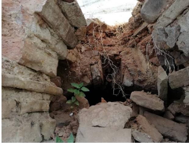
Şekil 14. Osmanlı Seramik Fırını (İznik Kazı Projesi)

İznik’de çini sanatı ilk olarak 15. yüzyılda ortaya çıkmıştır. İznik çinilerinin ilk örneklerine Bursa Yeşil Camii ve Türbesinde (1421), Bursa Muradiye Camii’nde (1426) rastlanır. İznik, Osmanlı Devleti’nin mimari eserleri ile dünyaya nam saldığı ve güçlendiği 16. yüzyılda çiniciliği ile ayrı bir yer edinmiştir. İznik çinileri, renk, kompozisyon, motif, teknik ve kalite yönünden tüm dünyanın beğenisini kazanmıştır. Tiyatro’da caveayı taşıyan tonozların içinde üç dikdörtgen planlı, bir yuvarlak planlı olmak üzere dört adet Osmanlı seramik fırını ve atölye olduğu düşünülen bölümler açığa çıkarılmıştır ( Şekil 14 ). Alanda Bizans Döneminde başlayan bu seramik üretiminin Osmanlı Döneminde de devam ettiği görülmektedir. Bu alanlarda çok sayıda Osmanlı Dönemi seramik ve çini örnekleri bulunmuştur. Tiyatro ve çevresinde çok sayıda 15. yüzyıla tarihlenen kırmızı hamurlu ve 16.-17. yüzyıllara tarihlenen beyaz hamurlu Osmanlı seramikleri ele geçmektedir. Buluntular içinde Milet işi, Şam işi, Rodos işi, Haliç işi gibi dönemin ünlü tiplerinden de bulunmaktadır (Demirci, 2000: 20-25). Şekil 15 ’de görülen örnek; MS 15. yüzyıla tarihlenen kırmızı hamurlu, beyaz astar üzerine renksiz sırlı, mavi boyalı, bitkisel bezemeli bir kâsedir.