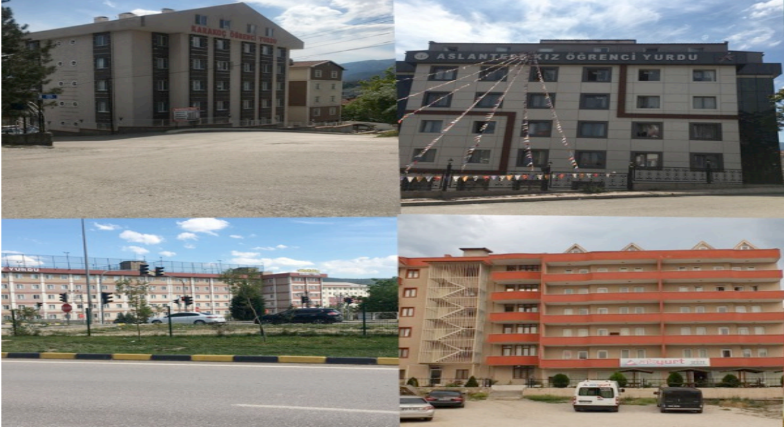
Fotoğraf 1: 100. Yıl Mahallesiindeki Bazı Yükseköğrenim Yurtları (2019)