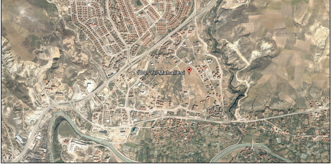
Şekil 1: 2006 Yılı (Üniversitenin Kuruluşundan Önce) İtibarı İle 100. Yıl Mahallesi Google Hava Fotoğrafi

100. Yıl Mahallesinin üniversite kurulmadan öncesi ve üniversitenin kurulması sonrasındaki değişimi hava fotoğraflarından anlaşılmaktadır (Şekil 1. ve 2).