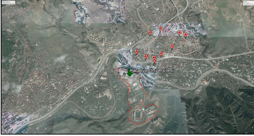
Şekil 3: 100. Yıl Mahallesindeki Yurtların Hava Fotoğrafından Görünümü