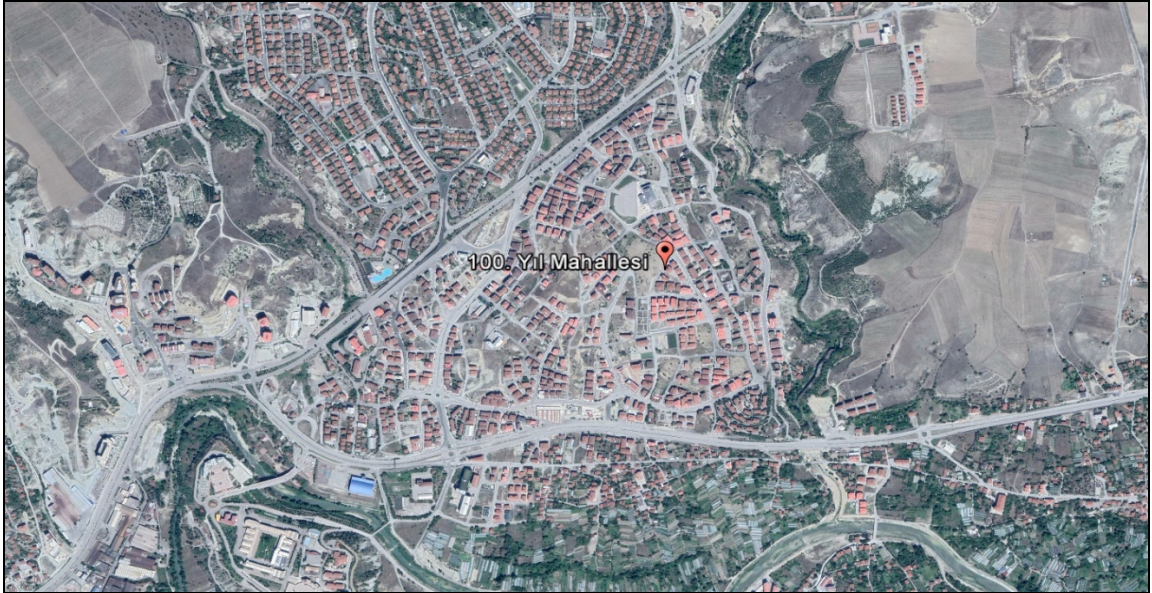
Şekil 2: 2019 Ocak Ayı 100. Yıl Mahallesi Google Hava Fotoğrafi