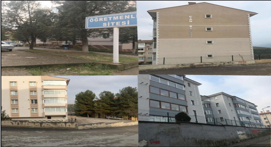
Fotoğraf 4: 100. Yıl Mahallesi'nde İnşa Edilen İlk Siteler (Öğretmenler, Çan, Belediye ve Mevlana Siteleri)

Tarihsel bağlamda 100. Yıl Mahallesi'nin kuruluşu incelendiğinde, bu ortaya çıkışın 1972'ye uzandığı görülmektedir. Bu dönemde Süleyman Demirel hükümetindedir. Belirtilen dönemde Yeşil Mahalle civarında heyelan riskine bağlı olarak 28 adet konut istimlak edilmiştir. Buna istinaden 28 adet konutun bölgede yapımı ile 100. Yıl Mahallesi kurulmuştur. Söz konusu mahalle Karabük'ün ilk yeni yerleşim olarak, dış kısmında, kurulan ilk mahallesidir. 1985-1986 yılından itibaren mahallede diğer konutların yapılmasına başlanmıştır (Belediye Sitesi, Öğretmenler Sitesi, Çan Sitesi, Mevlâna Sitesi) (Fotoğraf 4). Ancak bunun öncesinde bölgede bazı konutlar mevcuttur. Ayrıca bu dönemde mahallenin bazı bölgelerinde suya ve elektriğe erişim problemi de mevcuttur. Bu süreç her ne kadar üniversitenin kurulmasından önce yaşansa da bu dönemlerde 100. Yıl Mahallesi'nin sosyal anlamda oldukça geri olduğu görülmektedir.