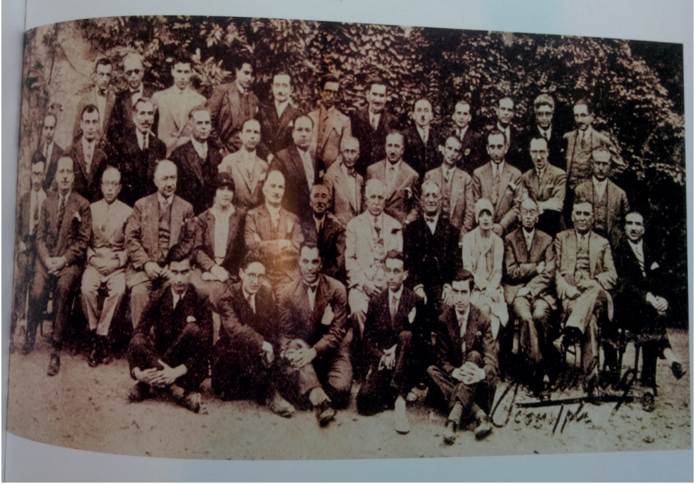
Ek-3: 1918 Yılı Temmuz Ayında Bir Araya Gelen Güzel Sanatlar Birliği Edebiyat Şubesinin Üyelerinin Toplu Fotoğrafi. Ali Haydar Emir, en arkada soldan ikinci sırada. Ali Haydar Emir'in sağında Necip Fazıl, solunda ise Necmettin Halil (Onan) bulunuyor. Fotoğrafta yer alan diğer üyelerin isimleri için bkz. Bir Fotoğrafın Aynasında İstanbul'un Meşhur Edebiyatçıları , Hazırlayan: Yusuf Çağlar, İstanbul, İstanbul Büyükşehir Belediyesi Kültür A.Ş. Yayınları, 2009, s. 17, 26, 143.