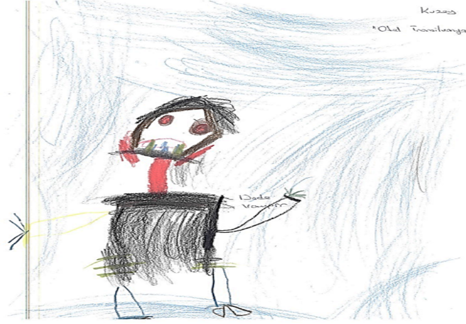
Şekil 1. Çocuk animasyon filmlerinin izlenmesinin ardından akıllarında en çok kalan vampir temalı çocuk resmi