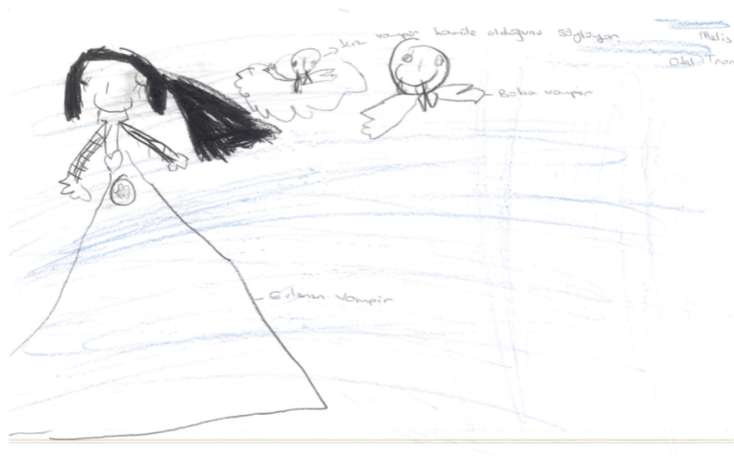
Şekil 2. Çocuk animasyon filmlerinin izlenmesinin ardından akıllarında en çok kalan vampir temalı bebek resmi