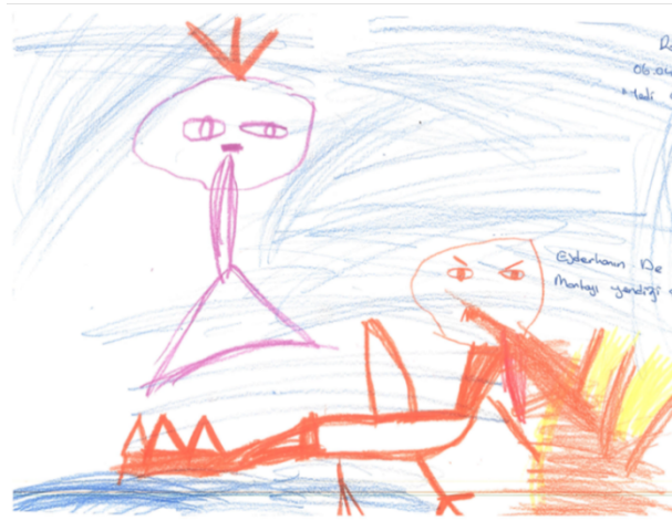
Şekil 3. Çocuk animasyon filmlerinin izlenmesinin ardından akıllarında en çok kalan şiddet içerikli çocuk resmi