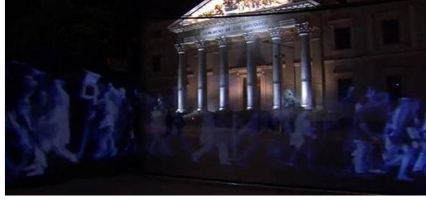
Şekil 1: Özgürlük için Hologram hareketi