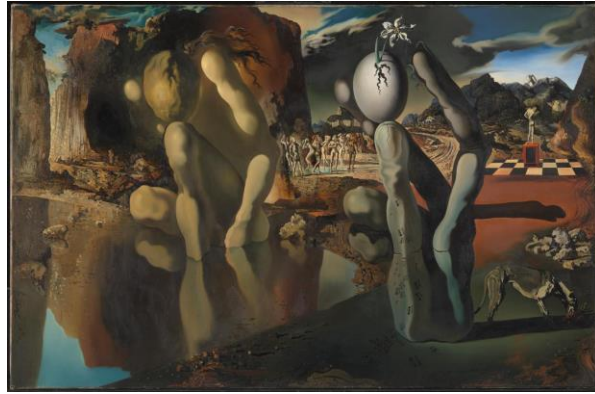
GörSEL 9. Salvador Dali, Narkissos'un Dönüşümü , T.Ü.Y.B., 51,2 cm × 78,1 cm., 1937, Tate Modern Sanatlar Müzesi, Londra.

Sembolistler tarafından popüler, Sürrealistler tarafından teorik hale getirilen mit, güzel bir rüyanın hayati içgüdülerle bütünleşmesi olarak sanata yansır. Breton'un "algı ve temsil ikiliğini çözen gerçeküstü olma durumu" dediği şey de budur. Bu bir aynadır (Mallen, 2015:6). Sanatçı, kendi yaratmasıyla özdeşleştirdiği iç gerçekliği yakalar, birleştirir ve yansıtır. Kısacası kendindeki özü, özdeki kendini keşfeder. Claude Levi-Strauss ise modern dönem sanatında mit karakterin iki zıt tarafını ele alır. Bu anlamda sanatçıların mit ile ilgili ortaya koydukları en