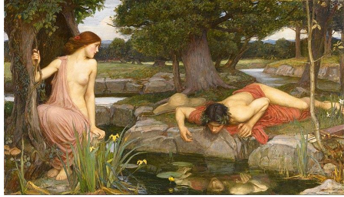
Görsel 7. John William Waterhouse, Ekho ve Narkissos , 1903. 109.2 cm x 189.2 cm., Walker Art Gallery, Liverpool.