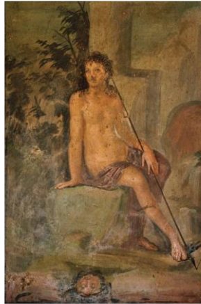
Görsel 1. Narkissos, Octavius Quartio Evi, Pompei Duvar Resmi.

Narkissos ile ilgili olarak Pompei'de bulunan duvar resimleri ilk örnekler olarak kabul edilir (Görsel 1-2) ve şiirin yazılmasından yaklaşık yarım asır önceye tarihlendirilirler (Valladeres, 2011:378). Bu resimlerin Ovidius'un şiirinden etkilenerek yapılmadıkları, mitin Yunan mitolojisinden gelen bir anlatıma dayalı olarak yerel sanatçılar tarafından yapılmış olduğu fikrini uyandırmaktadır. Valladeres'in (2011:391) makalesinde belirttiğine göre Ovidius'un şiiri yazmadan önce yapılmış olan bu duvar resimleri, bir ön hazırlık devresi olarak sadece görsel bir temsil değil duygu yüklü bir sürecin ürünü olarak ele alınması gerekir. Ancak Pompei'deki Quartio Evi'ndeki resimlerde (Görsel 1) Ovidius'un Metamorphoses şiirinde geçen mit ile yakından ilişkilidir, Fronto Evi'nde bulunan resimler (Görsel 2) Ovidius'un şiirinden önce yapılmış olmalarına rağmen şaşırtıcı bir temsil zenginliği sunduğu söylenebilir. Her iki evde bulunan resimler öyküyü en iyi şekilde temsil etmek için farklı mitler ile birleştirerek tasvir edilmişlerdir.