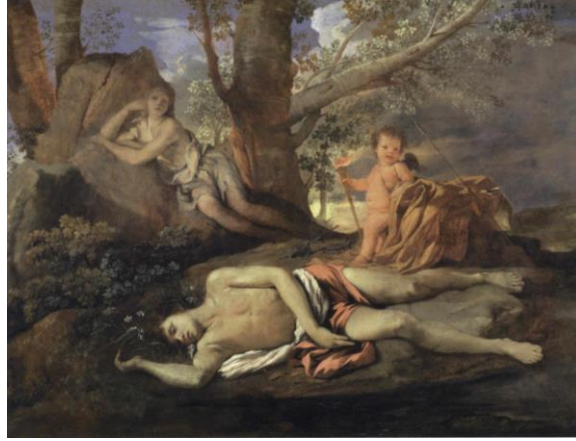
Görsel 5. Nicolas Poussin, Eko ve Narkissos , 1630, TÜYB. 100X74 cm. Louvre Müzesi, Paris.

Poussin'in ilk mitolojik tablolarından birisi olan Eko ve Nakissos'ta (Görsel 5), Narkissos, kadını bir şekilde betimlenmiş ve nergise dönüşümünü tasvir etmektedir. Arka planda Narkissos'un reddettiği sevgilisi Ekho sese dönüşerek kayaların arasında kaybolurken betimlenmiştir. Sanatçı Ekho'yu sahneye ruhsal olarak dahil ederek, Ovidius'un anlattığı mitin kronolojisini altüst ederek izleyicinin bu iki karakterin davranışlarını ve kaderlerini resmi olarak karşılaştırmaya davet etmektedir. Her iki karakter de önceden belirlenmemiş tutkuları nedeniyle dönüşüme uğratmıştır. Narkissos burada Ekho'nun bir yankısı olarak kadını arzu ile irrasyonel şekilde betimlenmiştir. On yedinci yüzyılda eşzamanlı bu durum, ikili cinsiyet örneği olarak algılanmaya başlamıştır. Narkissos'un bedeni hem kadın hem de erkeksi bir espri içinde betimlenmiştir. Bu durum tablodaki Narkissos'un eril bedeni, hayal kırıklığına uğramış kadın hayranı olan Ekho'nun görüş bakış açısı içinde kalmaktadır. Her iki karakter de paylaşılan kadını bakış açılarının sonuçlarını vurgulayarak birisi nergise diğeri de kayaya dönüşerek yeryüzünden çekilmektedir. Poussin'in Ekho ve Narkissos'ta görüntülenen eril ve feminen görüntüleri arasındaki ilişki sanatçının diğer mitolojik resimlerindeki anlayışıyla da benzerlik göstermektedir (Plock, 2004:24).