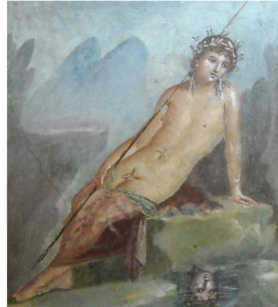
Görsel 2. Narkissos Odası, Lucretius Fronto Evi, Pompei, Duvar Resmi, M.S. 62 CE.