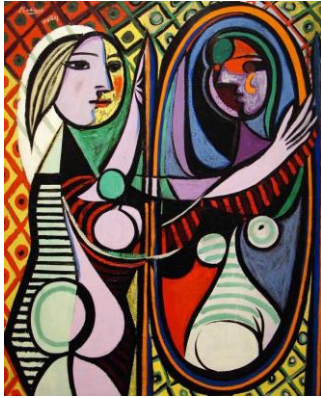
GörSEL 8. Pablo Picasso, Ayna Karşısındaki Kız , 1932 T.Ü.Y.B. 162,3 cm × 130,2 cm., Modern Sanatlar Müzesi (MoMA), Londra.

temsildir. Bu nedenle sürekli bilinçaltında bulunan ve kendi imajını yansıtmak isteyen narsist bir yaklaşımı ortaya koymaktadır. Dali'nin çalışmasının en önemli temalarından biri ulaşılamaz arzuların idealleşmesidir. Cinsiyet ve ölüm dürtülerinin el ile temsil edildiği idealize edildiği Narkissos'un yaşam ve ölümün değişmez gerçekliğe dönüşmesidir. Çatlayan yumurtadan çıkan Nergis çiçeği ise maddenin değişim ve dönüşümünün yeni sembolü olan simyadır. Sanatçının eli iki farklı şekilde yansıtan görüntüsü, Lacan'ın ilk karşılaşma anı olarak tanımladığı şeyi yansıtırken, ayna görüntüsü benliğin daha mükemmel idealize edilmiş görüntüsünü temsil eden arzuya dönüşmektedir. Eller aynı zamanda özdeşleşmeyi de temsil etmektedir çünkü imge birbirimizi tamamlamak için gerekli olan ancak asla birleşemeyeceğimiz "öteki" bir kavram olarak betimlenmiştir. "Bu resim ile Dali'nin hem klasik mitten kopması hem de Narkissos'un simya ile olan öyküsünün birleştirmesi, sanatçının kendi karakterini tasvir etme ihtiyacının bir parçasıdır. Sanatçı yaşamındaki belirgin olayları ve saplantıları ifade etmek için mitoloji ve simya unsurlarını birlikte kullandığı bilinmektedir" (Mallen, 2015:7).