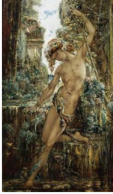
Görsel 6. Gustave Moreau Narkissos T.Ü.Y.B, 65.3 x 37.3 cm., 1890, Özel koleksiyon, Paris.

yandan başını suya ve kendi vücuduna yönelten bakışla erkeksi bir duruş sergilerken diğer yandan vücudunun hareketi ve kıvrımları ile kadınsı bir duruş sergilemektedir. Buna en iyi örneklerden birisi Moreau'nun 1860'tan başlayarak birçok yapıtına konu ettiği ve çok sıklıkla ele alıp betimlediği mitolojik kimliklerden birisi olan Narkissos 'tur (Görsel 6). Narkissos bu eserde, Ovidius'ta Ekho'nun öyküsüyle birleştirilmiş, iki insanın aşk uğruna boşuna harcadıkları çabalar dramatik bir biçimde dile getirilmiştir (İndirkaş, 2011:56). Tabloda ayakta duran Narkissos doğrudan kadın bir karakter olarak değil, son derece duygusal bir beden ve çocuksu bir görünüm içinde dolaylı şekilde betimlenmiştir.