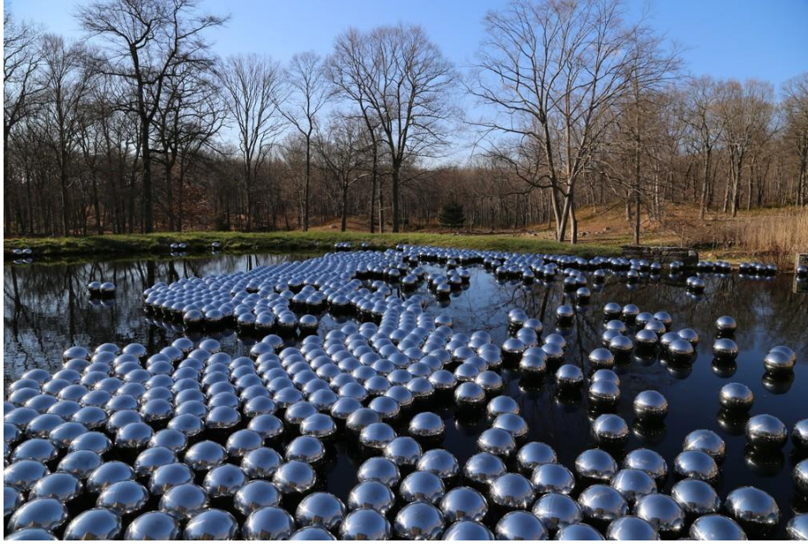
Görsel 10. Yayoi Kusama, Nergis Bahçesi , Çelik Küre, 1200 adet, çap: 30 cm, yerleştirme.

Modern sonrası dönemlerde sanatçılar tarafından ele alınmaya devam eden mit 1965 yılında Japon sanatçı Yayoi Kusama'nın Venedik Bienali'nde " Narcissus Garden " ( Nergis Bahçesi ) adlı bir yerleştirme çalışması ile başka bir boyut kazanır. Sanatçının eşlik ettiği 1.500 gümüş renkli toptan oluşan yerleştirme hem aynayı hem de Narkissos havuzunu uyandıran parıldayan bir çimen etkisi yaratır. Mit ve yerleştirme arasındaki ilişkide izleyiciyi açık bir okumaya ve maske ve egoları ile yüzleşmeye davet eder. Kusama'nın küreleri, izleyenin kendi yüzünü yansıtması veya kendisiyle yüzleşmeye zorlaması ile izleyicinin benzer ve çoklu yansımaları ile gerçeği veya ortamı tekrarlar, büyütür ve abartır (Aleph, 2018:1). Yansımaları topları dış mekâna yerleştirdiği, Nergis Bahçesi/Narcissus Garden " adlı çalışmasında izleyicilerin kendisi ile fiziksel iletişimini sağladı (Görsel 10). Böylece, "Ben"i özgürleştirmenin toplumsal sürecini başlattı. Bu çalışmadan sonra Kusama, toplumsal olarak belirlenen cinsiyet kavramını istikrarsızlaştırmak için yerleştirmelerinde eşcinsel modelleri kullanarak, cinsel özgürlük fikrine yeni bir yaklaşım getirdi (Gautherot vd., 2009:104).