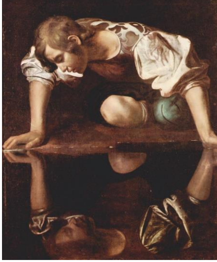
Görsel 3. Caravaggio di Merisi, Narkissos , 1597-1599, 110 x 92 cm, TÜYB, Nazionale d'Arte Antica Galerisi.