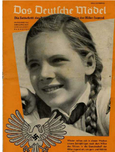
Resim 4: “Hitler Gençliği” Konulu Dergi Kapağı

Kült liderlik, bir liderin kitlelere yönelik efsanevi özelliklere sahip bir kişilik haline getirilmesini ifade etmektedir (Gazi vd., 2018b, 27). Nazi propagandasının sıklıkla üzerinde durduğu konuların başında Hitler’in kült lider olarak inşası gelmekteydi. Hitler, der Führer (lider, önder) unvanını alarak kitlelerin nezdinde efsane haline getirilmiş ve Alman halkının kayıtsız şartsız Führer’lerinin telkinlerine uyması istenmişti. Çünkü kült liderlik propagandasının temelinde de lidere itaat bulunmaktadır (Barmé, 2016,13). Kült liderlik propagandasının Nazi Almanyası’nda uygulandığı gruplardan biri de Hitler Gençliği üyeleri olmuştur.