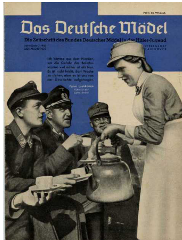
Resim 5: “Askerler” Konulu Dergi Kapağı

Finlandiya, 1939 yılında Sovyetler Birliği’nin saldırısına uğramıştı. Fin ordusunun sert direnişine karşın Sovyetler Birliği savaşta kazanarak Fin topraklarının bir kısmını işgal etmişti. Naziler, 1941 yılında Sovyetler Birliği’ne saldırdığında, Finlandiya ve Sovyetler Birliği arasında yeniden savaş meydana gelmişti. Bu süreçte Finlandiya ve Nazi Almanyası ortak düşman Sovyetler Birliği’ne karşı hareket etmişti (Mazower, 2014, 466).