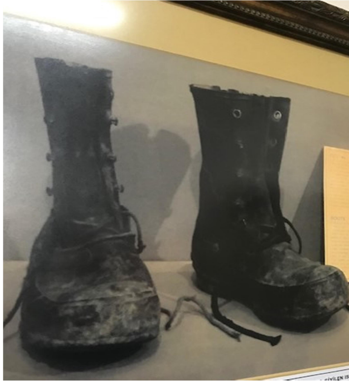
Kore Gazisinin Kore'de Savařırken GiydiĐi Bot (1953)