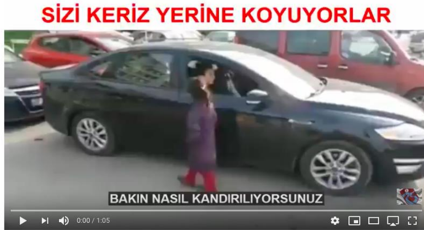
Süriyeli Dilencilerin Gerçek yüzü

Bu videoyu kayda alan kişinin kimliği belirsizdir. Videoyu kayda alan kişi videodaki Suriyelilerin lüks bir araçtan inip dilencilik yaptığını iddia etmektedir, ancak videoda lüks araca ilişkin herhangi bir görüntü bulunmamaktadır. Videoda trafikte durmakta olan araçların yanında duran ve dilencilik yaptığı iddia edilen çocuklar görülmekte, ayrıca kaldırımda oturmuş olan ve lüks araçtan inip dilencilik yaptığı iddia edilen bir kadının yerde oturduğu sırada çekilen görüntüleri ve videoyu çeken kişinin bu kadınla konuşma girişimi bulunmaktadır. Video toplamda 1.05 saniye sürmektedir. Video 1.135.824 kere görüntülenmiş, 16 B beğenilme ve 1.3 B beğenilmeme geribildirimini almıştır. Video açıklaması pazarlama retoriğine uygun şekilde abone sayısını artırma amacı ile oluşturulmuştur.