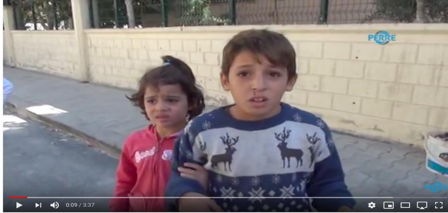
Suriyeli Dilenci Çocuklar Esnafa Kan Kusturdu

Bu videoda iki Suriyeli çocuk mendil satarken polis ve zabıta tarafından yakalanmıştır. Videoda çocuklara parayı nasıl kazandıkları, kim tarafından çalıştırıldıkları ve kazandıkları parayı ne için harcadıkları sorulmaktadır. Video 1.059.596 kere görüntülenmiş, 4,5 B beğenme, 2,3 B beğenmeme geribildirimi almıştır.