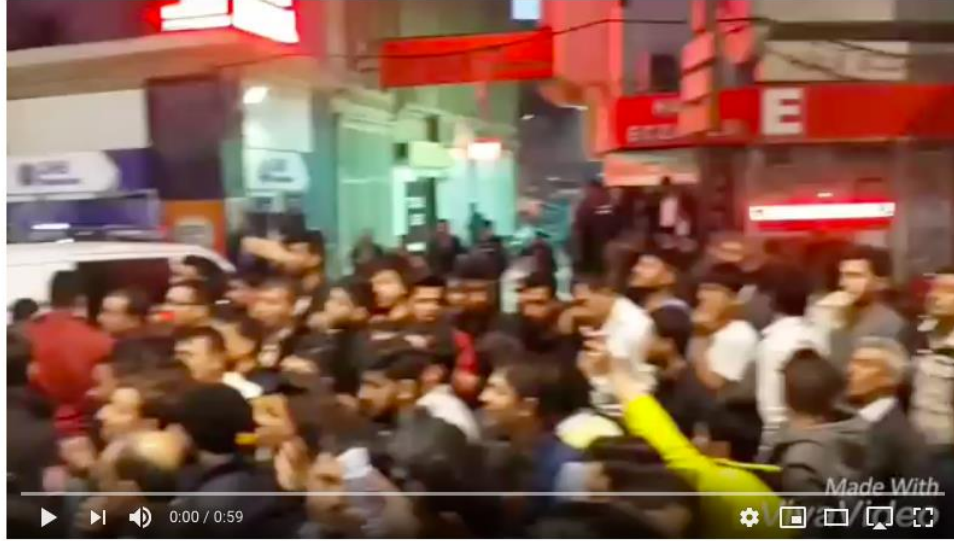
Polise kafa atan Suriyelinin sonu (Şanlıurfa) Abone ol takipte kal.