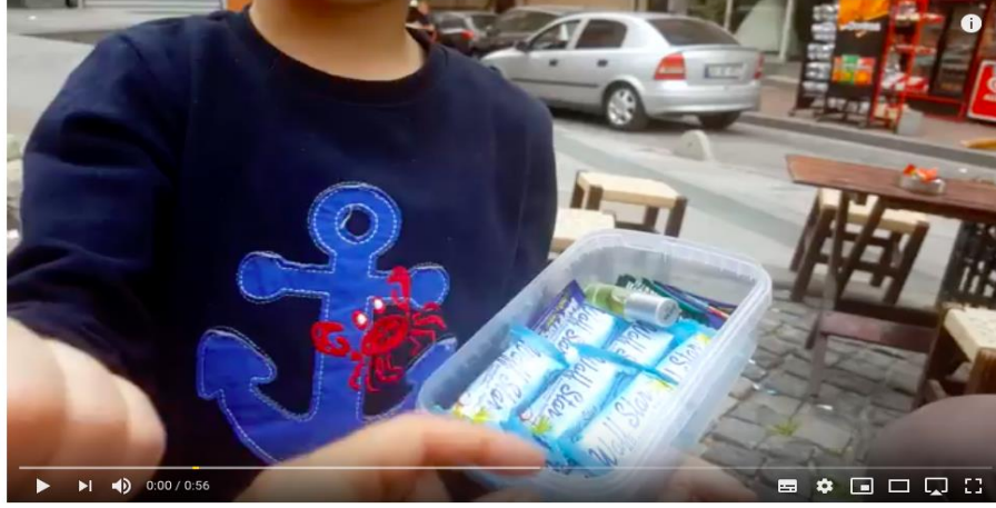
Suriyeli Çocuktan İbreklik Hareket