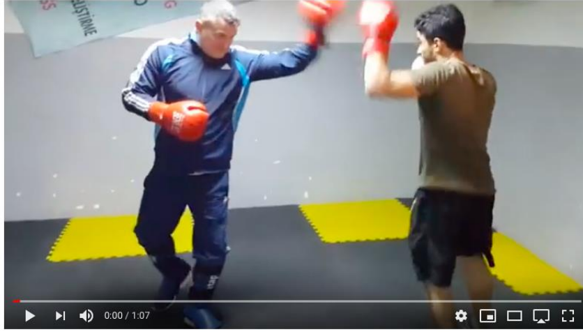
HERKESE MEYDAN OKUYAN SURIYELİYE TÜRKÜN CEVABI 🙏🙏🙏🙏

1,07 saniye süren videoda iki erkek boksör kapalı bir mekânda antrenman yapmaktadır. Video 3 milyondan fazla görüntüleme, 11 bin beğenme ve 4,4 bin beğenilmeme geribildirimi almıştır.