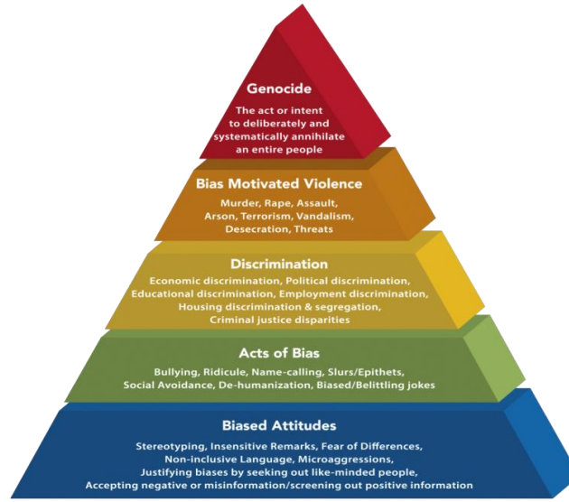
Şekil 1. Nefret Piramidi, Adl.org, 2018

Anti Defamation League'in hazırladığı "Nefret Piramidi"nde (Bkz. Şekil 1.) görüldüğü üzere, en alt kısımdan üst kısımlara doğru çıkıldıkça tutumlar söyleme, söylemler eyleme dönüşmekte ve nefret söylemi nefret suçuna dönüşebilmektedir. Soykırıma kadar gidebilen bu yolda, nefret suçunun temelleri tutum, davranış ve söylemlerde atılmaktadır. Bu piramide göre, kişiler veya kurumlar alt kısımlardaki nefret söylemi kapsamındaki davranışları normal veya kabul edilebilir gördüğünde bir sonraki seviyedeki davranışlar toplumda daha fazla kabul edilebilir olarak görülmektedir. Buna göre, soykırım düşüncesinin temellerinin alt seviyede tarif edilen davranışların kabul görmesi olgusunun üzerine inşa edildiği belirtilmektedir. (Ibid., 2018) "Weber, nefret söylemi olarak sınıflandırılabilir beyanların tespit edilmesi, bu tür konuşmaların ille de 'nefret' ifadeleri veya duygusu aracılığıyla dışa vurulmaması nedeniyle zorlaştığını, ilk bakışta mantıklı veya normal görünebilecek ifadelerde saklı olabileceğini belirtmektedir." (Weber'den akt. Kuş, 2016:100) Bu anlamda, nefret söylemi kimi zaman günlük dil içinde sıradanlaşmış basmakalıp yargıların ifadesinde, kimi zaman ise mizah adı altında üretilebilmektedir.