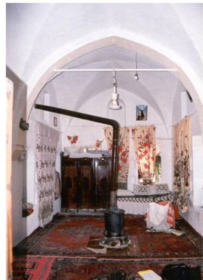
Şekil 13. Bir Müslüman evine ait oda