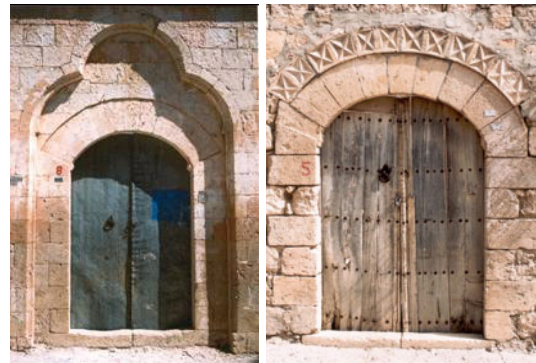
Şekil 26, 27. Avlu kapısı örnekleri

Kapılar avlu, oda ve aralık kapıları olarak incelenmiştir. Avlu kapıları (sokak kapıları) basık kemerli ve iki kanatlıdır. Kapı açıklığının üstünde, sade bir şekilde tek veya iki taş sıralı bir kemer olup, birinci sırada geniş, ikinci sırada ise dar taşlardan bir kemer örülmüştür. Kapılarda metal aksamlar ile ahşap bir arada kullanılmıştır. Ahşap olarak gürgen ve meşe kullanılmıştır. Kapıların üzerinde zengin çeşitleri bulunan şak şak denilen kapı tokmakları bulunur. Bu kapı tokmakları genellikle yuvarlak veya kuş motifleri şeklinde yapılmıştır. Kapı tokmakları dış ile iç arasındaki iletişimi sağlamaktadır (Şekil 26,27).