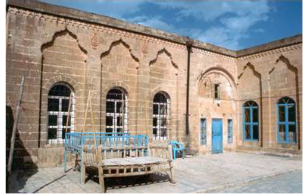
Şekil 10. Taht kurulmuş bir teras

Teras ve dam, günlük işlerin yapıldığı, mevsimlik yiyeceklerin kurutulduğu, geceleri yatılan ve yaz aylarında yoğun olarak kullanılan açık mekanlardır. Kullanım alanları geniştir. Özellikle kışlık yiyeceklerin hazırlanması aşamasında (kurutma ve salça yapım dönemlerinde) kullanılır. Hazırlanan yiyeceklerin kirlenmeden kurutulması için uygun mekanlardır (Şekil 10 ve 11).