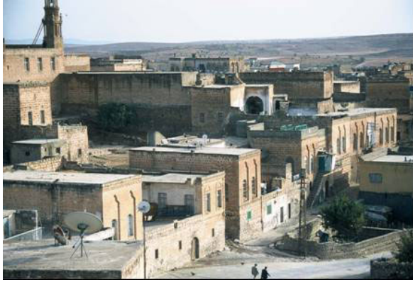
Şekil 5. Cumhuriyet caddesi

Dış cephenin sadeliğine karşı avlu cepheleri biçim ve süsleme açısından oldukça hareketlidir. Yığma yapım tekniğinde yapılmış olan Urfa evlerinin ana malzemesi yörede bolca bulunan ve işlenmesi çok kolay olan kalker taşıdır