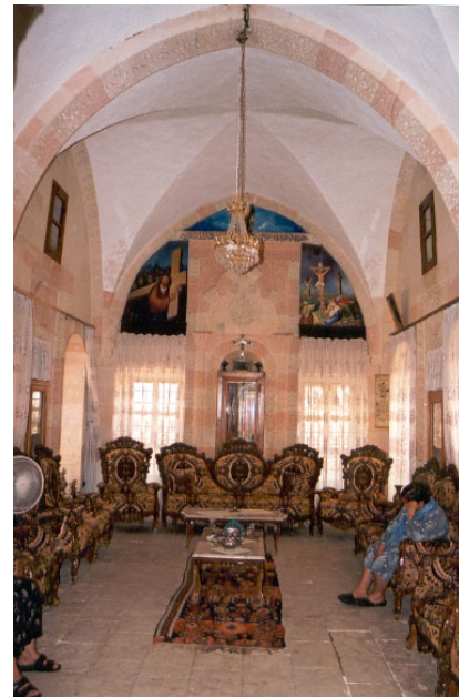
Şekil 12. Bir Süryani evine ait misafir odası

Odalar gündüzleri oturulan, misafir kabul edilen, yemek yenilen, banyo yapılan; geceleri ise hem oturma hem yatak odası işlevini gören mekanlardır. Kuzey kanatta yer alan, evin diğer odalarından daha ferah ve bezemeli oda misafir kabul odası olarak kullanılmaktadır. Bazı odalarda seki altı vardır. Burası ayakkabıların çıkarıldığı bölümdür. Su gideri olan bu bölüm banyosu olmayan Midyat evlerinde yıkanma işlevinin gerçekleştiği bölüm olarak da kullanılmıştır. Seki altı ile odanın esas oturma bölümü (seki üstü) arasında 5-10 cm'lik kot farkı vardır (Şekil 12,13).