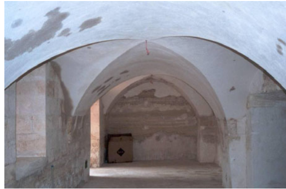
Şekil 16. Bugün kullanılmayan bir kiler örneği

Kiler, ev halkının kışlık yiyeceklerini, yakacaklarını ve eski eşyalarını sakladıkları mekandır. Yazın en sıcak günlerinde bile yiyeceklerin uzun süre bozulmadan kalmasını sağlayan bir serinliğe sahiptir. Bazı evlerde birkaç bölüme ayrılmıştır. Bu bölümler arasında kemerli geçitler bulunmaktadır (Şekil 16). Kilerlere fazla yüksek olmayan, sade bir kapıdan geçilerek içeriye girilir. Evlerin büyüklüğüne ve ev sahibinin zenginliğine göre boyutları değişmektedir. Genellikle döşemeleri ve duvarları doğal taş olup, üst örtüsü beşik veya çapraz tonozdur.