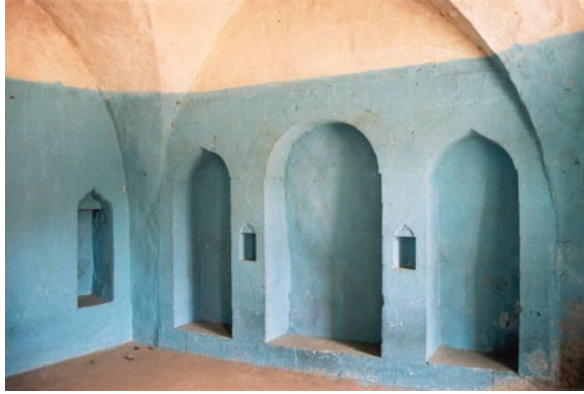
Şekil 14. Odaların duvarlarındaki nişler

Duvarlarda kapaklı ve kapaksız dolaplar (niş veya taka) ile yüklük bulunur (Şekil 14). Nişler odaların dört tarafında da bulunabilir. Genellikle sağır duvarlarda veya iki pencere arasında yer alır. Nişlerin sayısı ve süslemeleri evin büyüklüğü ve ev sahibinin zenginliği ile doğru orantıdır. Nişler, odalarda çeşitli süs ve aydınlatma eşyalarının konulması amacıyla, avlu ve eyvanda ise sabun, ibrik, ayakkabı, gaz lambası gibi eşyaların yerleştirilmesi amacıyla duvar içinde oluşturulan boşluklardır. Mekana hareket katan öğelerdir. Oda duvarlarında yer alan yüklükler yatakların konulduğu yerlerdir. Odalarda baca bulunur. Bazı odalarda lamba koymak için köşelik ve raflar vardır. Bazen bu görevi duvarlardaki küçük nişler görür.