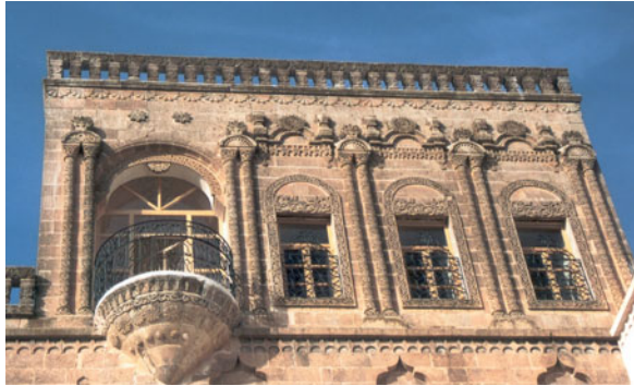
Şekil 21. Konukevinin avlu cephesi, en üst kat