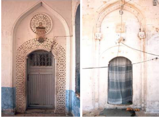
Şekil 28, 29. Oda kapısı örnekleri

Oda kapıları basık kemerli, yarım daire kemerli veya üç dilimli nişlerin içine oturup bir veya iki kanatlıdır. Süslü olup zengin motifler taşırlar. Oda kapılarının üst tarafında çerçeve motifleri ve kapı kenar motifleri arasında yuvarlak bir çerçeve içerisinde, lale, karanfil ve farklı motifleri içeren kabartmalar bulunur (Şekil 28, 29).