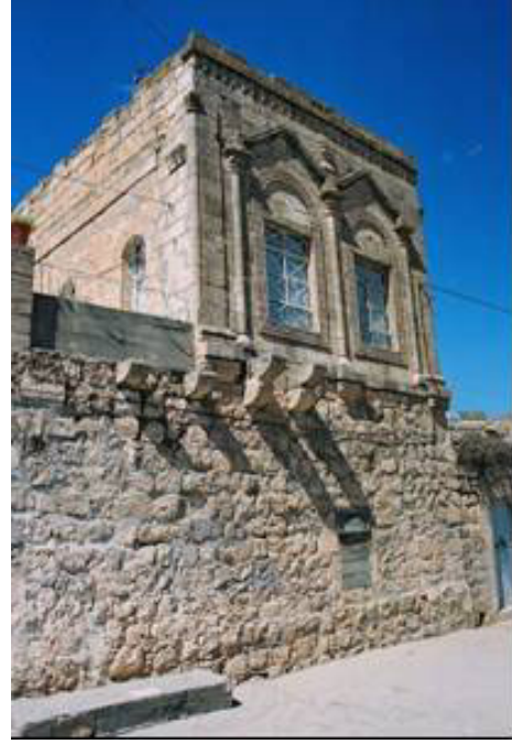
Şekil 18. Bir evin sokak cephesi