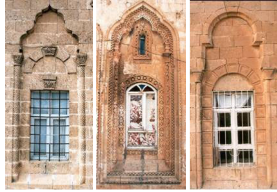
Şekil 23, 24, 25. Pencere örnekleri

Bazı pencerelerin üstlerinde, alttaki pencere ile aynı niş içerisinde ya da iki pencere arasında, kuşluk denilen küçük bir tepe penceresi bulunur. Tepe pencereleri dikdörtgen, yuvarlak, dilimli yuvarlak, elips ve su damlası formlarında olup, boyutları diğer pencerelere göre oldukça küçüktür. Daha çok havalandırma amacıyla yapılmıştır. Yazın ısınan havanın yükselip bu boşluklardan çıkması böylece doğal havalandırılmanın yapılması sağlanmıştır. Tepe pencereleri orta pencereyle birlikte aynı nişin içerisine yerleştirildiği gibi, iki pencere arasında yapıldığı da olur. Evlerin cephelerinde, ender olarak görülen kuş takaları ise genellikle pencerenin üzerinde ve yarım daire formundadır. Bazen pencereler arasında kabartma motifler bulunur (Şekil 23, 24, 25).