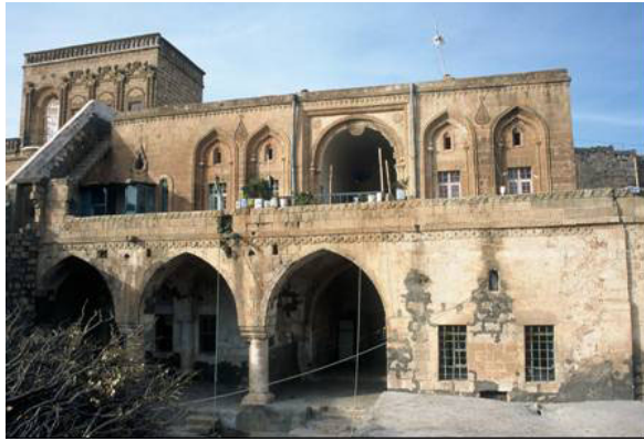
Şekil 22. Bir evin avlu cephesi

Cephelerde eyvan ön plana çıkarılmış olup, eyvan açıklığı yarım daire ya da sivri kemerin yoğunlukla kullanıldığı biçimlere sahiptir. Eyvanlar genellikle tek açıklıklıdır. İki açıklıklı eyvan örneği azdır. Eyvan açıklığı, yuvarlak kesitli sütunlara otururlar. Revak kemerleri, yarım daire ya da sivri kemerlidirler. İki veya üç açıklıklı olan tipleri vardır.