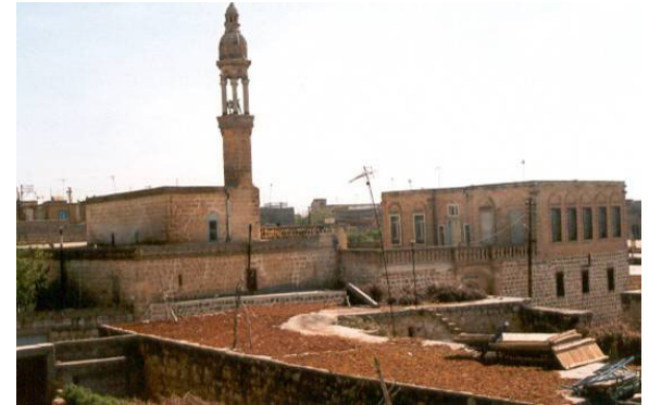
Şekil 11. Üstünde kurutma yapılan bir dam

Damların ve terasların kenarlarında değişik süslemeli silmeler yer alır. Damların kenarındaki parapetler, aynı zamanda kat yüksekliğinin dışarıdan görünmesini de sağlar. Yüksekliği taş sırasına göre değişen parapetler, genellikle süslemelidir. Parapetlerde açılan oyuklar kış aylarında, damdaki karın aşağı atılmasını sağlamak için yapılmıştır.