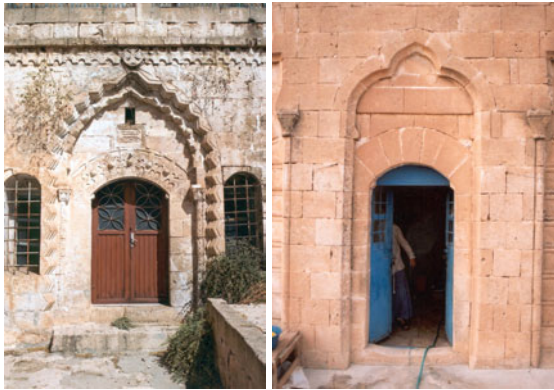
Şekil 30, 31. Aralık kapısı örnekleri

Aralık kapıları çift kanatlı veya tek kanatlı, bazen kemerli ve dilimli niş içerisinde yer alan ahşap elemanlardır (Şekil 30,31).