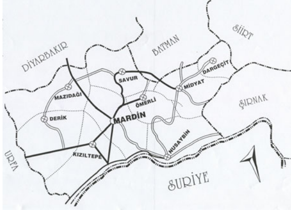
Şekil 1. Mardin haritası ve Midyat'ın yeri [4]