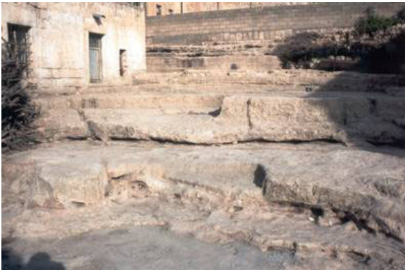
Şekil 9. Doğal taş döşeme avlu

Avlu döşemesi genellikle doğal taştır (Şekil 9). Bu nedenle fazla ağaç ve çiçek ekilememiştir. Avlunun bazı bölümlerine toprak doldurularak veya saksılara çiçekler ekilerek yeşil ögesi kullanılmıştır. Döşemesi eğimli olan avlu zeminleri traşlanarak basamaklar