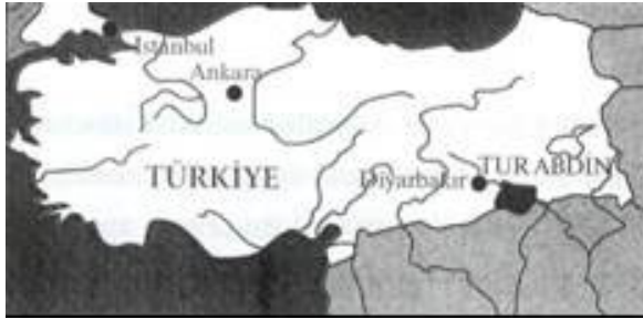
Şekil 2. Türkiye haritasında Tur Abdin'in yeri [5]

dönemlerini görmüş, tüm bu önemli uygarlıkların etkileriyle yoğrulmuştur. Tarihin ilk Hıristiyan halkı bu bölgede yaşamış, manastır hayatı burada doğmuştur. Turabdin'le ilgili ilk yazılı belgeler M.Ö. 13. yüzyıla kadar uzanır. Midyat, M.Ö. 9.yy Asur tabletlerinde, mağara kenti anlamında "Matiate" olarak geçer. Resmi kayıtlarda, 16. yy'da bir köy olduğu görülmektedir [2,6,7]. Midyat'ın köy olarak varlığını 19. yüzyılın başlarına kadar devam ettirdiği ve 1810'larda kaza olduğu bilinmektedir. 1839 yılındaki resmi belgelerde, 19 nahiyesi olan bir kaza olarak geçmektedir [7,8]. 1890 yılında ise belediye teşkilatı kurulmuştur. Midyat 1927 yılında Mardin'e bağlanmıştır. 1930 yılında Midyat ve Estel belediyeleri, Midyat adı altında birleşmiştir.