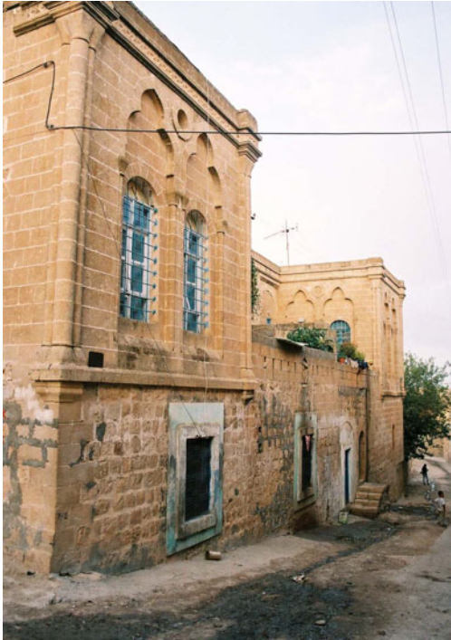
Şekil 17. Bir evin sokak cephesi

Üst kat pencereleri değişik formlarda, süslemeli ve gösterişli yapılmıştır.