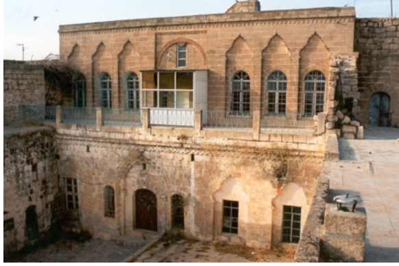
Şekil 20. Bir evin avlu cephesi