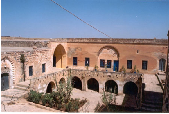
Şekil 8. Avlu ve çevresindeki birimler

Giriş katındaki biçimlenmeyi belirleyen en önemli öge olan avlu, parselin ve evlerin büyüklüğüne göre boyutlandırılmış olup evin merkezi niteliğindedir. Mekanlar arası bağlantının sağlandığı ortak alandır. Günlük işlerin büyük çoğunluğu burada yapılır. Özellikle yaz aylarında, gündüzleri oturulan ve geceleri yatılan, üstü açık bir oda şeklindedir. Düğün, nişan, sünnet, taziye gibi etkinlikler gerçekleştirildiği ve özellikler kadınlar için gündelik hayatın geçtiği mekandır (Şekil 8).