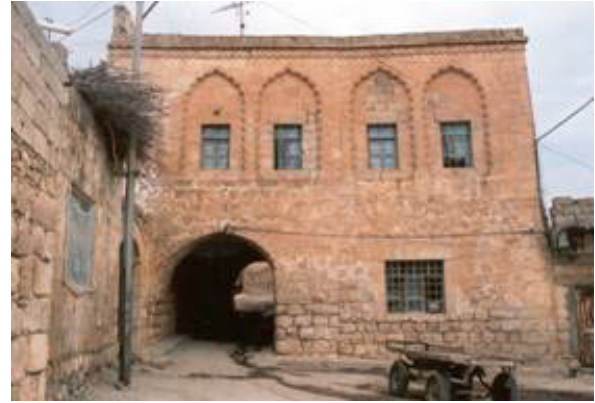
Şekil 19. Kabaltılı bir evin sokak cephesi