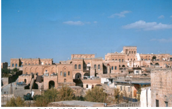
Şekil 4. Midyat'ın kuzey kesimi