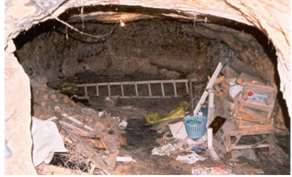
Şekil 15. Bugün depo olarak kullanılan bir ahrır örneği

düzenleyerek oluşturulmuştur (Şekil 15). Duvarlarında yemlikler bulunur. Genellikle küçük baş hayvanların tutulduğu mekanlardır. Eskiden ilçe merkezinde temizlik sağlanması amacıyla büyükbaş hayvanların girmesi istenmediğinden büyük ahrırlar yapılmamıştır.