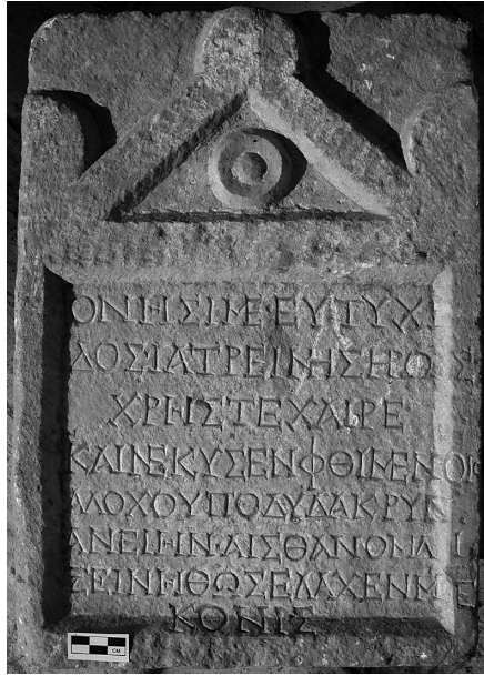
Fig. 3