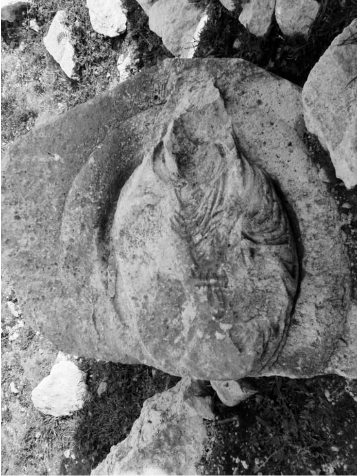
Fig. 5 Karaböcülü Tapınak Mezarına ait kadın yarım büstü.