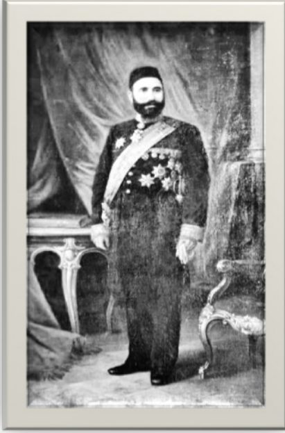
“Hacı Zeynelabidin Tağıyev Tablosu” 2