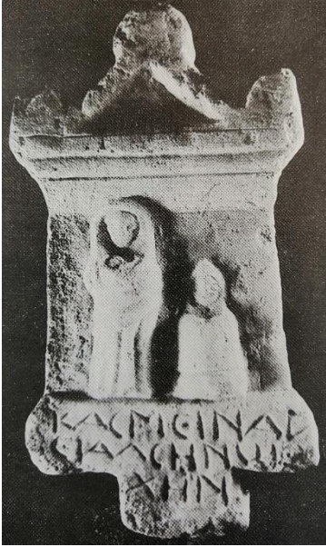
Fig. 5. Drew-Bear vd. s. 173, No. 242.