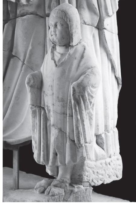
Fig. 3. Perge Grubu, Telesphoros.