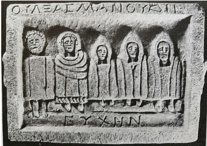
Fig. 4. Drew-Bear vd. s. 134, No. 164.