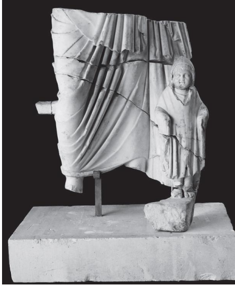
Fig. 2. Perge Grubu, Antalya Müzesi, Env. No. 2014/193.