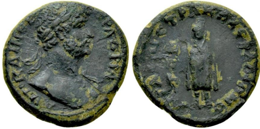
Fig. 9. Pergamon, ÖY: Hadrian AY: Telesphoros, https://www.coinarchives.com/a/results.php?search=telesphoros&s=0&upcoming=0&results=100