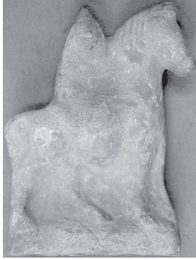
Fig. 8. Ehling 2005, s. 163, Abb. 1.