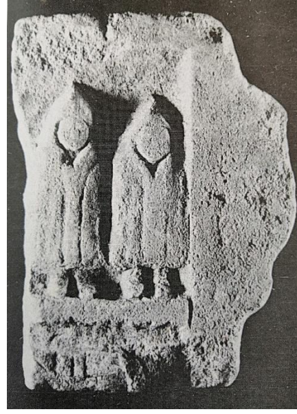
Fig. 6. Drew-Bear vd. s. 119, No. 136.