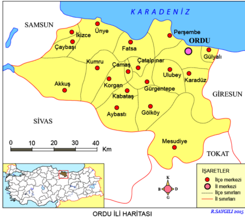
Şekil 1. Ordu İlinin Konumu ve İlçeleri

doğuda Turnasuyu Vadisi, güneyde Kelkit Çayı Vadisi, batıda Terme Ovası ve kuzeyde ise 107 km. kıyı uzunluğu ile Karadeniz çizer (Şekil.1).