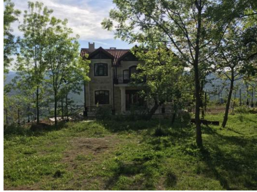
Foto 4 ve 5. Kabakdağı Köyünde Ziyaretçilerin Ağırlandığı Evlerden Örnekler