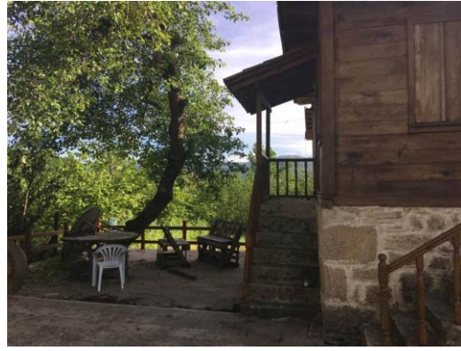
Foto 6 ve 7. Organik Tarım Ürünleri ve Turizmde Değerlendirilen Yöresel Mesken

Dağınık yerleşmenin hâkim olduğu Karadeniz Bölgesinde bir meydanı bulunan köylerin sayısı fazla değildir. Kabakdağı tarihi köy meydanının günümüze kadar aslını koruyarak kaldığı ender köylerdendir. Ekoturizm merkezi olma ile birlikte yakın zamanda çevre düzenlemesi yapılmış ve turizm aktiviteleri açısından önemli bir merkez haline gelmiştir.