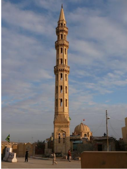
Şekil 3-Telafer'de Büyük Kale Camisi