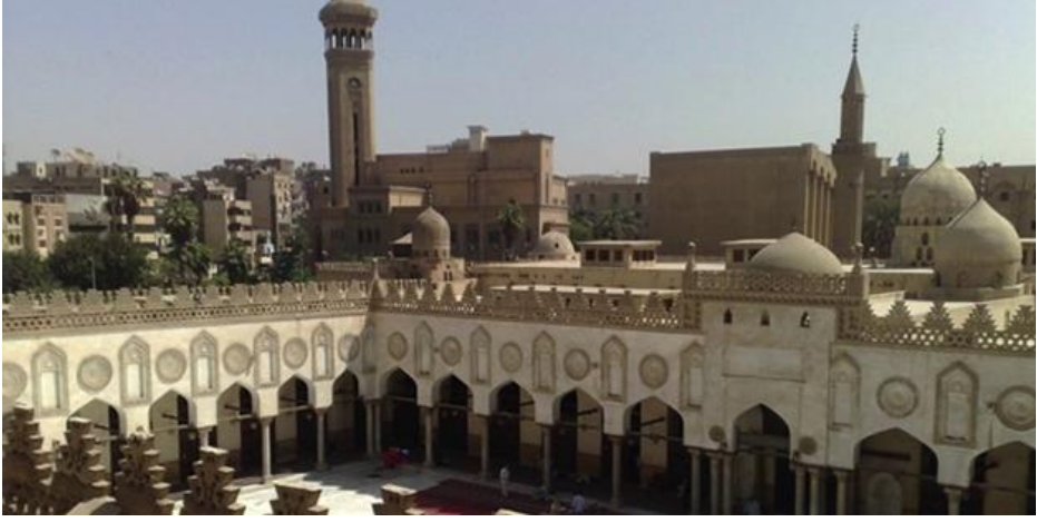
Şekil 2-Bir Türkmen Şehri Telafer (Akit Gazetesi, 06 Şubat 2018)