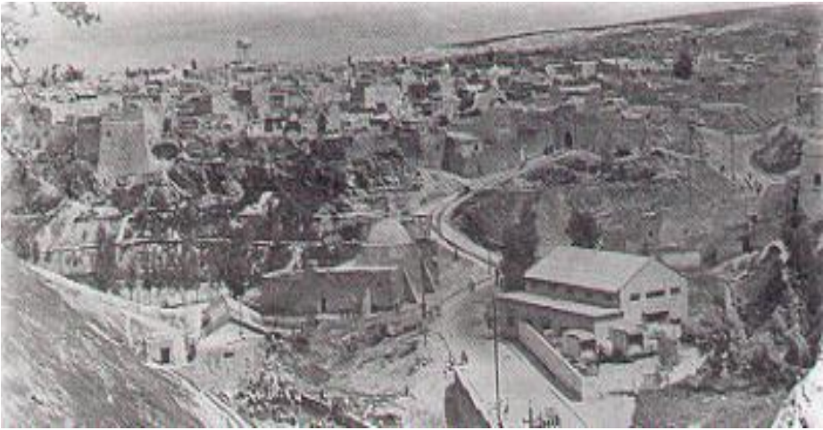
Şekil 7-Telafer Kalesi