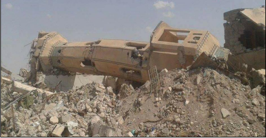
Şekil 6-Terror Olaylarında Patlatılan Tarihi Şeyh Cevad Minaresinin Son Durumu