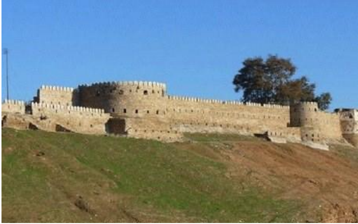
Şekil 5- Tarihî Telafer Kalesinden Bir Görünüş (alarabiyye. Net, es-Sebt 1 Zülka'de H. 1439)