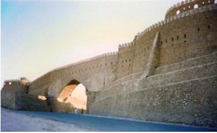
Şekil 4-Tarihî Telafer Kalesinden Bir Görünüş (waw Turkey 1 milyon Türkiye Fotoğrafi, Kerkük-Türkmeneli)