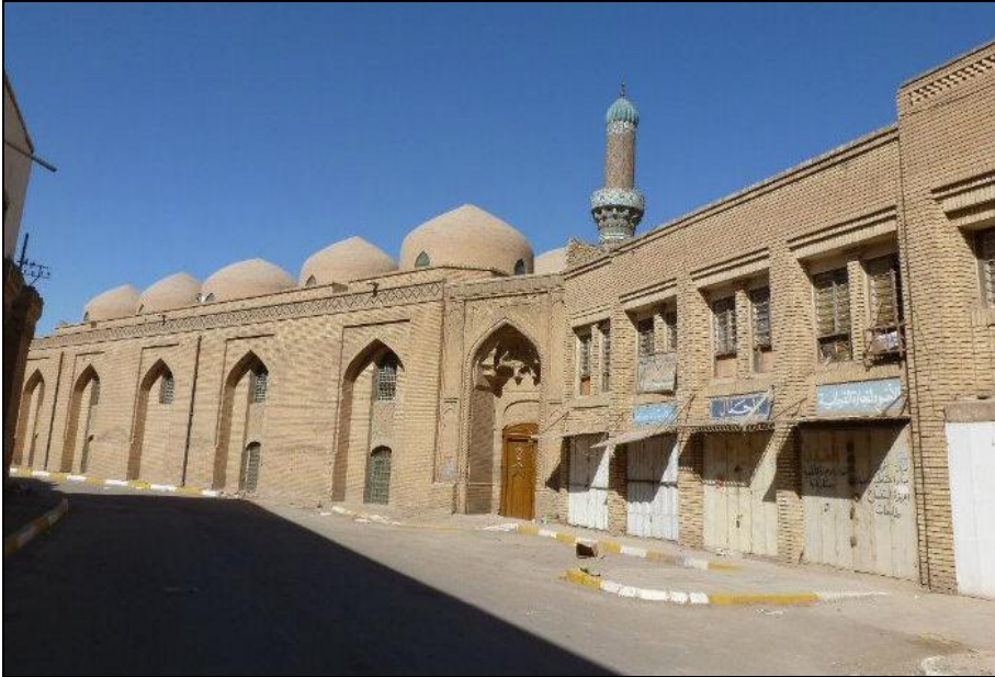
Şekil 1-Telafer Saray Külliyesi