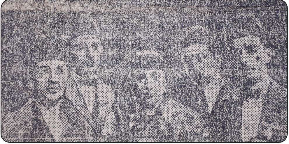
Ek-1: Darülfünun İane Heyetleri 72