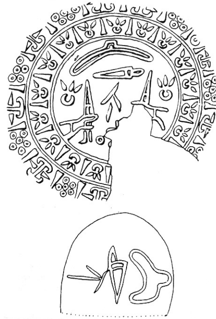
Resim 1b. Aynı mühür baskısının çizimleri. Schaeffer, 1956, 37.