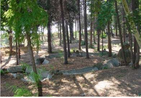
Figür 32. Birinci set bahçesinde bulunan havuzun onarım öncesi durumu