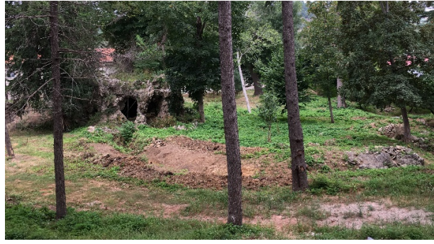
Figür 6. Beykoz Kasrı'ndaki grotto ve grottoya ait su

Bahçeler içindeki bir diğer su yapısı ise üçüncü set içindeki ağaçlık alanda, yaz sıcaklarından korunmak için yapılmış olan grottodur (Figür 5). Osmanlı'nın Batılılaşma Dönemi'nde İstanbul'un büyük bahçelerinde rastlanan grottolar bahçe duvarına, eğer sera gibi yapı içinde yer alıyorsa yine seranın bağlantılı olduğu duvara bitişik olarak tasarlanmışlardır. Ancak Beykoz Kasrı'ndaki dağ hamamı olarak da adlandırılan grotto dönemin grottolarından farklı bir örnektir. Bahçe içerisinde başka bir yapıya dayanmadan bağımsız olarak inşa edilen grotto Osmanlı bahçelerinde görülen en büyük örnektir. Dar ve dolambaçlı bir yol ile ulaşılan grottonun kubbeli iki küçük odası vardır (Figür 7, 8). Bir odanın duvarları ise istiridye kabukları ile süslenmiştir (Figür 8). Eskiden grottonun üzerinden devamlı dökülmekte olan sular serin hava akımı oluşturmakta ve sonrasında grottonun önünden başlayarak bahçe içinde devam eden kanallar yardımıyla akmaktaydı.