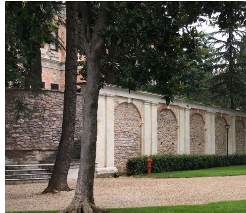
Figür 35. Beşinci set bahçesine ait duvarların onarım sonrası sıvasız hali