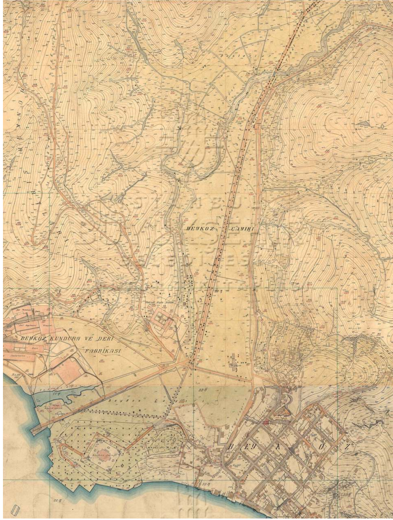
Figür 1. 1926 İstanbul-Anadolu Ciheti Haritası'nda Beykoz Kasrı ve Beykoz Çayırı ( http://ataturkkitapligi.ibb.gov.tr/ataturkkitapligi/index.php )

Beykoz Kasrı denizden başlayarak teraslar halinde yükselen bir bahçe düzenine sahiptir. İstanbul'da arazinin engebeli oluşu bahçelerin setli ve kademeli olmasına neden olmuştur. Zeminin bir istinat duvarı ile en sade şekilde desteklenmesiyle tek setli bahçeler elde edilmiş, bahçe olarak kullanılan arazinin meyle paralel büyümesi durumunda bu işlemin birkaç defa tekrarlanması neticesinde çok setli bahçeler meydana getirilmiştir. Bu setler birbirine birkaç basamak ile çıkılan yüksekliklerden birkaç metreye varan boylarda olabilmektedir. Arazinin şekline, bahçenin büyüklüğüne göre bahçe kendi başına set şeklinde olabildiği gibi bazen setli bahçe daha büyük bir bahçenin parçası olarak da karşımıza çıkmaktadır. İstanbul Boğazı'nda çeşitli örnekleri oluşturulan setli bahçelerde genellikle arazinin düz olan yerine konut inşa edilmiş, konutun arkasında yükselen yamaç ise bahçe olacak şekilde düzenlenmiştir.