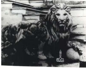
Figür 24. Top tutan aslan heykeli

Arşiv fotoğraflarından geçmişte kasrın yer aldığı beşinci set bahçesinde üç adet aslan heykeli bulunduğu (Figür 24-26), bu heykellerden top tutan aslan olarak anılan iki heykelin (Figür 24, 25) kasrın giriş merdivenlerine sağlı, sollu yerleştirildiği anlaşılmaktadır. Ayağı ile yılan tutan bir aslanın canlandırıldığı üçüncü heykelin (Figür 26) ise bahçe içerisinde konumlandığı düşünülmektedir.