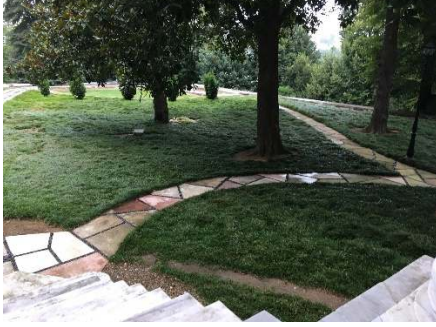
Figür 9. Kasır çevresindeki

Kasır çevresindeki geniş çim alan içinde bulunan genişlikleri yarım metreyi geçmeyen yollar taş döşemedir. Taş plakaların arasında mavi renkli çakıl taşları kullanılarak döşemeler süslenmiştir (Figür 9). Set bahçelerindeki çim alanlar daha da büyüktür, çakıl taşı döşeli yollar bazen patika şeklindedir bazen de daha geniş alan kaplamaktadır (Figür 10).