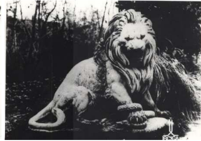
Figür 26. Ayağı ile yılan tutan aslan heykeli

Bu heykeller Sultan Abdülaziz döneminde (1861- 1876) İstanbul saray ve bahçelerini süslemek üzere Fransa'dan getirilmiştir (Seçen 2014: 19). Sultan Abdülaziz, XIX. yüzyıl Avrupası'nda heykel sanatına damgasını vurmuş olan Romantizm akımına göre biçimlendirilmiş olan hayvan figürleri ile, Beylerbeyi Sarayı bahçeleri başta olmak üzere, İstanbul'un saray ve köşk bahçelerinin Batı'daki kentlerde olduğu gibi süslenmesine özen göstermiştir. Abdülaziz döneminin yeniliği olan bu eserler, çok uzun süre figürlü plastikten uzak kalmış olan Osmanlı İmparatorluğu'nun sanatta Batı'ya açılış döneminin ilk heykel örnekleri olması açısından önemlidir (Çetintaş 2007: 925). Ancak bugün bu heykellerin hiçbiri kasır bahçesinde bulunmamaktadır.