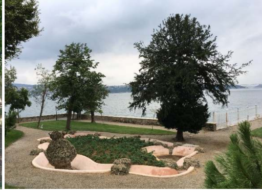
Figür 33. Birinci set bahçesinde bulunan havuzun onarım sonrası durumu

Bu havuz içindeki yapay kayalar dikkatlice incelendiğinde, kayaların arasında kalan özgün harcın renginin gri olduğu görülmektedir. Arşivlerde yapılan incelemelerde, İstanbul'da diğer bahçelerde bulunan bu döneme ait kaskad, grotto gibi öğelerin inşasında kullanmak için yurt dışından çimento getirildiği bilgisine ulaşılmaktadır (Toğral 2011: 138; Uğuryol ve Uğuryol 2017: 268; BOA, HH.d, Defter: 31358; BOA, HH.d, Defter: 31085). Yüksek ihtimalle hem söz konusu havuzun hem de bahçe içindeki grottonun yapımında çimento kullanılmıştır. Bu nedenle havuzda yapılan uygulama özgün malzeme kullanımı açısından iyi bir örnek oluşturmamaktadır.