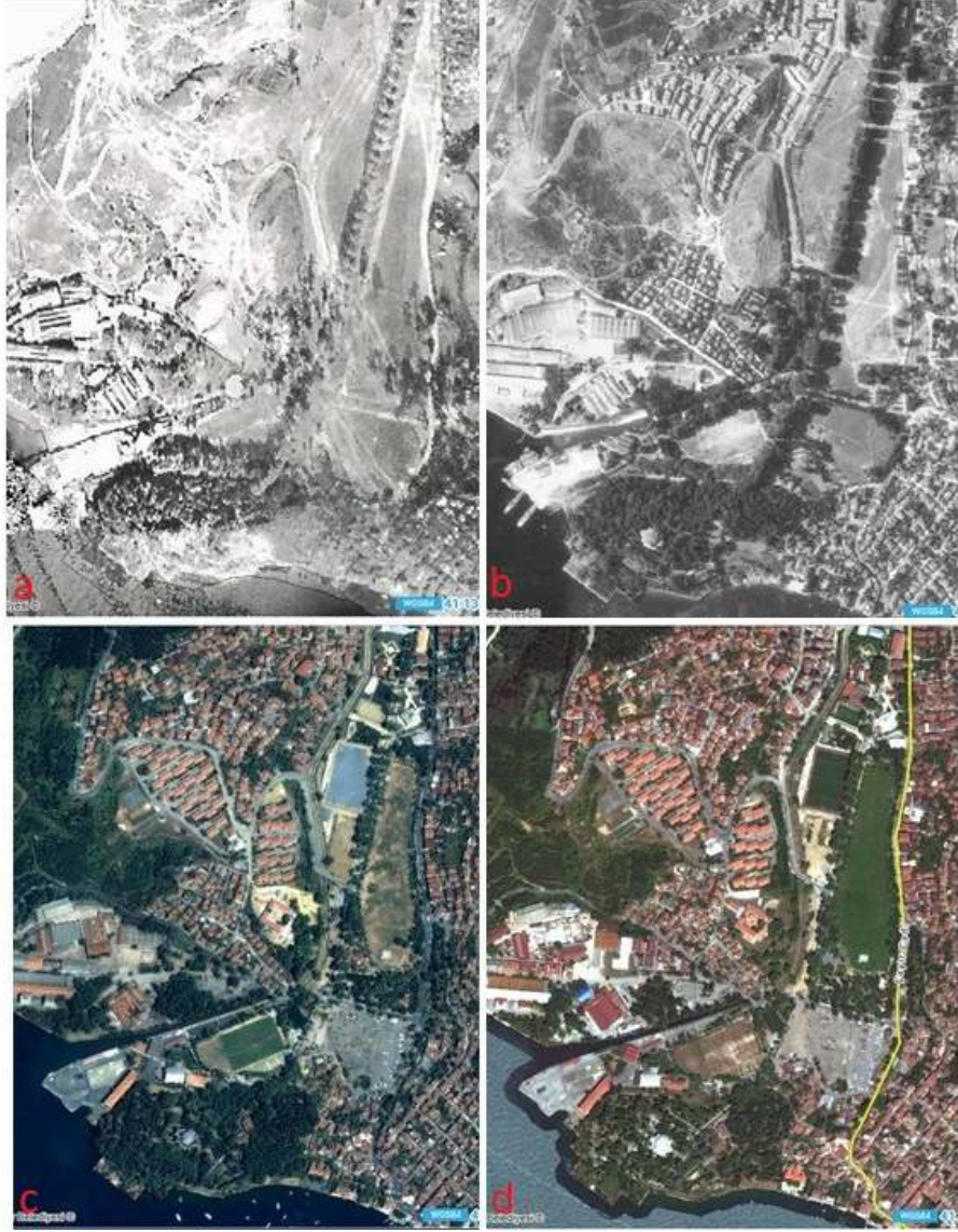
Figür 15. Farklı yıllara ait hava fotoğrafında Beykoz Kasrı ve Beykoz Çayırı. (a) 1970 yılı, (b) 1982 yılı, (c) 2006 yılı, (d) 2017 yılı ( https://sehirharitasi.ibb.gov.tr/ )

Geçmiş dönemlerde farklı amaçlarla işlevlendirilen Beykoz Kasrı'nın Beykoz Çocuk Hastanesi olarak hizmet verdiği dönemde bahçelerinin bakımları gereğince yapılmamıştır. Bakımsızlık ile artan malzeme sorunları mimari öğelerde ağır tahribat meydana getirmiştir. Uzun yıllar bakımsız kalan bahçelerde gelişen bitki kökleri zemin döşemesi, merdiven gibi öğelerin yerlerinden oynayarak deformasyona uğramasına, set duvarlarında çatlaklara neden olmuştur (Figür 16). Set duvarlarının yüzeylerinde bitkilerin kontrolsüz gelişimi sebebiyle duvarların yüzeyinde de çeşitli hasarlar oluşmuştur. Bu süreçte tarihi bahçelerdeki bazı su öğeleri de zarar görmüştür (Figür 17-19). Suyun temininde kullanılan su yollarının tahrip olması nedeniyle su öğelerinin suları kesilmiştir. Bakımsızlık