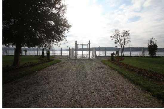
Figür 28. Kasrın iskelesinin onarımlar sonrası hali

Ne var ki üçüncü set bahçesinde bulunan grottoda ileri derecede bozulmalar görülmektedir. Önceki yıllara göre daha da ilerleyen malzeme bozulmaları nedeniyle grottonun bir bölümü yıkılma tehlikesi ile karşı karşıyadır. Bahçe içinde bu grottoya ait suyolları olduğu anlaşılmaktadır fakat günümüzde bu yollar oldukça kötü durumdadır.