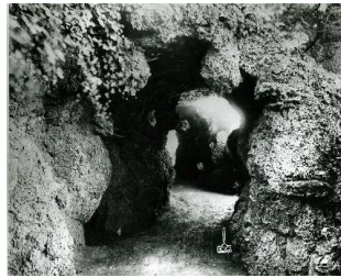
Figür 30. Yıldız Albümleri'ne ait bir fotoğrafta üçüncü set bahçesindeki grottonun detayı