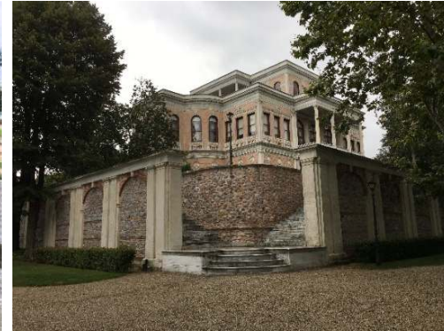
Figür 12. Beşinci set bahçesine ve kasma ulaşımı sağlayan merdiven