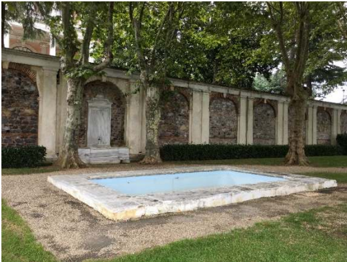
Figür 4. Dördüncü set bahçesinin set duvarlarına yerleştirilen çeşmeler ve önünde bulunan havuzlara birer örnek

Bu havuzların dışında en alt bahçe olan birinci set bahçesinde amorf biçimli bir havuz bulunur. Ortasında bitki yetiştirmek için adası olan havuzun kenarları yapay kayalar ile hareketlendirilmiştir. Ayrıca havuz içinde dairesel forma sahip bir yapay kaya aracılığı ile su akıtılmaktadır (Figür 5).