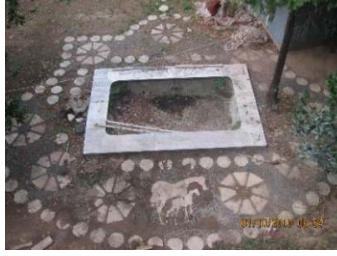
Figür 17. Tesisatı ve çevresindeki döşemesi bozulan süs havuzu