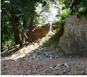
Figür 21. Yıkılan bahçe duvarının 2005 yılındaki hali (Milli Saraylar Arşivi)