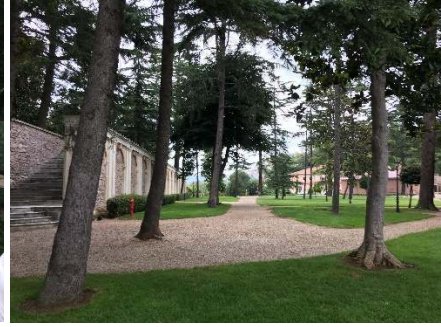
Figür 10. Set bahçelerindeki geniş yürüvüs volu ve vesil alanlar

Bahçelerin bulunduğu arazinin eğimli olması dolaşımda merdiven ve rampa kullanımını zorunlu kılmıştır (Figür 11-14). Merdivenler öncelikli olarak dolaşımı sağlamak amacıyla kullanılmış öğelerdir. Estetik işlev ikinci plandadır. Sadece kasma ulaşılan beşinci set bahçesinde kullanılan merdivenin anıtsal bir özellik taşıdığı söylenebilir (Figür 12). Diğer set bahçelerindeki merdivenlerden farklı olarak basamaklarında mermer kullanılan bu merdiven kasma doğru iki koldan ulaşım sağlar.