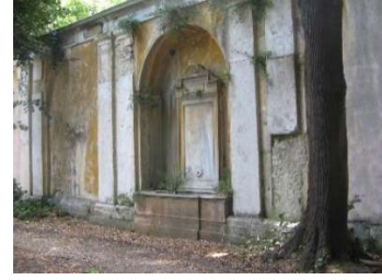
Figür 18. Suyu kesik olan çeşmelerden biri