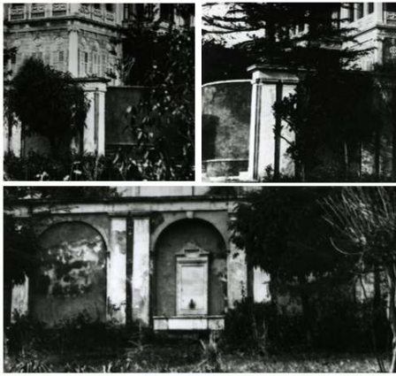
Figür 34. Beşinci set bahçesine ait duvarların Yıldız Albümleri'ne ait bir fotoğrafta görünen sıvalı hali

Özgün görünümün değiştiği benzer bir durum beşinci set bahçesinin duvarlarında söz konusudur. Yıldız Albümleri'ne ait fotoğraflarda bu duvarların yüzeylerinin sıvalı olduğu görülmektedir (Figür 34). Geçmiş yıllarda çeşitli onarımlar gören duvarların özgün sıvası bozulmuştur. Son dönem onarımları sırasında tüm sıvalar kaldırılarak duvarlar taş dokusu gözükcek şekilde bırakılmıştır.