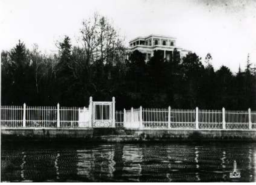
Figür 27. Kasrın iskelesinin 20. yüzyıla tarihlenen bir fotoğrafta görünümü