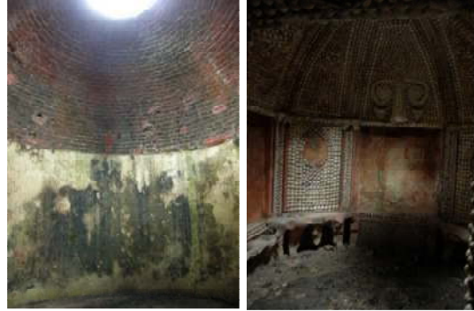
Figür 7. Grotto içerisindeki kubbeli iki küçük odadan biri