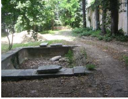
Figür 19. Kenar taşları kırılan ve tesisatı bozulan havuz