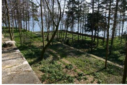
Figür 20. Bakımsız kalan set bahçelerinin hali

Bakımsızlıkla beraber etkisini artıran yıpratıcı çevresel etmenler sonucu duvar örgüsünde kullanılan derz harçlarının bozularak duvar örgüsünde kullanılan taşlardan ayrılmasıyla yer yer çeşitli derinliklerde boşluklar meydana gelmiştir. Hatta bu durum belirli noktalarda duvarların çökmesi ile sonuçlanmıştır (Figür 21). Keza kasrın çevresindeki süs havuzlarının etrafındaki mozaik döşemelerdeki harçların tutuculuğunu yitirmesi, mozaikleri oluşturan taşların dağılmasına ve kompozisyonların bozulmasına sebep olmuştur. Öte yandan, kasrın deniz tarafında taş babalara monte edilmiş demir parmaklıklarının çoğu geçmişte kırılarak denize düşmüştür (Figür 22).