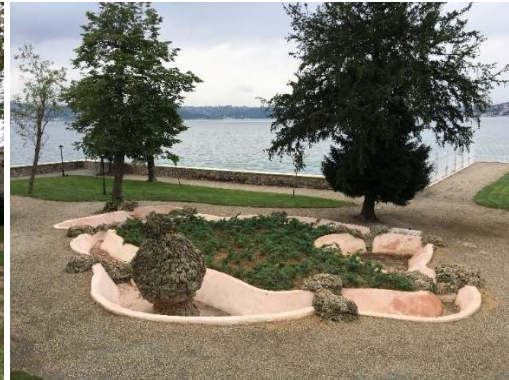
Figür 5. Birinci set bahçesinde yapay kayalar ile süslenmiş havuz