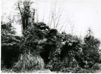
Figür 29. Yıldız Albümleri'nden bir fotoğrafta üçüncü set bahçesindeki grottonun görünümü

Ne var ki üçüncü set bahçesinde bulunan grottoda ileri derecede bozulmalar görülmektedir. Önceki yıllara göre daha da ilerleyen malzeme bozulmaları nedeniyle grottonun bir bölümü yıkılma tehlikesi ile karşı karşıyadır. Bahçe içinde bu grottoya ait suyolları olduğu anlaşılmaktadır fakat günümüzde bu yollar oldukça kötü durumdadır.