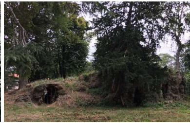
Figür 31. Üçüncü set bahçesinde yıkılma tehlikesi ile karşı karşıya bulunan grotto ve grottonun ön kısmındaki tahrip olan su yollarının günümüz durumu

Kasrın birinci set bahçesindeki onarımı yapılan havuzun özgün malzeme özelliğini kaybettiği onarım öncesinde çekilen fotoğraftan anlaşılmaktadır (Figür 32). Onarımlar sırasında havuzun bozulan sıvaları özgün haline uygun olmayan pembe renkli kireç harcı ile yenilenmiştir (Figür 33).