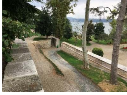
Figür 14. Birinci set bahçesinden dördüncü set bahçesine ulaşımı sağlayan rampa şeklinde