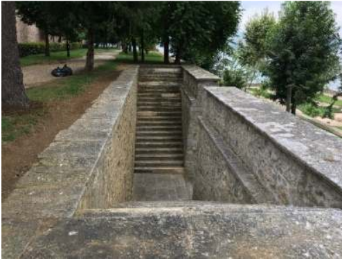
Figür 11. Dördüncü set bahçesine ulaşımı sağlayan merdiven

Kasır arazisine giriş kara tarafında bulunan bir kapıdan sağlanmaktadır. Kapıdan girildiğinde hafif eğimli bir rampa ile karşılaşılmaktadır (Figür 13). Bu rampanın sonundan dördüncü set bahçesine ulaşılmaktadır. Bahçe içinde dolaşımı sağlayan bir diğer rampa birinci set bahçesini dördüncü set bahçesine bağlayan rampadır (Figür 14). Kasrın deniz kenarında birinci set bahçesinde deniz ulaşımı için bir iskelesi, Yalıköy mahallesi tarafında sahile açılan bir kapısı vardır. Çayır tarafında ise kasrın kemerli başka bir kapısı bulunmaktadır.