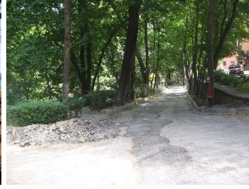
Figür 23. Çimentolu harç ile kaplanmış yürüyüş yolları

Arşiv fotoğraflarından geçmişte kasrın yer aldığı beşinci set bahçesinde üç adet aslan heykeli bulunduğu (Figür 24-26), bu heykellerden top tutan aslan olarak anılan iki heykelin (Figür 24, 25) kasrın giriş merdivenlerine sağlı, sollu yerleştirildiği anlaşılmaktadır. Ayağı ile yılan tutan bir aslanın canlandırıldığı üçüncü heykelin (Figür 26) ise bahçe içerisinde konumlandığı düşünülmektedir.