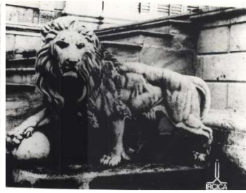
Figür 25. Top tutan diğer aslan heykeli