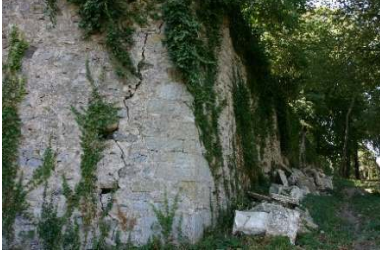
Figür 16. Bitki kökleri nedeniyle bahçe duvarında oluşan çatlak

bahçelerdeki bazı yollar, merdivenler, duvarlar ve süs havuzlarına ait kalıntıların bitkiler ve toprak ile kaplanması sonucunu doğurmuştur (Figür 19, 20).