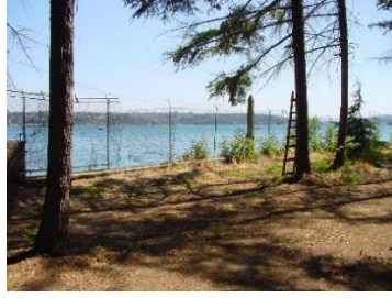
Figür 22. Kırılarak denize düştüğü için yerlerinde olmayan taş babalar ve demir parmaklıklar