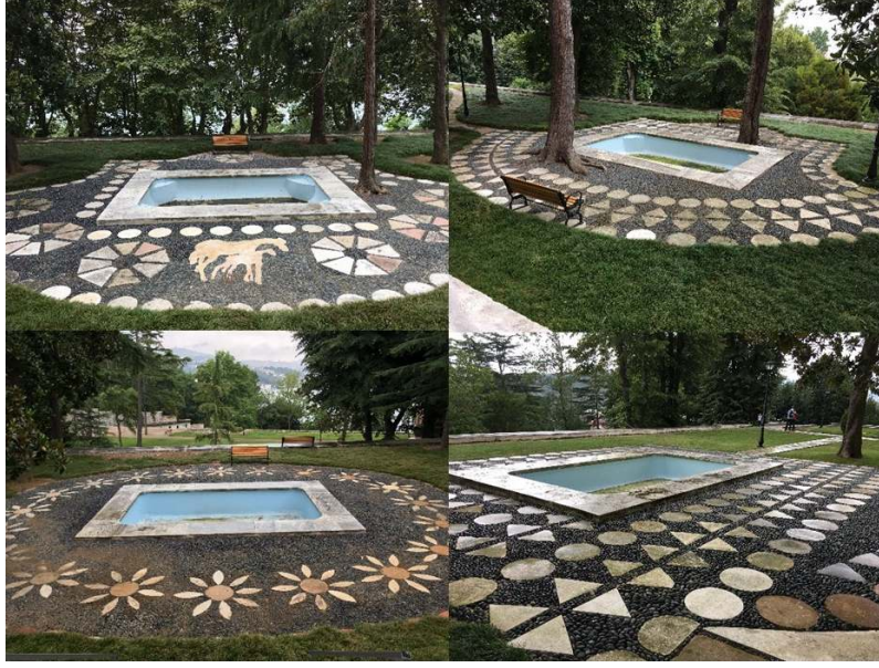
Figür 3. Kasrın bulunduğu beşinci (en üst) set bahçesinde, kasrın dört cephesine karşılıklı gelecek şekilde yerleştirilmiş, etrafı mozaik döşemeyle süslenmiş havuzlar

Kasrın bulunduğu setin altındaki dördüncü set bahçesinde, yine kasrın her cephesine karşılık gelecek şekilde, üst bahçedeki havuzlar ile aynı düzlem üzerinde dikdörtgen havuzlar yer alır. Aynı düzlem üzerindeki set duvarlarında ise sade mermer çeşmeler bulunmaktadır (Figür 4).