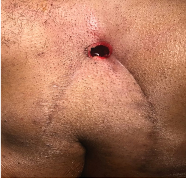
Şekil 3: Kristalize fenolün sinüs boşluğu tamamen dolacak şekilde uygulanması