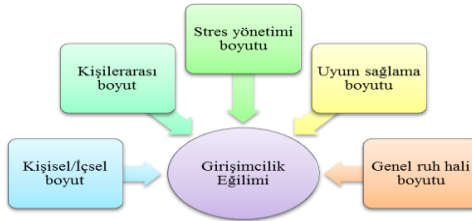
Şekil 1: Araştırma modeli (Bar-On Modeli)

Araştırmanın temel amacı duygusal zeka alt boyutlarının girişimcilik eğilimi ile ilişkisinin ölçülmesidir. Bununla birlikte katılımcıların demografik özelliklerinin girişimcilik eğilimi ile ilişkisi analiz edilmeye çalışılmıştır. Buna göre çalışmada kullanılan Bar-On modeli (2000:365) aşağıdaki şekil yardımıyla gösterilmiştir.