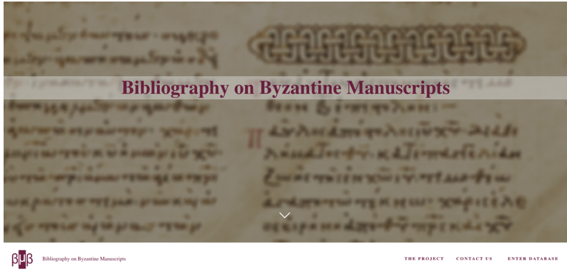
Şekil 1 “Bizans El Yazmaları Bibliyografyası” ana sayfa