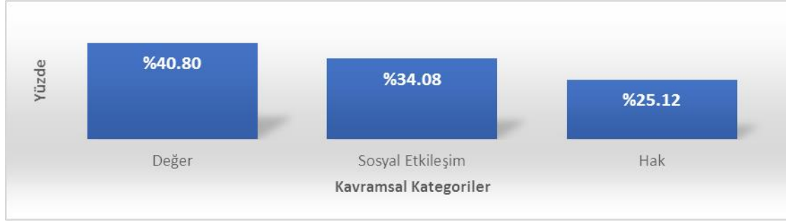
Grafik 1. Kavramsal kategorilere ait yüzdeler

Katılımcılar, fairplay ifadesini en çok “değer” kavramsal kategorisi ile ilişkilendirmişlerdir (%40.80). Sırasıyla, “sosyal etkileşim” (%34.08) ve “hak” (%25.12) araştırmacılar tarafından atfedilen diğer kavramsal kategorilerdir. Kullanılan metaforlar ve gerekçelerini içeren alıntıların kime ait olduğunu belirtmek için gerekçelerin sonuna bazı bilgiler eklenmiştir. Cinsiyetleri belirtmeye yönelik erkek katılımcılar için E, kadın katılımcılar için K kısaltmaları kullanılmış ardından katılımcının uğraşı alanları yazılmıştır.