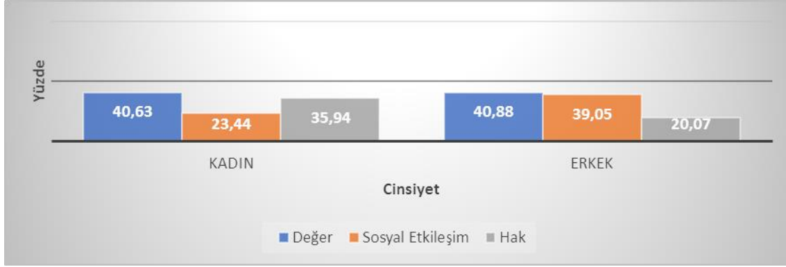
Grafik 2. Cinsiyetlere göre kavramsal kategorilerin kullanımı.

Grafik 2 cinsiyetlere göre kavramsal kategorilerin yüzdelik değerlerini göstermektedir. Erkek ve kadın katılımcıların en çok tercih ettikleri kavramsal kategori “değer”dir. Kadın katılımcılar “hak” kavramsal kategorisine ilişkin metaforları (35.07) erkek katılımcılardan daha fazla kullanmışlardır. Hak kavramsal kategorisi erkekler tarafından daha az tercih edilmiş olduğu görülmektedir (%20.07). Kadınların ise en az tercih ettikleri kavramsal kategori “sosyal etkileşim”dir.