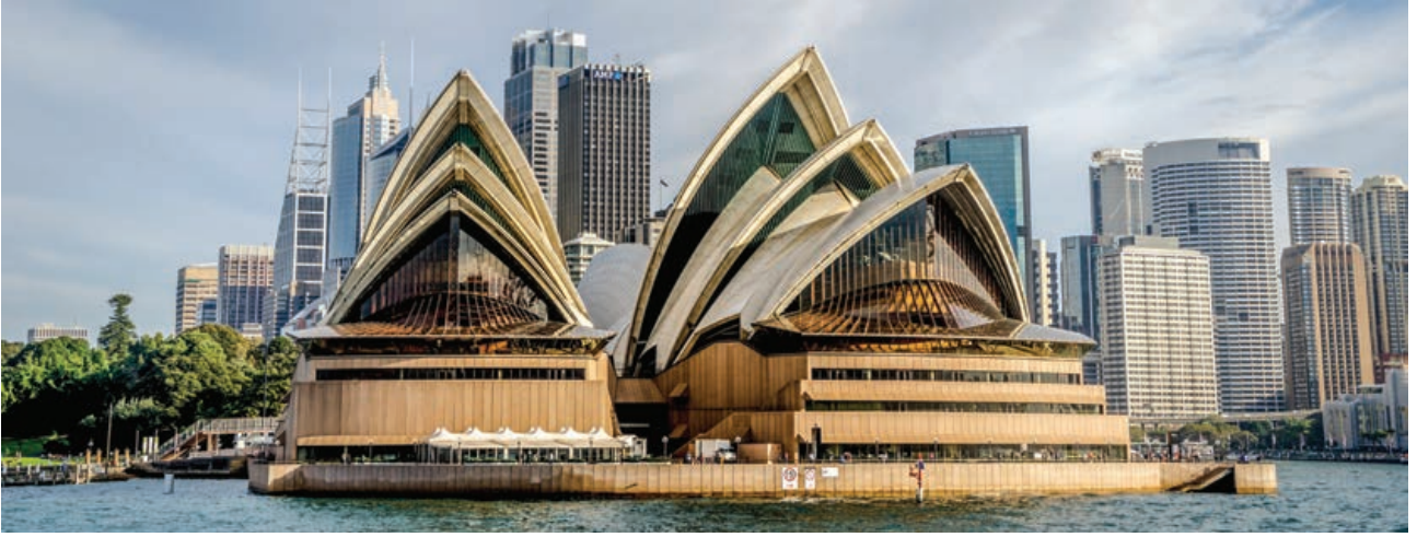
Şekil 3. Sydney Opera Binası, Avustralya, Mimar: Jorn Utzon, tasarım ve uygulama: 1957-1973, Dünya Mirası Listesi'ne kabulü 2007/166rev, (34 yaşında listeye girdi).