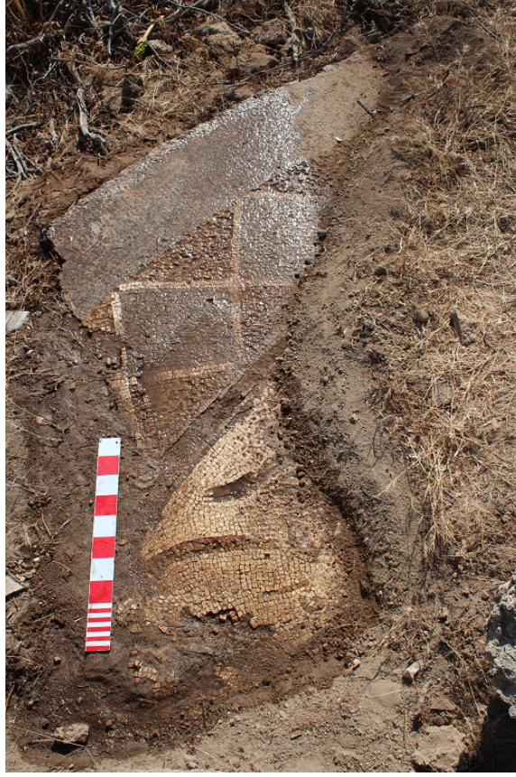
Resim 4a) Ada üzerindeki yapılardan birinde bulunan mozaik