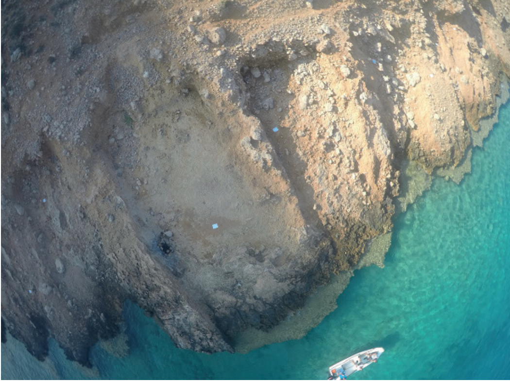
Resim 3a) Dana Adası tersanesine ait çekek yerlerine örnekler