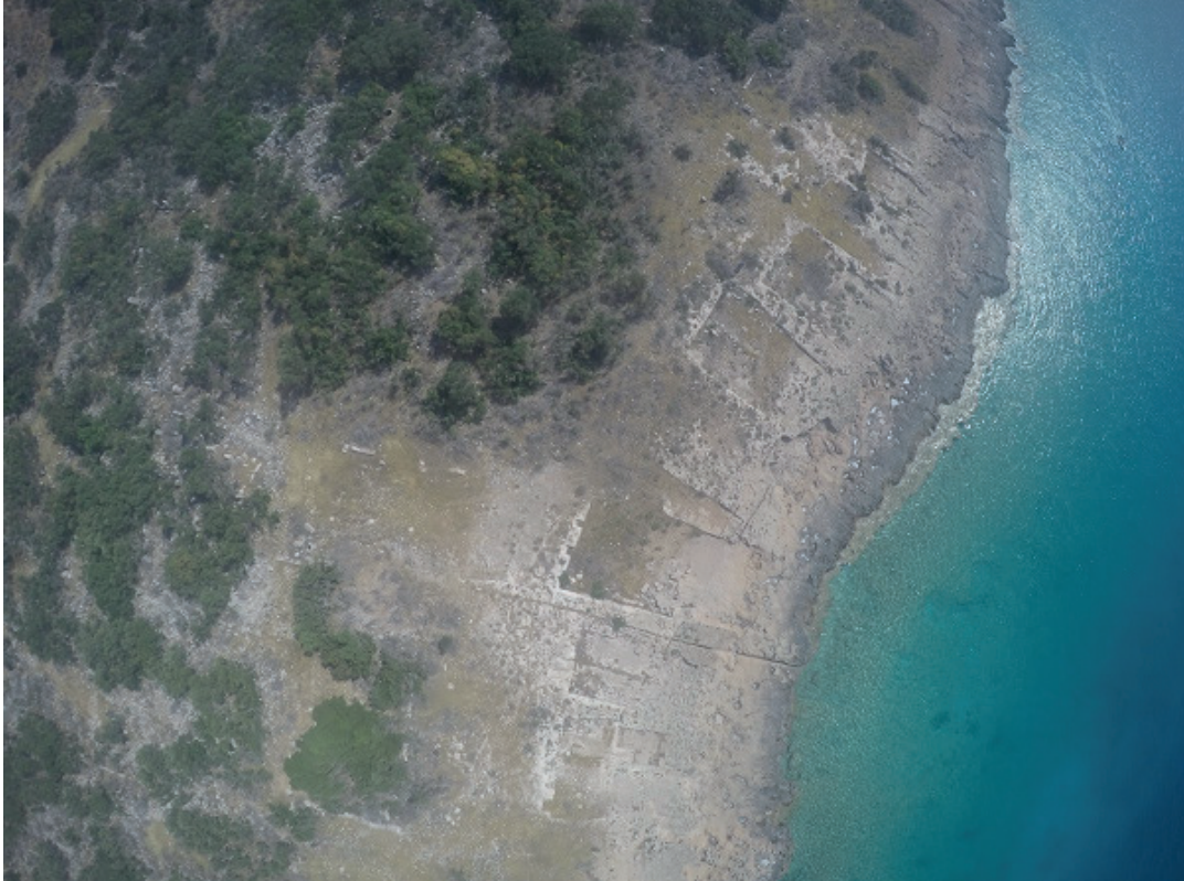
Resim 3b) Dana Adasındaki çekek yerlerinden örnekler. Arka sıralarda tersane alanıyla bağlantılı yapı kalıntıları bulunmaktadır.