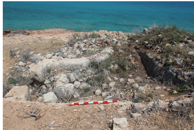
Resim 4c) Ada üzerindeki kiliselerden birine ait kalıntı