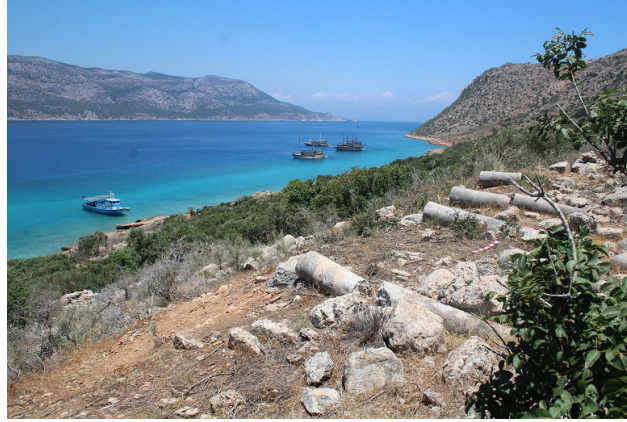
Resim 4b) Bitki temizliği sonrası ortaya çıkan sütunlu yapı.