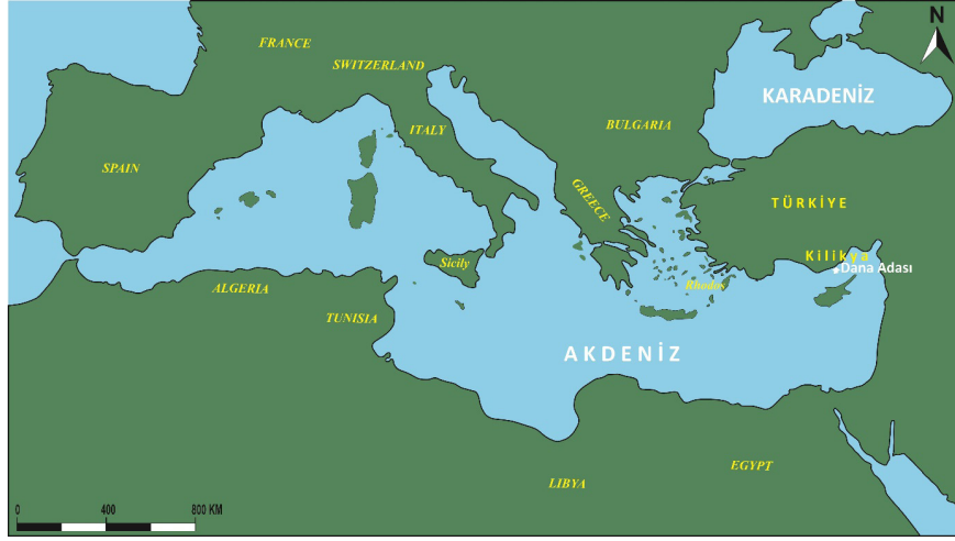
Resim 1) Kilikya ve Dana Adası