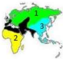
Şekil 2. Kont Joseph Arthur de Gobineau'ya Göre Irk Sınıflandırması (Lopez, 2000: 967-972).

İnsanları ırklara ayırmanın yanında her ırka ayrı özellikler atfeden Gobineau; beyaz ırkı üstün tutmuştur. Çalışmalarında genetik, psikolojik ve ahlaki açılarından beyazların