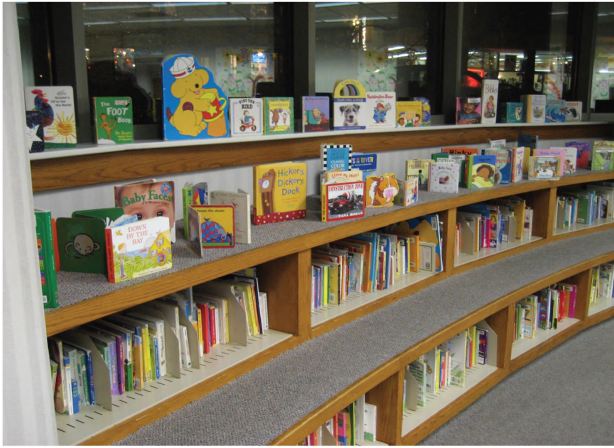
(Resim 1): Kitap rafları

Yeterli materyali bulundurmaya kadar o materyallerin sunumu da önemlidir. Bu bağlamda, MİHK'nin çok başarılı bir sunum yaptığını söylemek mümkündür, çünkü raflarda bulunan materyaller düzgün ve her an erişime hazır konumdadır. İkinci olarak, yaş gruplarına göre hazırlanmış raf boyları da ayrıca okuyucular için bir çekim kaynağıdır. Örneğin, 2-3 yaş çocukları istedikleri kitapları boyları hizasında bulunan raflardan çekip alabilmekte ve yine kendi boyları için hazırlanan masa ve sandalyelerde bu kitapları kendilerine göre okuyabilmekte.