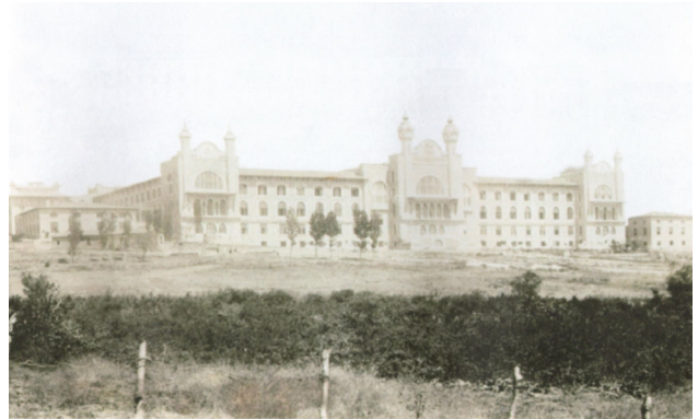
Fotoğraf 5. Mekteb-i Tıbbiye-i Şâhâne'nin inşa edildiği tarihlerdeki genel görünümü (İstanbul Üniversitesi Nâdir Eserler Kütüphanesi, 90558/1)