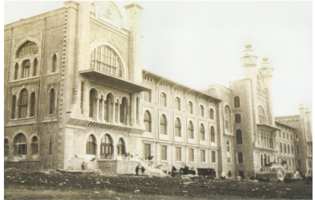
Fotoğraf 3. Mekteb-i Tıbbiye-i Şâhâne'nin açılış töreni için yapılan hazırlıklardan bir görünüm (Sarı, Akgün, & Kurt, 2011)