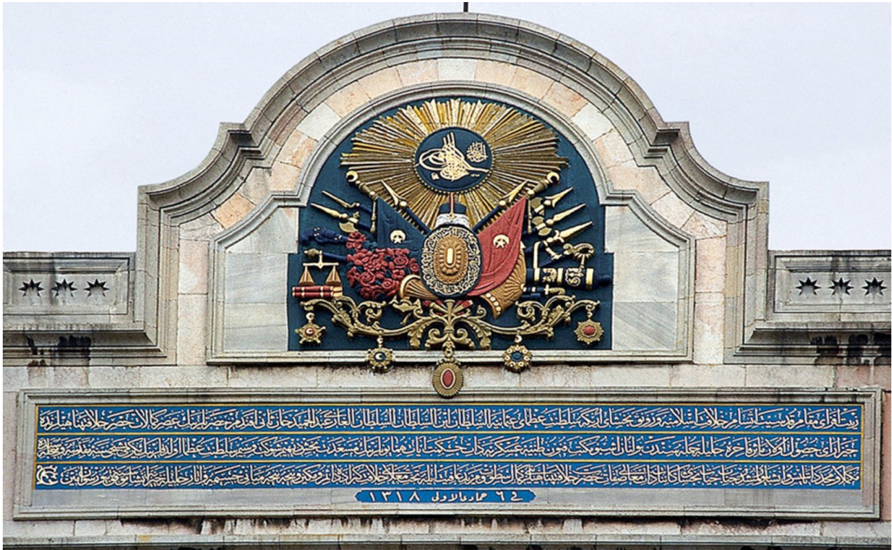
Fotoğraf 1. Mekteb-i Tıbbiye'nin Marmara'ya bakan tarafındaki arma ve kitabesi (Sarı, 2004)

Kitabeden de görüldüğü üzere Mekteb-i Tıbbiye binasına Sultan Abdülhamid'in saltanatının yirmi beşinci yılı olan 1 Eylül 1900 tarihi atılmıştır. Ancak bu binanın açılışı 6 Kasım 1903 yılında gerçekleştirilmiştir. İşte tam da bu noktada binanın geç açılışı ile ilgili birtakım iddialar ortaya atılmaktadır. Bu iddiaların en yaygın olanı inşaatın 1900 yılında tamamlandığı hâlde,