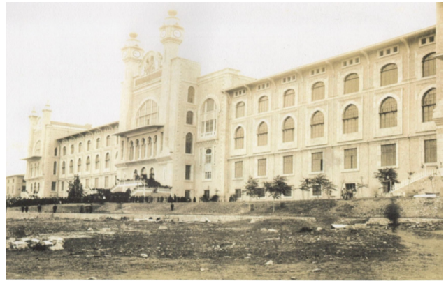
Fotoğraf 4. Mekteb-i Tıbbiye-i Şâhâne'nin 6 Kasım 1903 tarihinde yapılan açılış töreni (Sarı, Akgün, & Kurt, 2011)