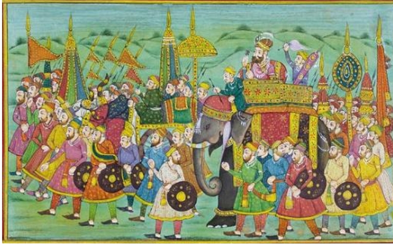
Resim 8: Filler ve Yanlarında İlerleyen Piyade Birlikleri (Rajasthanî Minyatürü, Hindistan, geç 19. yüzyıl veya erken 20. yüzyıla ait bir eser).

Selçuklu Devleti ve Gur Devleti savaşçıları tarafından fillerin etkisiz hale getirilme yöntemi fillerin sürekli piyâde birlikleri tarafından korunması gerekliliğini daha anlaşılır bir hale getirmektedir. Söz konusu koruma sağlanamaz ise bu devasa hayvanları etkisiz hale getirebilmek mümkün olmaktadır.