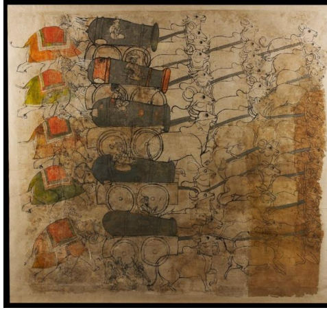
Resim 3: Babürlüler Devrinde Fillerin İtiş Gücü Sayesinde Ağır Topların Taşınması (18. yüzyıl ortaları, Kota).

http://jameelcentre.ashmolean.org/collection/8/sort_by/date/sort_order/asc/per_page/25/offset/0/object/12423 (11.07.2019); "Ashmolean Museum": https://tr.pinterest.com/pin/206743439114004572/ (11.07.2019).