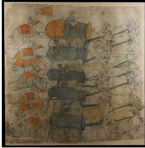
Resim 2: Babürlüler Devrinde Fillerin İtiş Gücü Sayesinde Ağır Topların Taşınması (18. yüzyıl ortaları, Kota).