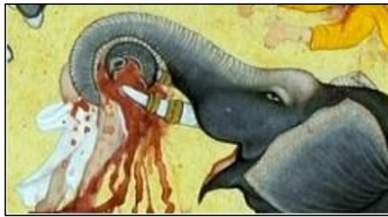
Resim 5: Yutak ve Sinelerin Yolunu Tutan Fil Dişleri (Ekbernâme, Sanatçı: Miskina).

Görüldüğü üzere fırtına ve sağanak yağışlar sonucu akıntı şiddeti çok artan ve suları kabaran büyük nehirlerden ancak güçlü filleri ve atları olan askerler geçebilmektedir. Böyle yerlerden geçerken süvariler için atların fillere göre daha büyük tehlike arz ettikleri anlaşılmaktadır. Bu nedenle de padişahlar bu tip akarsuları fil sırtında geçmeyi tercih etmektedirler. Fillerin en önemli savaş vasıtalarından biri de dişleri olmuştur. Filin hortumunun iki tarafında, üst çenesinde iki büyük dişi vardır; bu dişleri dayayarak duvarları ve ağaçları zorlayıp yıkar. Vuruşma veya herhangi zor bir işi de bu dişlerle yapar. 51 Hindistan’da savaş fillerinin dişlerinin demirle/çelikle kaplanıp üzerine de zehirli hançer, kılıç vb. kesici aletler takıldığı görülmektedir. Timurlular devri müverrihi İbn-i Arabşah, fildişlerinin düşman üzerindeki etkisini şöyle açıklamaktadır: Fillerin dişleri mızrak gibi yutakların yolunu tutabilmekte; kılıç gibi adamların ve büyüklerin göğsüne oturmaktadır. 52