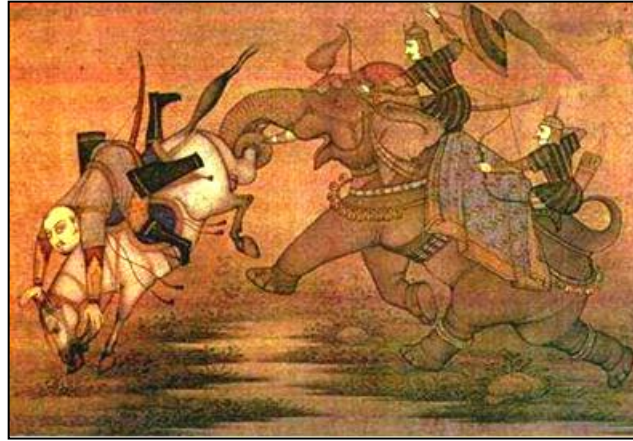
Resim 6: Fillerin Düşman Suvârisi ve Atını Hortumlarıyla Kemet Gibi Kapıp Fırlatması.

Fillerin doğal silâhlarından biri de yer fıstığına zarar vermeden kabuğunu kırabilecek kadar hassas ve bir ağacı kökünden sökebilecek kadar kuvvetli olan hortumlarıdır. Hortumları ile 350 kg. kadar yükleri havaya kaldırabilmektedirler. 53 Filler güçlü hortumları ile etraflarındaki insanları kapıp fırlatabilmektedirler. Tâcuddîn Debîr, fillerin hortumları ile insanları kapıp havaya fırlatmasını şu şekilde betimlemektedir: “Saf kıran filler ki... çevgân [sopası] benzeri hortumu ile taburun başlarını top gibi hava üzerinde uçuruyordu.” 54 Bu ifadelerden fillerin hortumları ile kaptıkları savaşıları çevgân topu gibi havaya doğru fırlattıkları anlaşılmaktadır. Filler insanları havaya fırlatmalarının yanı sıra atıyla birlikte suvârisini bile çekebilmektedir. Nitekim Babürlülür devri eseri Âîn-i Ekberî 'de mest halindeki bir filin hortumu, atı ile birlikte süvariye çeker kaydı yer almaktadır. 55 File savaş çalgıları ve ilaç ile de mestlik durumu verilebilmektedir.