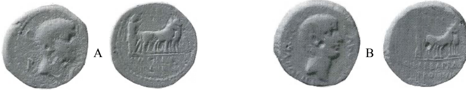
Resim 9. Saban Süren Rahip Betimli Parium Sikkeleri