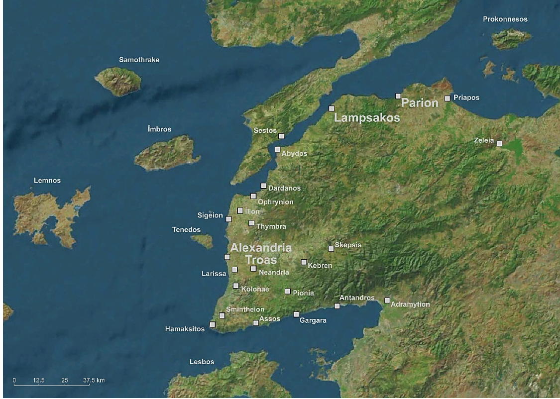
Resim 1. Troas Yerleşimleri

Anadolu'nun kuzeybatı ucunda yer alan Troas, M.Ö. 1. yüzyılın ikinci yarısı ilk yıllarında Roma kolonizasyonuna şahitlik etmiştir. Iulius Caesar'ın önderliğinde başlayan bu süreçte Grek polisleri Lampsakos (Lapseki) ve Parion'a 1 Roma koloni statüsü verilirken, bunu takip eden yıllarda, Augustus döneminde Aleksandreia Troas'ın da bir Roma kolonisine dönüştürüldüğü anlaşılmaktadır (Resim 1).