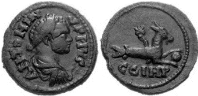
Resim 4. Caracalla Döneminden Parium Sikkesi

Sikkeler üzerinde belirtilen dört harfli lejantın üçüncüsü olan "I" harfi ise Iulia isminin yani daha doğru bir ifade ile Caesar'ın ve Augustus'un mensup olduğu "Iulia" ailesinin kısaltılması olup (Keppie 2000: 125), son harf olan "P" ise açık bir şekilde Parium'un ethnikonu ve ilk isminden ileri gelmekteydi.