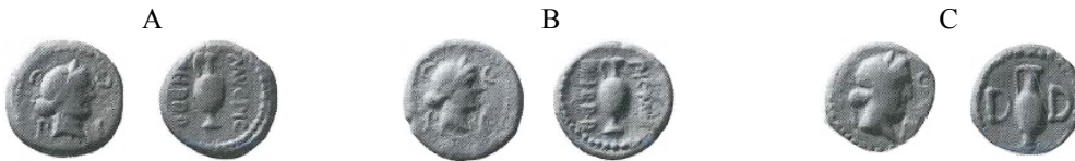
Resim 8. Praefericulum Betimli Parium Sikkeleri

M.Ö. 1. yüzyılın ikinci yarısına gelindiğinde Parium'da siyasi anlamda bir dizi değişim gözlemlenir. Yerleşim için bu yeni dönemin yani köklü bir Grek polisinden Roma kolonisine dönüşümün ilk kanıtlarını, Latince lejantlı koloni sikkeleri oluşturur.