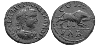
Resim 6. S. Alexander Döneminden Parium Sikkesi