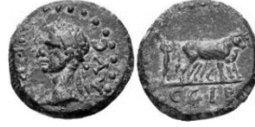
Resim 3. Nerva Dönemine Tarihli Parium Sikkesi