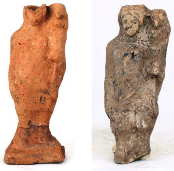
Levha 4. Çocuk Taşıyan Kadın Figürinler (Kourotrophoslar)

Bazı durumlarda kourotrophoslar aynı zamanda sağlık (iyileştirme) tanrıçasıdır 46 . Ateş kourotrophos ile alakalı önemli elementlerden biridir ve bunlar tarafından temizlik aracı ya da çocukları