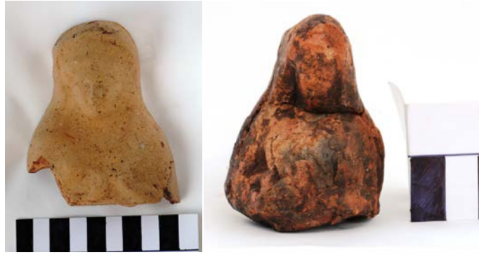
Levha 7. Göğsünü Tutan Kadınlar

Kaunos'ta ele geçen protom biçimli figürin khiton ve başın üzerine örtülmüş manto giymiştir. Başında tacı olduğu seçilebilmektedir. Önde iki elleriyle göğüslerini tutmaktadırlar. Çok aşındığı için detayları seçilemeyen bu örneğin benzerleri özellikle MÖ V. yüzyıl başlarından itibaren çok yaygındır. Bu tipin Rhodos'ta ortaya çıktığı kabul edilmekte ise de 90 M. Şahin Rhodos ve Kalymnos'tan ele geçen örneklerin en erken MÖ V. yüzyıl ortalarına ait olması nedeniyle Knidos'un bu tipin ortaya çıktığı merkez olduğunu düşünmektedir 91 . Bu tipteki protomların Şahin'in düşündüğü gibi Aphrodite'yi mi 92 yoksa adayanların bereket arzusunu mu simgelediği tartışmaya açıktır 93 . Tanrıça, rahibe ya da adorantları sembolize eden figürinler özellikle Kıbrıs'ta çok sayıda ele geçmiştir. Bunlar giysili ya da çıplak olarak göğüslerini tutmaktadırlar. Kıbrıs örneklerinin çıplak Astarte modelinin değişik