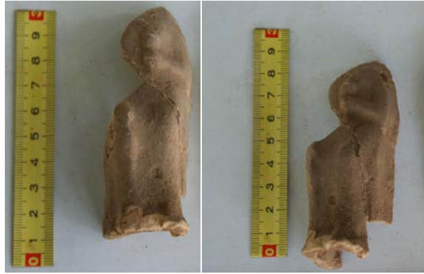
Levha 9. Tahtta Oturanlar

Bu tipe ait tek bir örnek ele geçmiştir 105 . Gövdenin sol üst kısmı ve bacaklar korunmuş olup diğer kısımları eksiktir. Elinde bir haşhaş kapsülü tutmaktadır. Baş kısmı eksik olduğu için başında polos ve örtü olup olmadığı belirsizdir. Bu buluntu Kaunos'tan ele geçen Arkaik Dönem'e ait nadir örneklerden biri olduğu için bu kutsal alanın tarihlendirilmesi ve adakların dönemsel sentezi için özellikle önemli bir yere sahiptir. Bunlar önemli kişilerden Demeter ve Hera gibi tanrıçalara kadar değişen yorumlarla değerlendirilmektedir 106 . Taht krallara ve tanrılara özgü olarak kabul edilebileceği için 107 bu figürinlerin tanrıçaları, olasılıkla da Demeter'i sembolize ediyor olmaları güçlü bir olasılıktır. Ancak Karataş'ın da vurguladığı gibi bunların yüksek statüye ait kadınları temsil etme ihtimali bulunsa da bunların evin ve ailenin korunmasına yönelik olarak adandığına dair veri bulunmaz 108 . Bu tip İo-nia ve Karia'daki Demeter Kutsal Alanları'nın buluntu grupları içerisinde en erken örnekleri teşkil etmektedir 109 . Bunlar şimdiye kadar Karia'dan Iasos 110 ve Theangela'da 111 , yakın coğrafyada ise Kos 112 , Khios 113 ve Lindos'ta 114 ele geçmiştirlerdir. Bunun dışında birçok yerde ele geçen 115 bu tür buluntular içerisinde en alışılmadık durum Kyrene'de