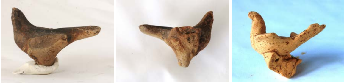
Levha 23. Güvercinler

Kaunos özeline bakıldığında thesmophoria şenliklerinin kutlandığına dair elimizde kesin veriler bulunmamaktadır. Henüz yavru domuzların atıldığı mağara tespit edilememiştir. Bununla birlikte domuz figürünü, domuz taşıyan kadın ve erkek figürlerini ve en önemlisi de çok sayıda ele geçen yavru domuz kemiği domuzun Kaunos'taki kült uygulamaları için önemli bir yere sahip olduğunu göstermektedir. Ancak bu domuzların kültte nasıl adandıkları net değildir. Yoğun ince yavru domuz kemikleri üzerinde herhangi bir yanma izi tespit edilememiştir. Ancak bunların tohumluklara karıştırmak için mağaralara atıldığına dair de verimiz yoktur. Kazılarda kutsal alanda kullanılmış bir altar da tespit edilememiştir. Kült uygulamalarına yönelik olarak elimizde sadece bir kısmının kırılarak kandiller içerisinde sunulduğuna dair tespitlerimiz mevcuttur.