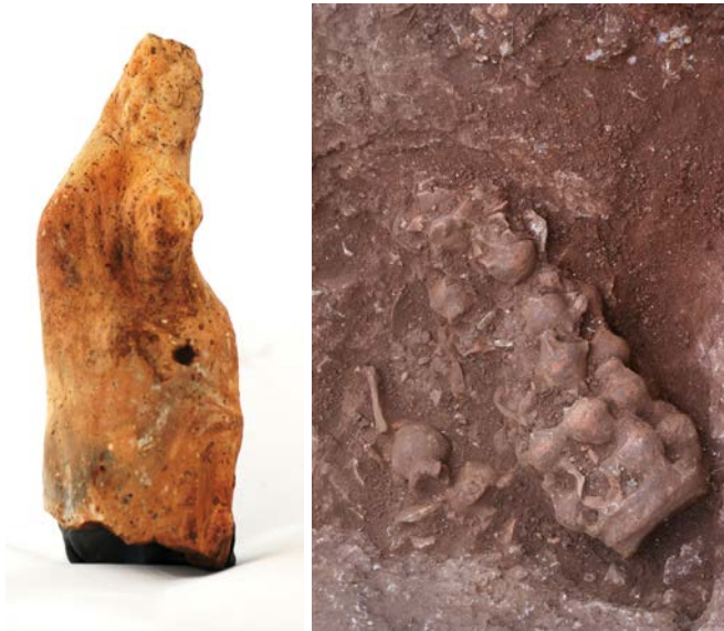
Levha 5. Kernos Taşıyanlar ve Kernos

neklein şimdiye kadar tespit edilememesi Kaunos'un bu külte verdiği önemi de göstermektedir. Bu kadar gösterişli hydria kernosunun (en az üst üste yedi hydria sırasından oluşmaktadır) kadınlar tarafından taşınmasının birçok kültte karşımıza çıkan sade hydria kernoslarına nazaran daha görkemli bir yapıya sahip olması dikkat çekicidir. Aynı hydria taşıyan kadınlar gibi hydria kernosu taşıyan kadınlar da ölümlü kadınları, olasılıkla da törenlere önderlik eden rahibeleri ya da kentin önde gelen ailelerinden seçilmiş kadınları temsil ediyor olmalıdır. Bu değişik formuna rağmen kalite olarak genelde ortalama bir işçiliğe sahiptirler.