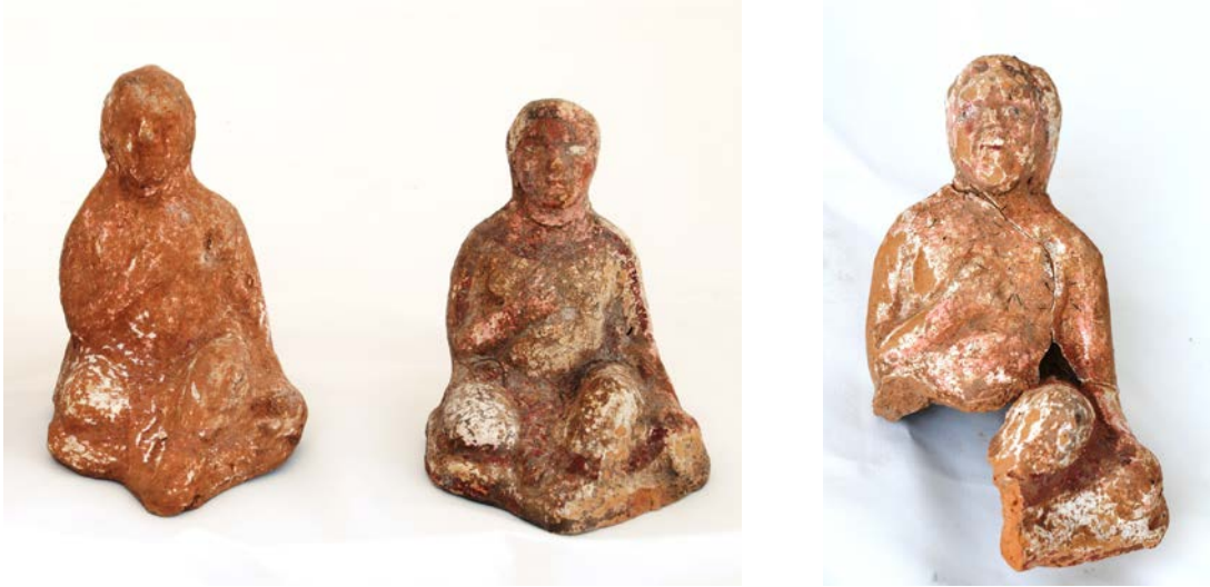
Levha 21. Çömelen ve Uzanan Çocuk-Genç Delikanlı Figürinleri (TempelBoys)