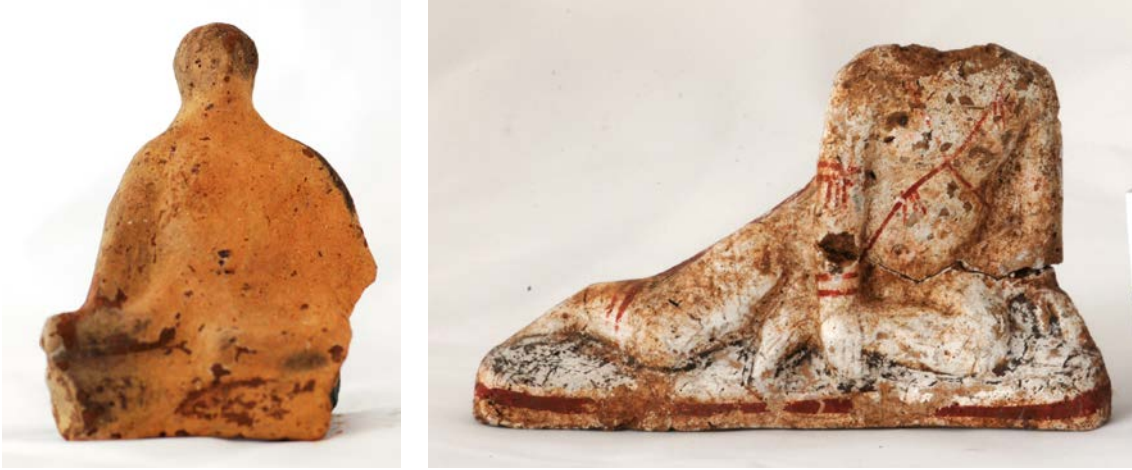
Levha 22. Çömelen ve Uzanan Çocuk-Genç Delikanlı Figürinleri (TempelBoys)