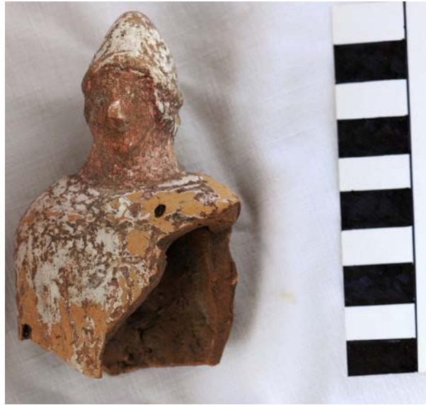
Levha 17. Sivri Başlıklı Genç

Yüz hatlarından genç bir delikanlı betimlemesi olduğu düşünülmektedir. Bu tipte yayınlanmış örneklerden bazıları ellerinde ya da ayaklarının yanlarında koç figürü tutmaktadır 195 . Bazı tipler ise başlarında aynı sivri başlık olmak üzere sıkı sıkıya mantolarına sarılmış olup ellerinde herhangi bir şey tutmazlar 196 . Bizim örneğimizdeki figürünün elinde ya da ayaklarının dibinde koç figürü olup olmadığı belirsizdir. Bu tipler genel olarak Hermes ile ilişkilendirilmektedir. Ancak sadece çok az örnekte daha kesin bir fikir ileri sürmek için kerykeion bulunmaktadır 197 . Aynı başlığı genç figürler içerisinde Dioskurlarda da görmekteyiz. Ancak Dioskurlar arkaya doğru atılmış ya da omuzda taşınan pelerin giyerler ya da bazen tamamen çıplaktırlar ve bu bakımdan bizim örneğimizden ayrılmaktadırlar 198 . Aynı şapkayı Hades'in taşıdığı da görülmektedir 199 . Demeter Kutsal Alanları içerisinde benzer bir örneğinin tarafımca bilinmediği bu figürünün khthonik özelliklerinden dolayı Hermes ya da Hades'e ait olması mümkündür. Ancak şu ana kadar tekil bir örnek olduğu için Kaunos'taki Demeter Kutsal Alanı'yla ve diğer Demeter Kutsal Alanları'yla ilişkilendirmek zordur.