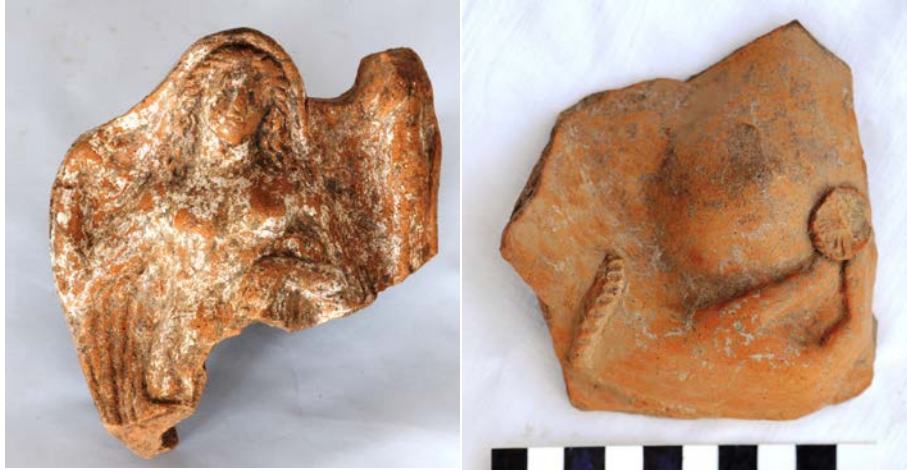
Levha 10. Çıplak Kadınlar

Yarı çıplak bir şekilde elbisesini çıkarırken ve yanında daha küçük yapılmış figür bulunan pek çok örnek bilinmektedir. Bunlardan bazıları Kaunos örneğindeki gibi başının üzerindeki örtüyü açarken betimlenmektedirler ve genellikle Aphrodite olarak tanımlanırlar 130 . Ancak giyinik ya da yarı çıplak olarak işlenmiş ve yanlarında küçük bir kız çocuğu olan Artemis betimlemeleri de mev-