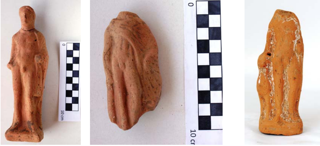
Levha 16. Ayakta Duran Çıplak Erkekler

Bu tipte örneklere Demeter Kutsal Alanları içerisinde Batı Anadolu'da, Ege Adaları'nda ve Kıta Hellas'taki birçok kutsal alanda rastlanılır 185 . F. Işık bunları Karia, Kos ve Rhodos ile sınırlarken bunların çömelmış çıplak çocuk figürinleri ile birlikte Doğu İon buluşu olması gerektiğini ileri sürmektedir 186 . Ayrıca bu figürinin hem sakallı olarak hem de genç olarak betimlenen Dionysos'un gençlik halini yansıtmış olabileceğini düşünmektedir 187 . Karataş ise bunları Hadzisteliou-Preis'a vurgu yaparak çömelen çocuklarla birlikte Mısır sanatına özgü olması gerektiğini ve çıplaklığın gençlikle bağlantılı olması gerektiğini ileri sürer 188 . Schipporeit ise bunların sakallı erkek figürinlerinin genç versiyonu olması gerektiğini ve hem sakallı hem de sakalsızların Plouton'u temsil ettiğini, sakalsız figürinlerin özellikle atribüt tutmadığı zamanlarda genç kızların evlenmeden önce evlenmeyi planladıkları damat adaylarına yönelik olarak kutsal alanlara bırakılmış olabileceğini ileri sürer 189 .