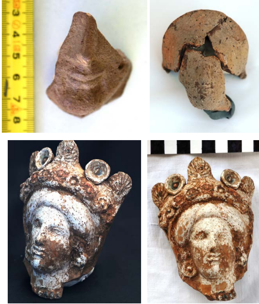
Levha 11. Kadın Başları

lerle süslü yüksek taç ya da polos taşıdığı görülmektedir 140 . Kaunos örneği çok gösterişli tacı, küpeleleriyle, büyüklüğü ve yüksek kalitesi ile tanrıçalardan birini temsil ediyor olmalıdır. Nispeten genç bir kadına ait olması gereken yüz Demeter'den daha çok belki de Hades'in kaçırdığı sırada çiçek toplayan ve yeraltından her defasında dönüşüyle baharı müjdeleyen Persephone'yi tasvir etmekteydi.