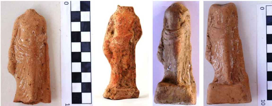
Levha 14. Domuz Taşıyanlar

Bu gruba ait dört örnek ele geçmiş olup bunlardan hiç birisinin başı korunmamıştır. C. Işık tarafından yayınlanan eserler içerisinde bu tipte bir örnek yer almamaktadır. Uzun manto giymiş figürinler sağ ayakları üzerine basmakta ve sol kol bükülmüş olarak elbise kıvrımlarının altında kaybolmuşken aşağıya doğru uzatılmış sağ kol ile bir domuzu arka kısmından taşımaktadır. Manto vücudun üst kısmını açıkta bırakmaktadır. Bu tipe ait örnekler Kaunos dışında Karia Bölgesi'nde rastlanmamıştır. Bununla birlikte Magna Graecia'daki Demeter Kutsal Alanları'nda nispeten fazla miktarda bulunmaktadır 181 . Yakın coğrafyada ele geçmeyip Güney İtalya'da ele geçmeleri nedeniyle Kaunos ile Güney İtalya arasında bir ilişki kurmaya yeterli veri yoktur. Ancak Kaunos'ta tipoloji konusunda önemli bir zenginlik göze çarpmaktadır. En azından Kaunos'taki kültün bu tipolojik farklılıklar nedeniyle bölgesindeki en önemli Demeter kült merkezlerinden biri olması gerektiğini ileri sürmek yanlış olmayacaktır. Değişik duruşlarda ve tiplerde olan bu tipe ait örneklerin ortak özelliği sakalsız genç erkekler için olmalarıdır. Bunlar da diğer adorant erkekler gibi bu kutsal alana adak bırakmaya gelen genç erkekleri sembolize ediyor olmalıdırlar.