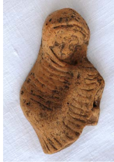
Levha 8. Mantosuna Sarılmış Kadın

Kaunos'ta bu tip şimdiye kadar tek bir eserle temsil edilmiştir. Mantosuna sıkı bir şekilde sarılmış, başını sertçe öne ve soluna döndürmüş bu figürin parçası da tekil örneklerdendir. Mantosuna sıkı bir şekilde sarılmış ve elbisesini çenesine kadar çekmiştir. Figürin Hellenistik Dönem kadın figürinlerinin en yaygın tipi olan 'pudicitia' pozunda kollar göğüs altında birleşecek ve bir elle yüze dokunulacak şekildedir. Bu tipteki figürinler atribüt tutmadıkları için belirgin bir şekilde yorumlanmaları zordur. Bununla birlikte bu duruş sınırlı bir utangaçlık, kendine yeterlilik şeklinde yorumlanmaktadır ve sadece ölümlü kadınlar bu biçimde betimlenmektedir 100 . Priene'de bu tipteki figürinlerin bir kısmı Demeter-Kore kutsal alanında ele geçmiştir 101 . Rumscheid bu tipteki eserlerden beş örneğin Demeter ve Kore Kutsal Alanı'nda ele geçmesini Smyrna'daki Hellenistik Dönem mezar