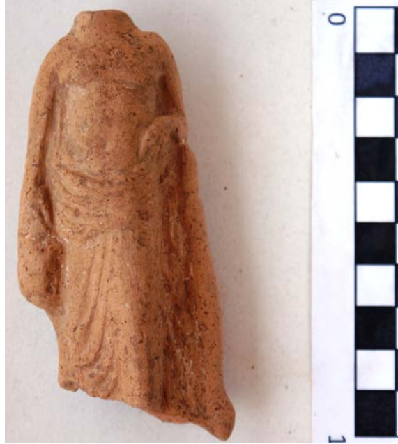
Levha 15. Oinochoe (?) Taşıyanlar

Kaunos'tan önceki dönem kazılarında üç örnek ele geçmiştir. İkinci dönem kazılarında ise sadece bir örnek tespit edilebilmiştir. Bu tek örneğin elinde tuttuğu cisim tam olarak tespit edilememektedir. Tip domuz taşıyan erkek figürleriyle büyük oranda benzerlik gösterse de elinde tuttuğu cisim domuzdan daha farklıdır ve en yakın seçeneğin, örnekleri daha önce de ele geçmiş oinochoe olduğu düşünülmektedir. Ağırlığı sağ ayağa verilmiş olarak duran figür aşağıya doğru sarkıttığı sağ elinde bir oinochoe (?) tutmakta, sol eli ise öne kıvrılmış olarak aşağıya doğru sarkan elbise tomarını taşımaktadır. Sol kolu bir desteğe dayanmaktadır. Elbise vücudun üst kısmını açıkta bırakmaktadır 182 .