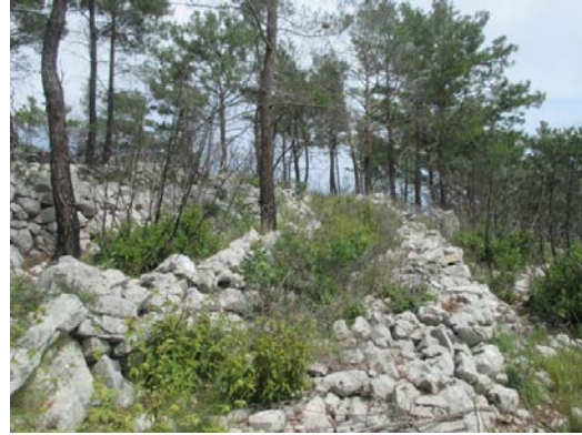
Fig. 3b. Tarım Terasları

Söz konusu yerde yalnızca dört bölmeli bir yapı tespit edilmiş olup, alanda başkaca herhangi bir yapı bulunmamaktadır. Bu yapının duvarları çift cidarlıdır, iç cidarca formsuz taşlar kullanılmışken dış cidarda daha büyük bosajlı taşlar kullanılmıştır (fig. 4a-d).