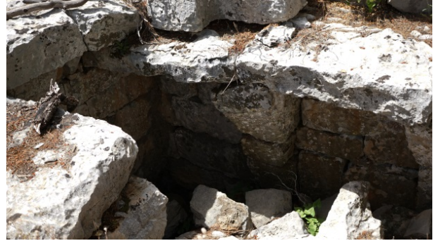
Fig. 5a-b. Avlu Kısımındaki Mezar/Sarnıç/Depo?