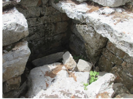
Fig. 5c-d. Avlu Kısımındaki Mezar/Sarnıç/Depo?