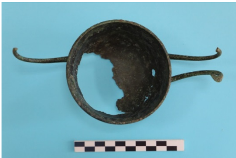
Fig. 21a. Kylix-2 Üst Görünüm