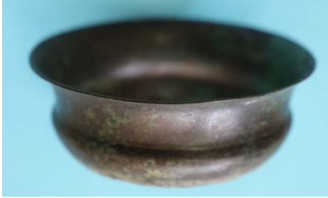
Fig. 20a. Kylix-1 Frontal Görünüm