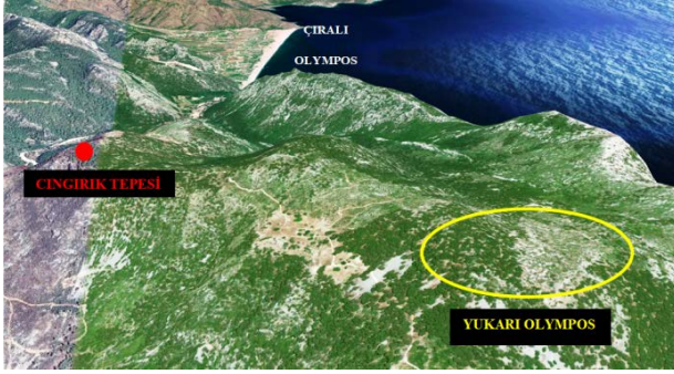
Fig. 1. Definenin Bulunduğu Alan