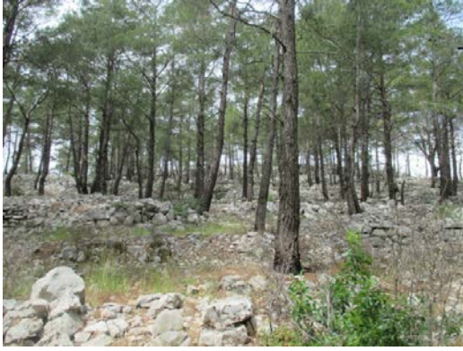
Fig. 3a. Tarım Terasları

Cıngırık Tepesi Mevkii'nde, formsuz taşlarla oluşturulan ve oldukça geniş bir alana yayılan tarım teraslarının varlığı gözlemlenmiştir (fig 3a-b).