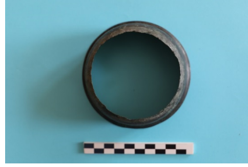
Fig. 19b. Kylix-1 Alt Görünüm