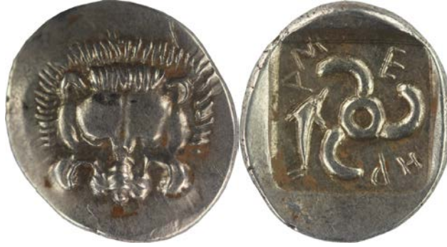
Fig. 7. Mithrapata (Kat. No: 26 – 5 kat büyütülmüştür)