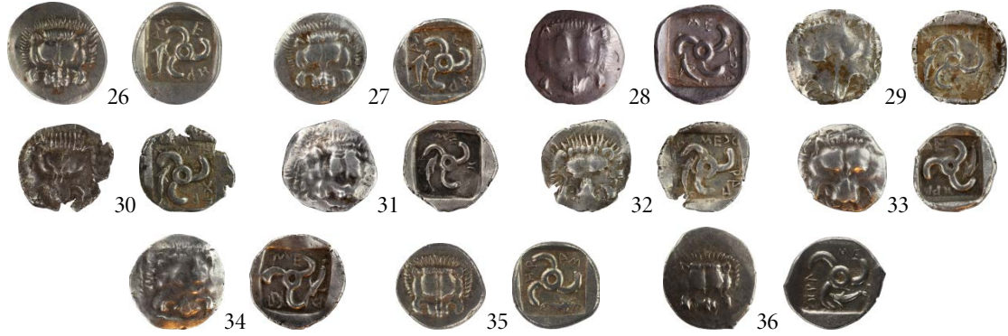
Fig. 11. Tip III (Yunus)