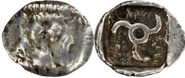
Fig. 8. Aruwätijesi (Kat. No: 68 – 5 kat büyütülmüştür)

de Likya'ya özgü bir formda triskeleslerin merkez çemberi boştur 7 . Dynastın ismi triskelesin kolları arasına yerleştirilmiştir.