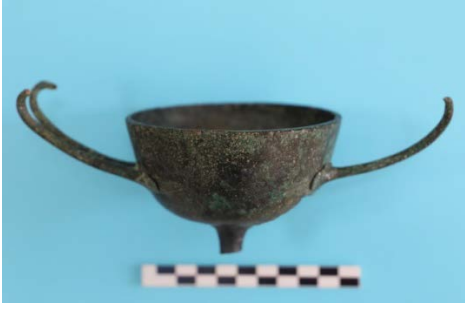
Fig. 22a. Kylix-2 Frontal Görünüm