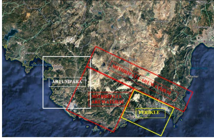
Fig. 15. MÖ 370 ya da MÖ 362 Yılı veya Az Öncesi Olası Durum (Google Earth – 14.05.2018)

Phaselis'i kuşattığı düşünülebilir 26 . Belki Mithrapata ve Aruwâtijesi bertaraf edilip Yukarı Olympos'tan çekildiği için, yani önünde engel kalmadığı için Perikle, Phaselis'i kuşatabilmiş olabilir. Nitekim Limyra Beyliği'nin doğu uç kalesi Eretepe'nin stratejik ve tahkimatlı yapısı 27 düşünüldüğünde hemen kuzey-kuzeydoğu-doğu bitişiğinde veya ardında en azından Perikle'ye Likya Krallığı yolunu açan ve MÖ 370 veya MÖ 362 öncesine tarihlenebilecek büyük savaş öncesi Eretepe'nin denize taraf ön kısmında kuvvetli bir yapılanmanın bulunması gerektiği önerilebilir.