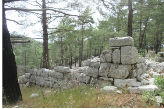
Fig. 4a-b. Dört Bölmeli Yapı ve Duvarı