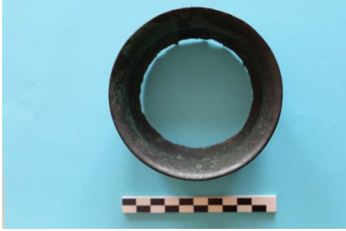
Fig. 19a. Kylix-1 Üst Görünüm