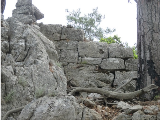
Fig. 16a. Yukarı Olympos Bosajlı Duvar