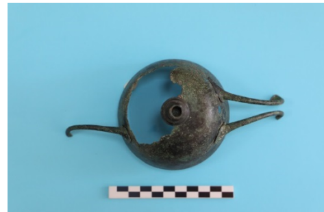
Fig. 21b. Kylix-2 Alt Görünüm