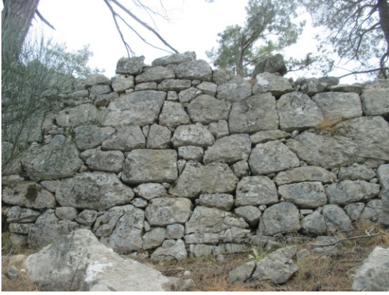
Fig. 17a. Yukarı Olympos Formsuz Taşlı Duvar