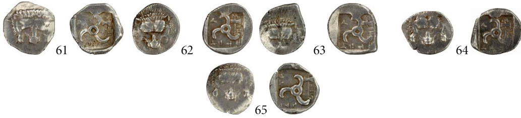
Fig. 13. Tip V (Balta)

Balta sembolü sağdaki boşlukta yukarıya doğru yerleştirilmiştir. Dynastın ismi V. 1a tipinde “M-EX/P-ƆPT/Ɔ” (= Mithrapata), V. 1b tipinde “M-EX/PƆP/Ɔ” (= Mithrapata) olarak yazılmıştır. V. 1a tipindeki 62, 63 ve 64 katalog numaralı sikkelerde arka yüz aynı kalıptır. V. 1a tipindeki 62 ve 63 ile V. 1a tipindeki 64 ve V. 1b tipindeki 65 katalog numaralı sikkelerde ise ön yüz aynı kalıptır.