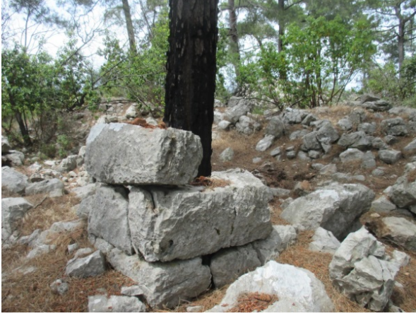
Fig. 6. Yukarı Olympos'ta Bulunan Bir Yapı Duvarı