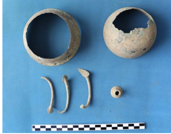
Fig. 18. İki Adet Bronz Kylix ve Parçaları