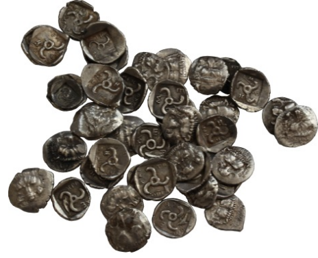
Fig. 2. Defineden Görünüm

Cıngırık Tepesi Mevkii'nde, formsuz taşlarla oluşturulan ve oldukça geniş bir alana yayılan tarım teraslarının varlığı gözlemlenmiştir (fig 3a-b).