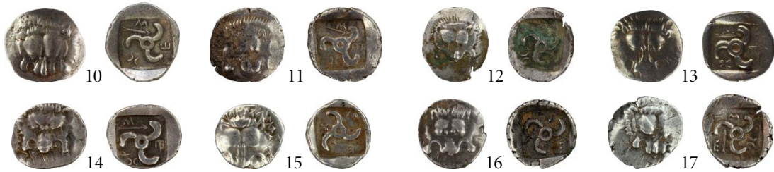
Fig. 10. Tip II (Mızrak)

Daha sonra Tip II. 1 ve Tip II. 2 lejanttaki farklar göz önüne alınarak ikişer alt gruba ayrılacak incelenmiştir. Bu tipte Mithrapata'nın ismi “MEX” veya “MEXP” kısaltması ile belirtilmiştir ve çoğunluğunda lejantın yönü soldan sağa doğrudur. Sadece II. 5 tipinde 17 katalog numaralı sikkede “M/E/X” kısaltması sağdan sola doğrudur. II. 1a tipinde 10 katalog numaralı sikkedeki “M/E/X” lejantının E harfi ise yatay bir konumda yukarıya dönüktür.