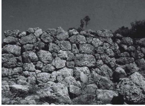
Fig. 17b. Avşar T. Formsuz Taşlı Duvar (Thomsen 2002, Res. 18.1)

Cıngırık Tepe çiftlik yapısı içindeki define MÖ 390-370/360 yıllarına önerilmekle beraber yapının inşa tarihinin örneğin MÖ V. yüzyıl sonu-IV. yüzyıl başı gibi veya biraz daha erken olması da mümkündür. Çünkü genişçe bir alana yayılarak oldukça büyük bir yerleşimin tüketimi için düzenlenen tarımsal bir alanın içerisinde MÖ 390-370/360 tarihli bir define bulunuyorsa bu yapı da en