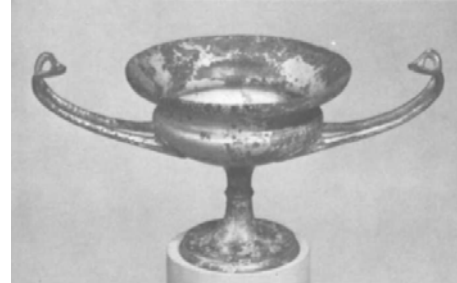
Fig. 20b. Bronz Kylix Örneği. (Bothmer – Mertens 1982, 15, S52)