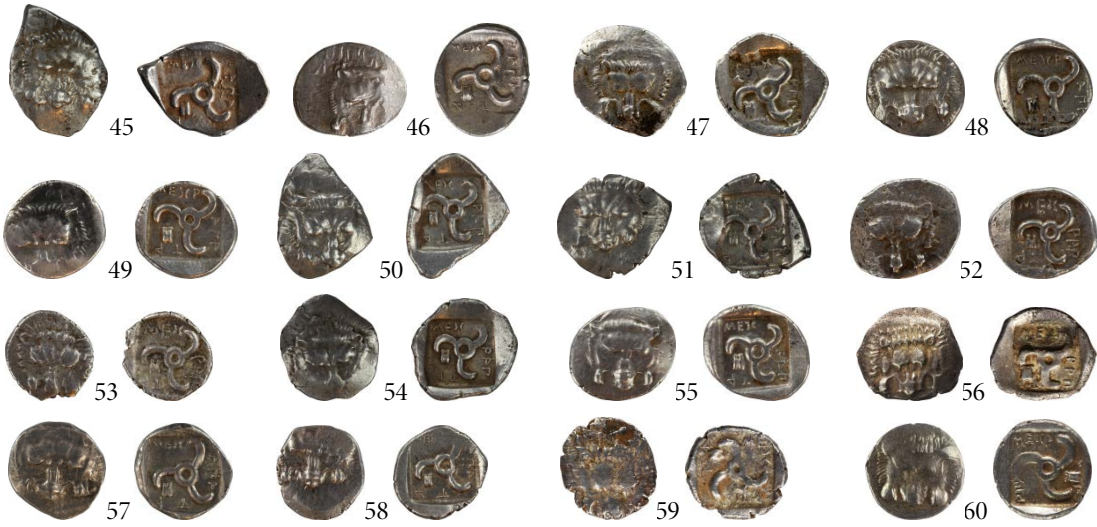
Fig. 12. Tip IV (Aşık Kemiği)