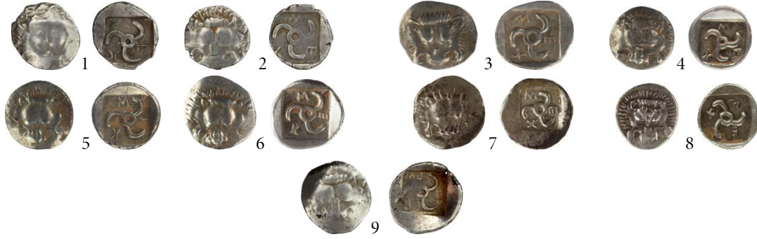
Fig. 9. Tip I (Sembolsüz)

Sembolsüz olanlar I. Grubu oluşturmaktadır. Triskelesin kolları arasında yer alan harfler göz önüne alınarak iki alt gruba ayrılmıştır. Tip I. 1’de lejant “M/E/X” (=Mith) şeklindedir. Bu grupta 5 ve 6 katalog numaralı sikkelerde aynı kalıp kullanılmıştır. Tip I. 2’de dynastın ismi “ME/TP/PT” (=Mizrap) şeklinde yazılmıştır. Burada “X” harfinin karşılığı olarak “T” harfi karşımıza çıkmaktadır (Kat. No. 9).