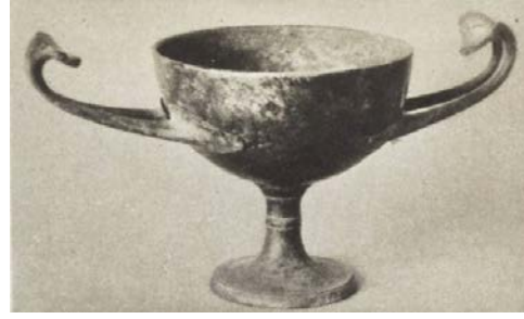
Fig. 22b. Bronz Kylix Örneği. (Richter 1953, 267. b)

Kylix-1 olarak adlandırılan ve daha büyük olan ilki, dışa savruk ağız kenarlı, iç bükey kısa boyunlu, boyundan gövdeye belirgin geçişli ve şişkin gövdeli olup, kaide üzerine denk gelen gövdenin dip bölümü ile kaidesi ve kulpları tamamen noksan, ağız çapı 10,5 cm'dir (fig. 19a-20a).