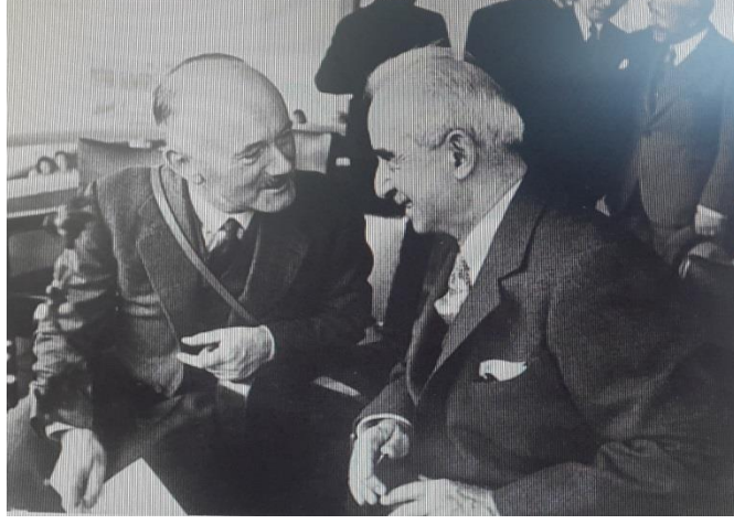
Resim 2: Türkiye Cumhurbaşkanı İsmet İnönü ve Sir Hughe M. Knatchbull-Hugessen (Adana)