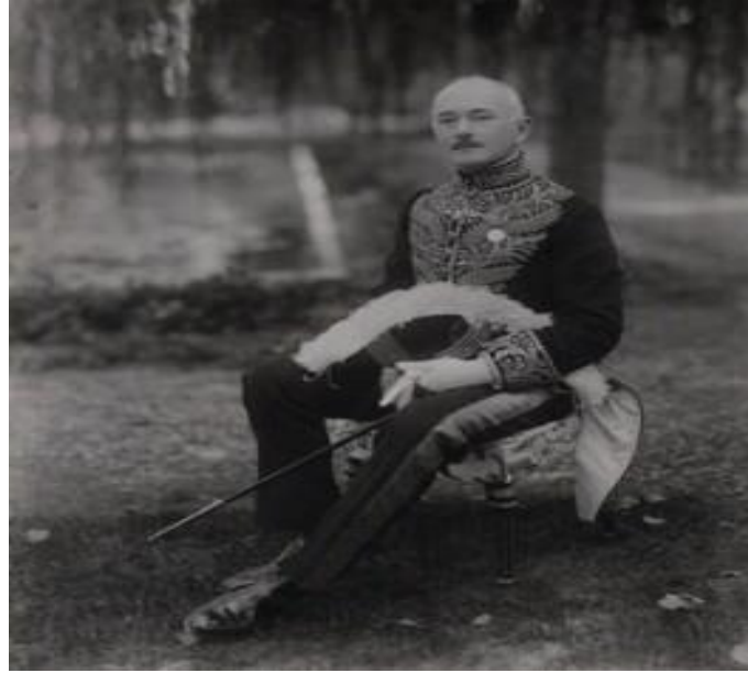
Resim 1: Sir Hughe M. Knatchbull-Hugessen