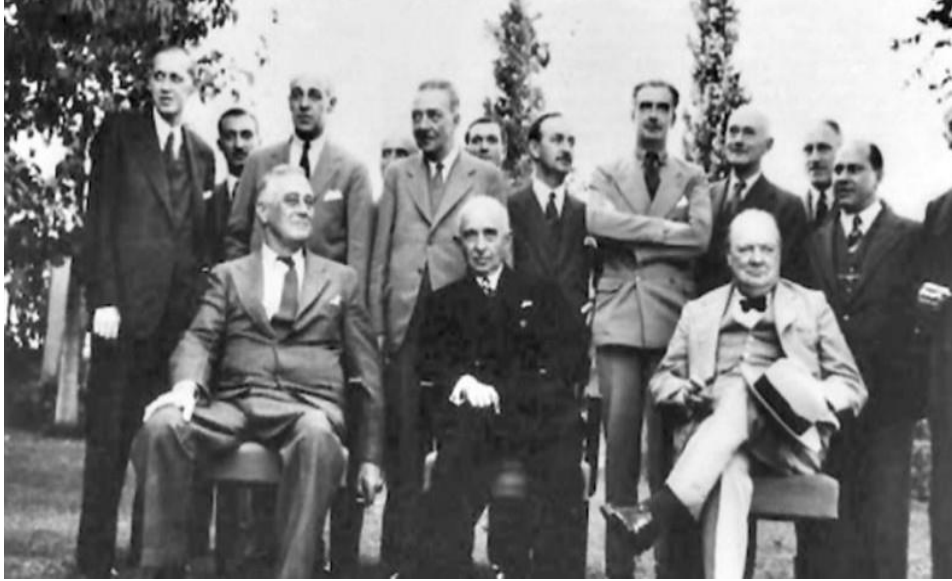
Resim 3: Adana Görüşmelerinde