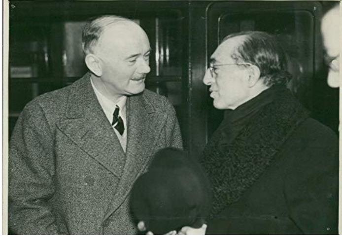
Resim 4: Türkiye Dışışleri Bakanı Tevfik R. Aras ve Sir Hughe M. Knatchbull-Hugessen