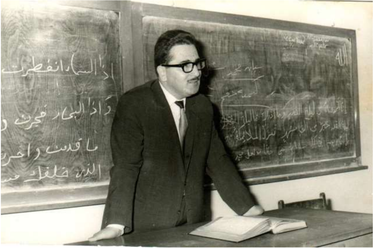
Resim 5: 1970 A.Ü. İlähiyat Fakültesinde ders anlatırken